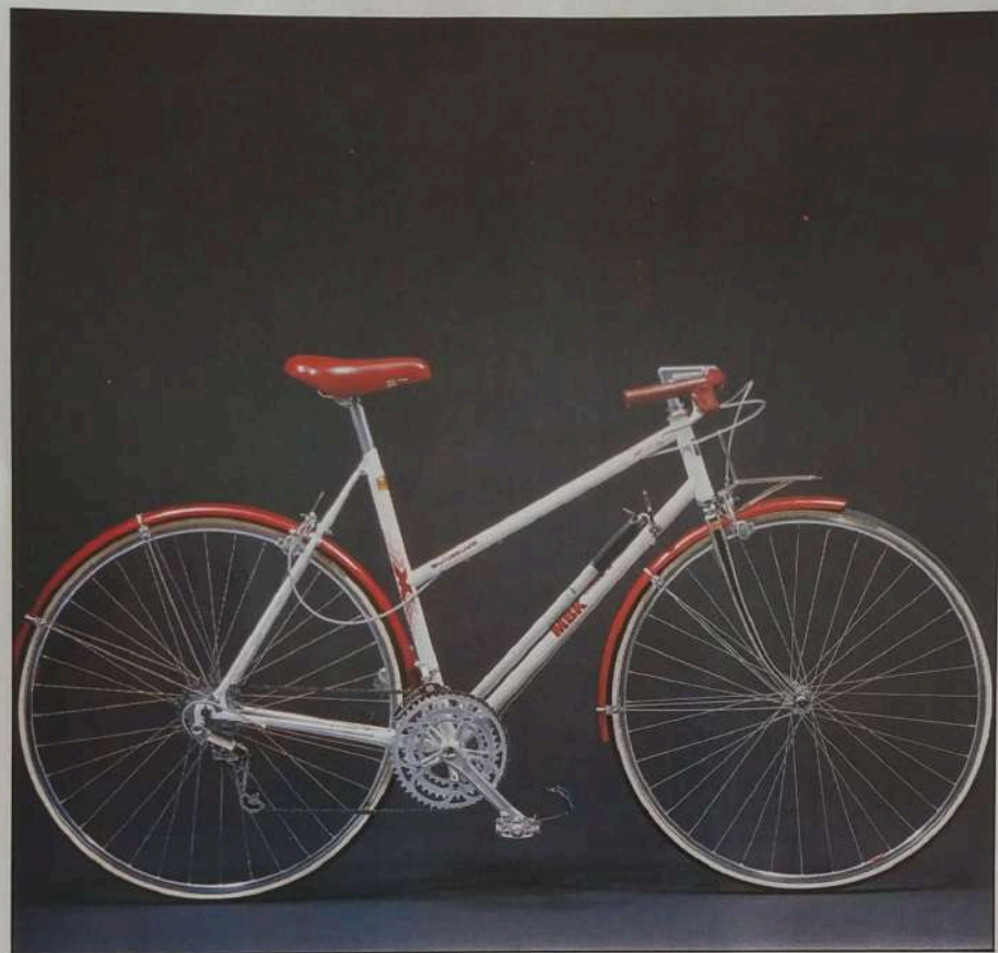
C 232 DA

lauréats de la Fondation pour le Raid, qui ont roulé sur toutes les routes du Monde.