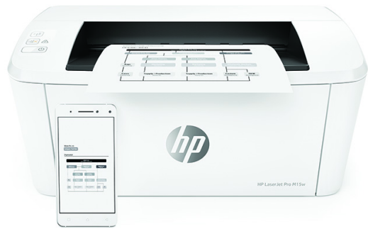
Impresora HP LaserJet Pro M15w

Impresora con seguridad dinámica habilitada. Para ser exclusivamente utilizada con cartuchos que utilicen un chip original de HP. Es posible que no funcionen los cartuchos que no utilicen un chip de HP, y que los que funcionan hoy no funcionen en el futuro. Obtenga más información en: http://www.hp.com/go/learnaboutsupplies