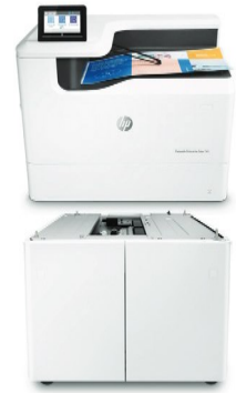
Bandeja de entrada de gran capacidad para 4000 hojas y soporte (P1V19A)

Admite tamaños de papel de hasta 297 × 432 mm