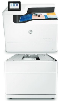
Bandeja de papel de 550 hojas y soporte (P1V17A)

Admite tamaños de papel de hasta 297 × 432 mm