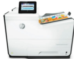
Impresora HP PageWide Enterprise 556dn a color

Admite tamaños de papel de hasta 305 × 457 mm