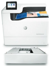
Bandeja de papel de 550 hojas (P1V16A)

Admite tamaños de papel de hasta 297 × 432 mm