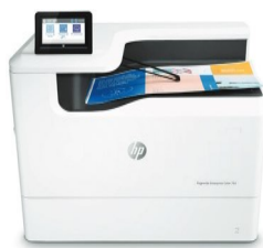
Impresora HP PageWide Enterprise 765dn a color