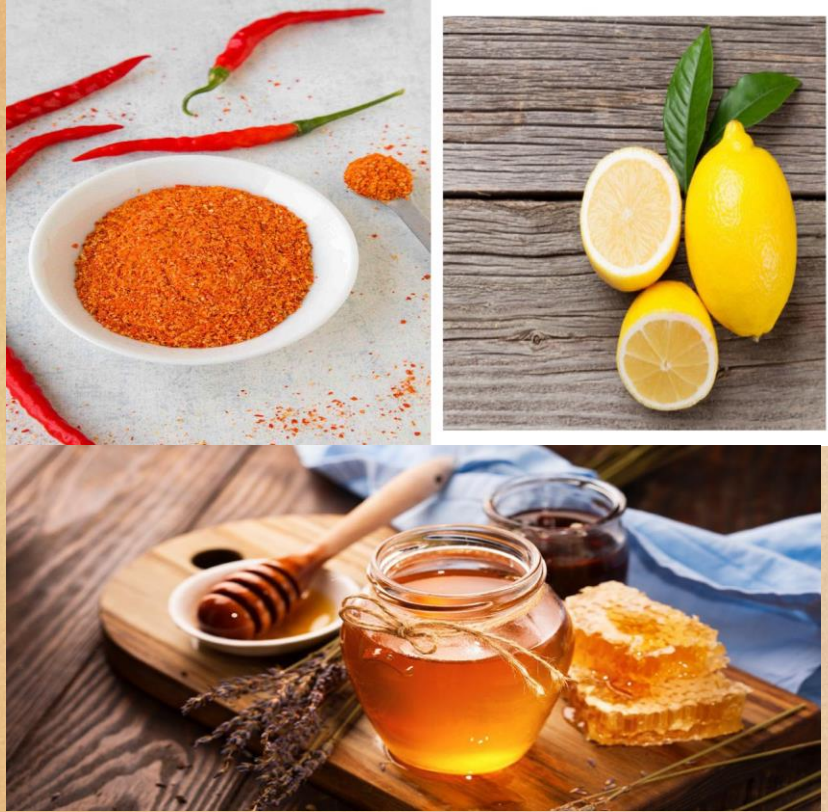
Poivre de Cayenne, miel et citron