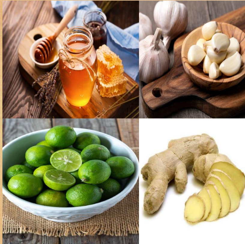
Miel, citron vert, gingembre et ail