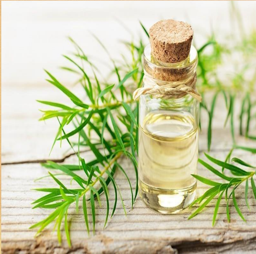
Huile d'arbre à thé

L'huile d'arbre à thé peut être utilisée comme nettoyant naturel qui aidera à nettoyer le cuir chevelu.