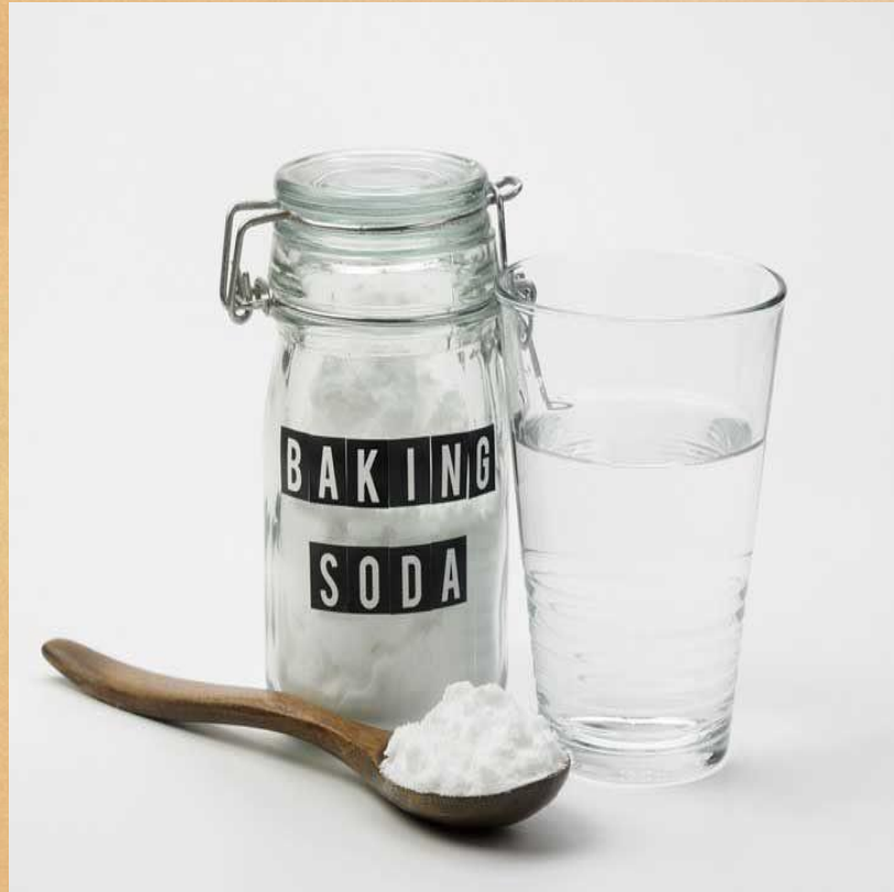
Bicarbonate de soude