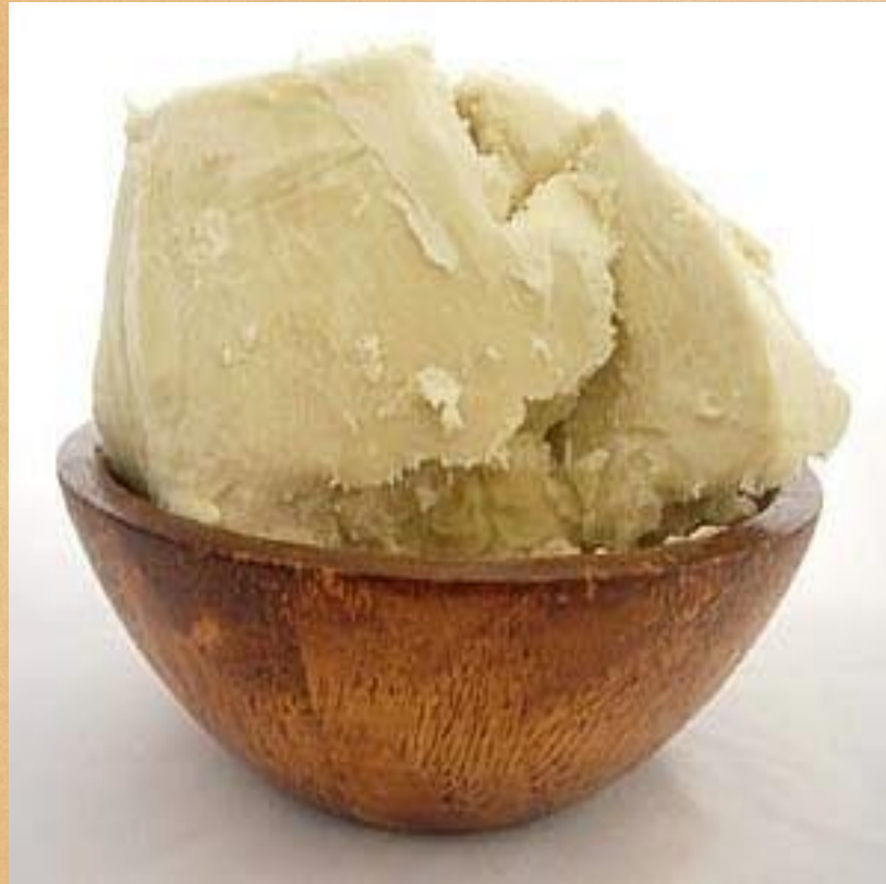
Beurre de karité brut

Et encore: Repentez-vous, l'Éternel a averti d'avance de ses châtements sur nos sœurs pour leurs péchés: Ésaïe 3:24 Au lieu de parfum, il y aura de l'infection; Au lieu de ceinture, une corde; Au lieu de cheveux bouclés, une tête chauve; Au lieu d'un large manteau, un sac étroit; Une marque flétrissante, au lieu de beauté.