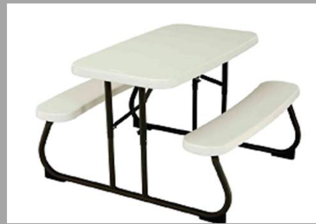
AD-43-2720 BANCO MERENDERO P/NIÑOS 32 x 19 pulgadas RD$ 4,500.00 (IMPUESTOS INCLUIDOS)