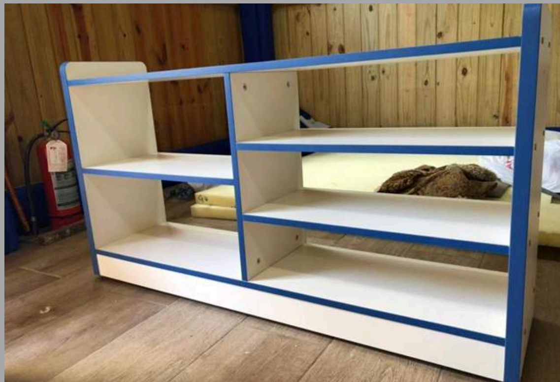
YCW-G0336 ESTANTE 120*30*65 CM RD$ 14,250.00 (IMPUESTOS INCLUIDOS)