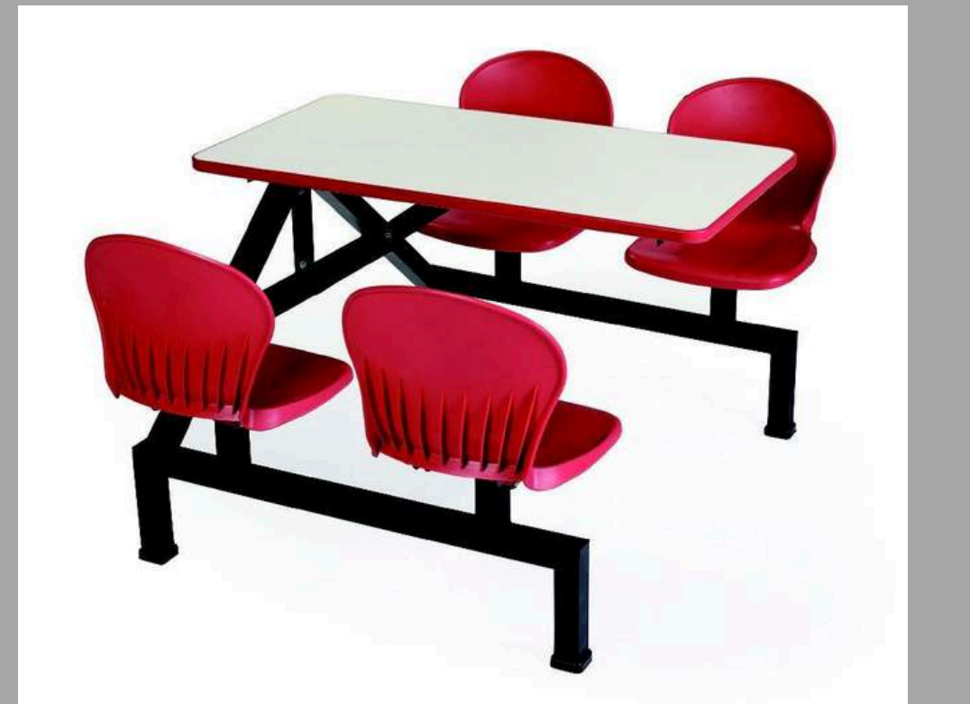
YCY-066 MESA PARA CAFETERIA DE INTERIOR 115*161*77 CM RD$ 22,800.00 (IMPUESTOS INCLUIDOS)