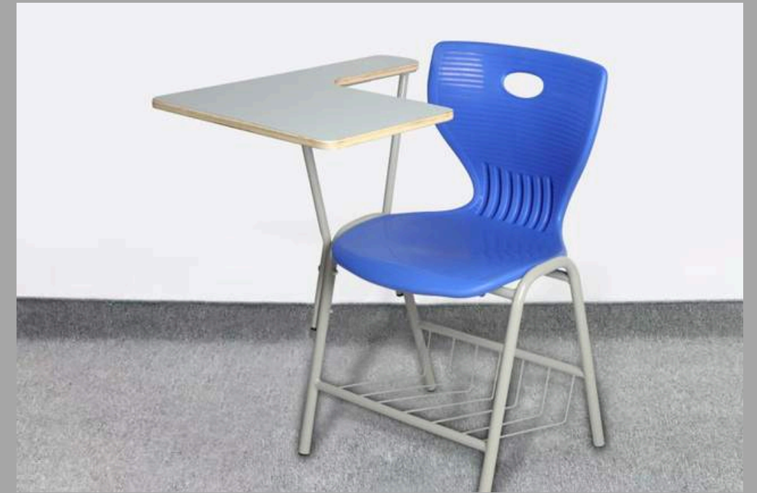
C-002-03 PUPITRE MISTRAL(1ero a 6TO SECUNDARIA) Asiento: 45 CM RD$ 4,500.00