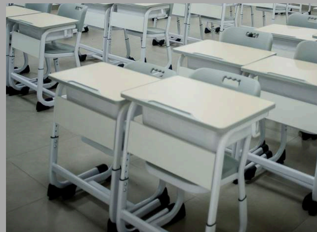
K-5 SET DE ESCRITORIO (2DO PRIMARIA A 4TO PRIMARIA) 60*45*66-76 CM RD$ 7,000.00