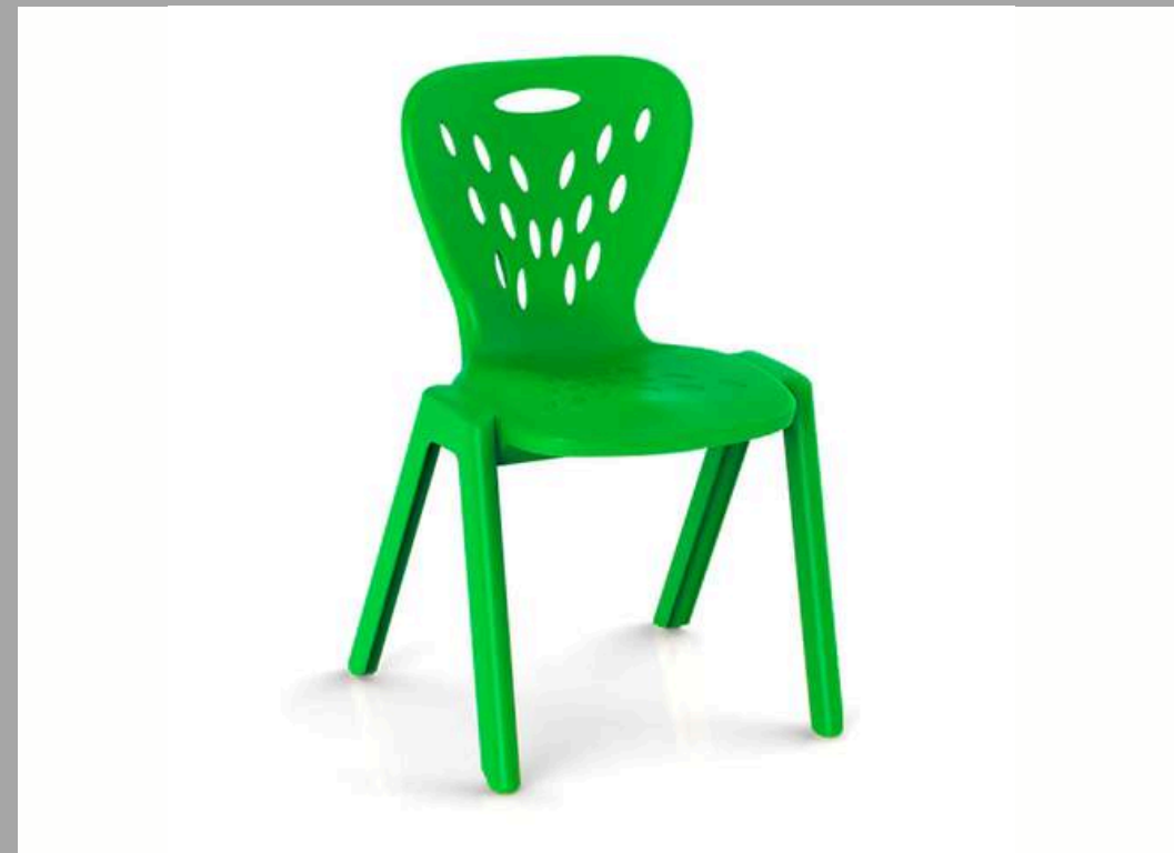
YCX-305 SILLA DE LUJO 72*48*40CM RD$ 2,280.00 (15 UNIDADES DISPONIBLES)