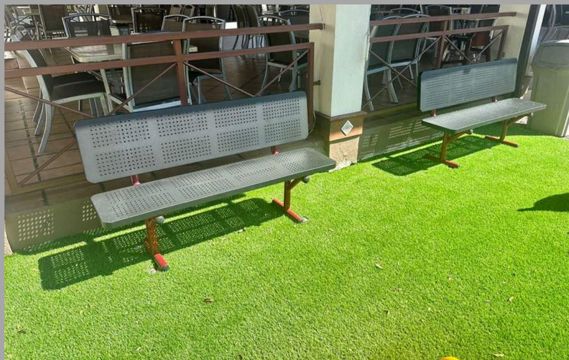
FY-17502 BANCO DE METAL 150*65*86CM RD$ 21,945.00 (IMPUESTOS INCLUIDOS)