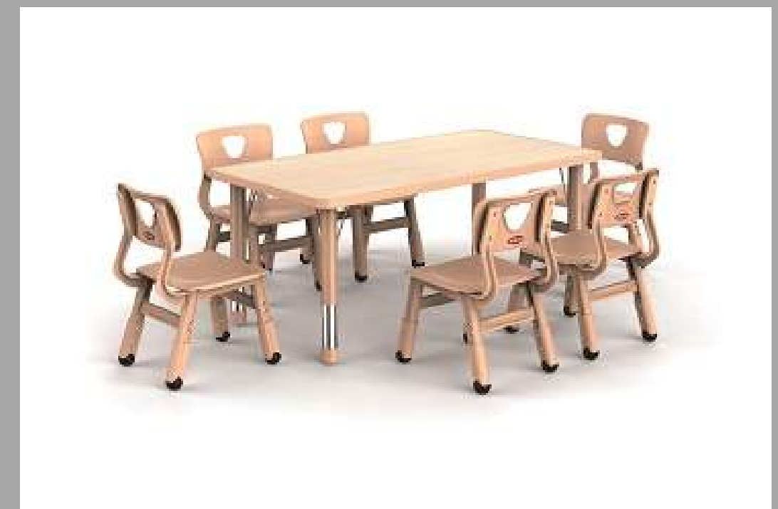
AM-0324 SET MESA RECTANGULAR CON 6 SILLAS 115*60*H40-60cm // 30*30*H51/53/55cm RD$ 21,375.00