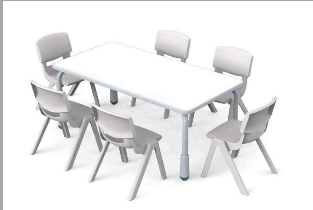
YCY-081 SET MESA RECTANGULAR CON 6 SILLAS Size: 115*60cm / Height: 48cm-57cm P/NIÑOS HASTA 6 AÑOS RD$ 15,800.00