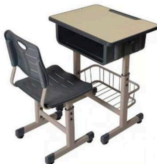
K-1-2 SET DE ESCRITORIO HOSTOS (1ERO DE SECUNDARIA EN ADELANTE) 60*45*70-79 CM RD$ 8,500.00