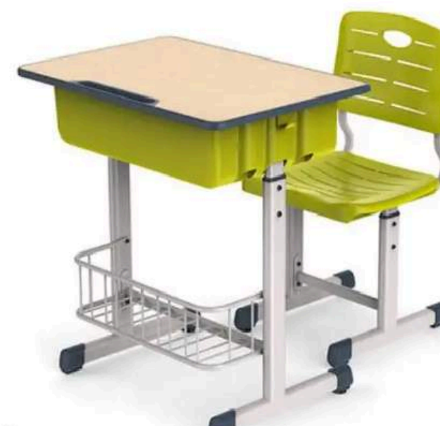
K-1-2 SET DE ESCRITORIO HOSTOS (1ERO DE SECUNDARIA EN ADELANTE) 60*45*70-79 CM RD$ 8,500.00