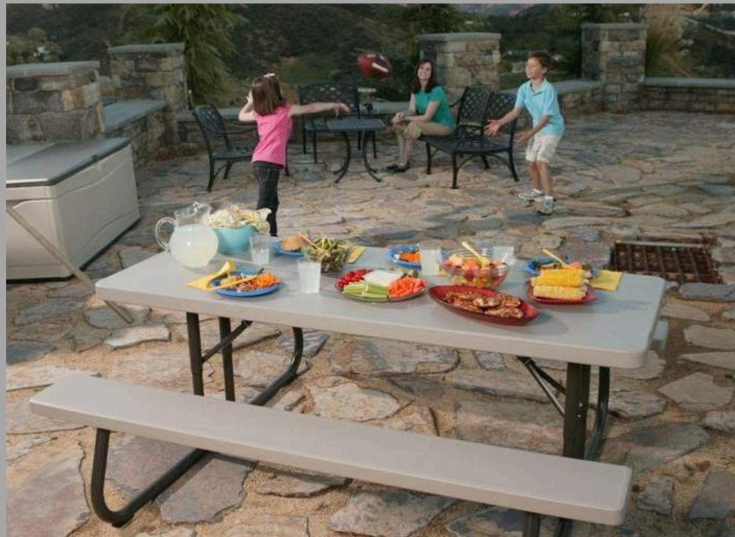
AL-03C BANCO PARA ADULTOS RD$ 21,090.00 (IMPUESTOS INCLUIDOS)