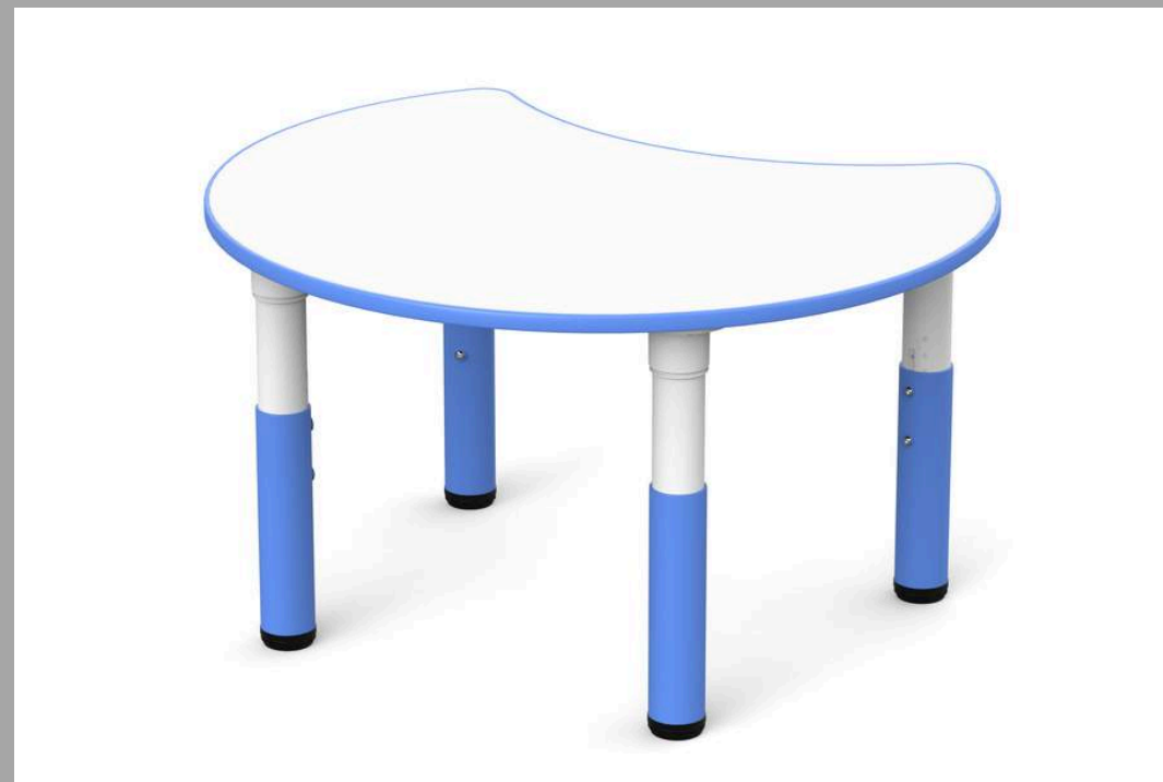
YCY-093 MESA MEDIA LUNA 90*75*40-60 CM RD$ 6,840.00