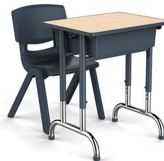
YCY-048 SET DE ESCRITORIO MILES (1ERO DE SECUNDARIA EN ADELANTE) 60*45*70-79CM RD$ 9,000.00