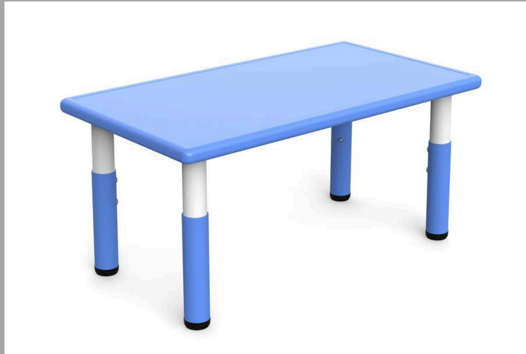
YCY-010 MESA RECTANGULAR 100*55*H48-60cm RD$ 6,840.00