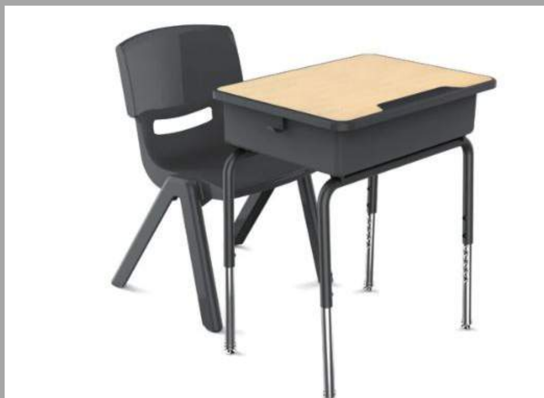
YCY-058 SET DE ESCRITORIO (4TO PRIMARIA EN ADELANTE) 60*45*62.5-75 CM RD$ 7,500.00