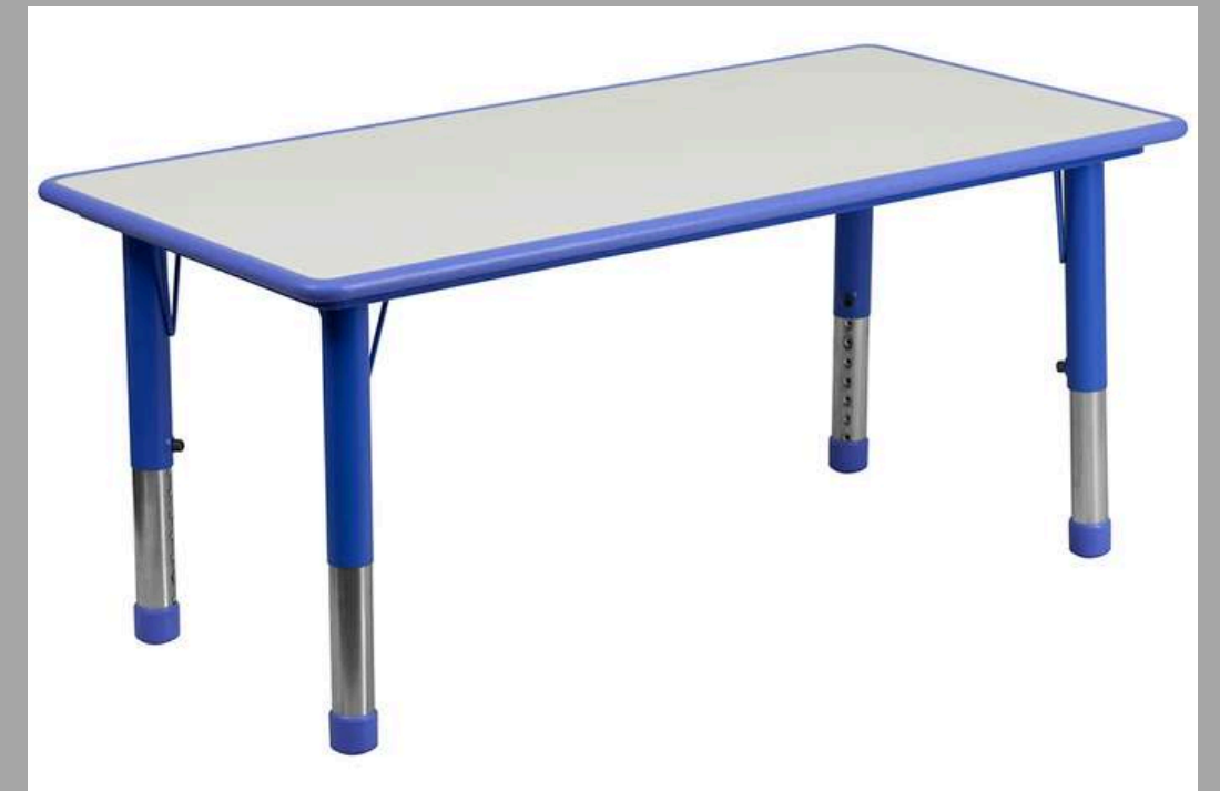
YCY-060 MESA RECTANGULAR 120*60*H40-60cm RD$ 7,500.00