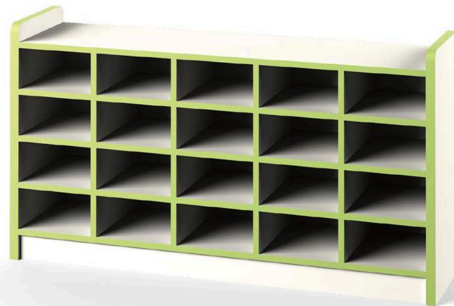
YCW-G0337 ESTANTE 120*30*65 CM (color azul) RD$ 14,250.00 (IMPUESTOS INCLUIDOS)