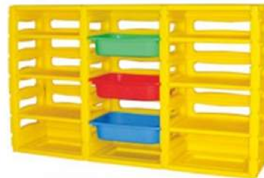
PT-34 ESTANTE PLASTICO 3 DIVISIONES (INCLUYE GAVETAS) RD$ 19,950.00 (IMPUESTOS INCLUIDOS)