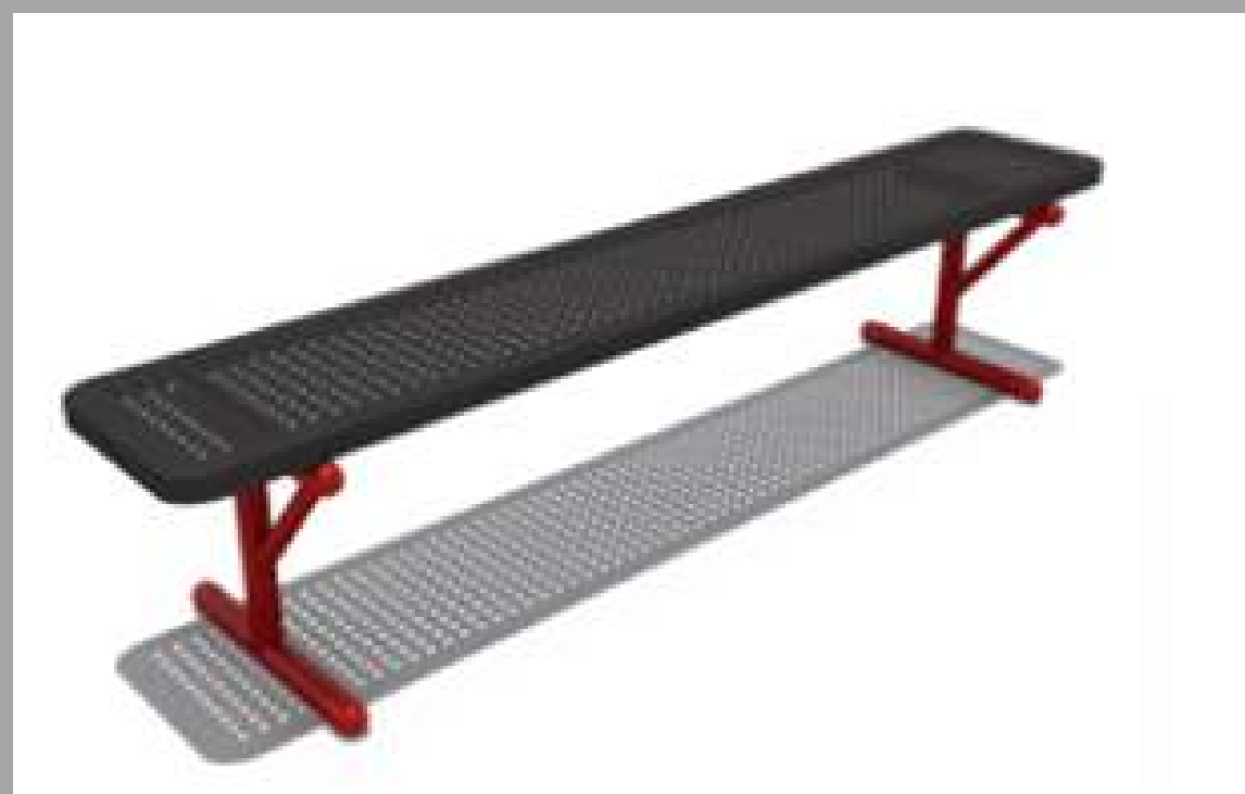
FY-17501 BANCO DE METAL 150*40*45 CM RD$ 15,675.00 (IMPUESTOS INCLUIDOS)