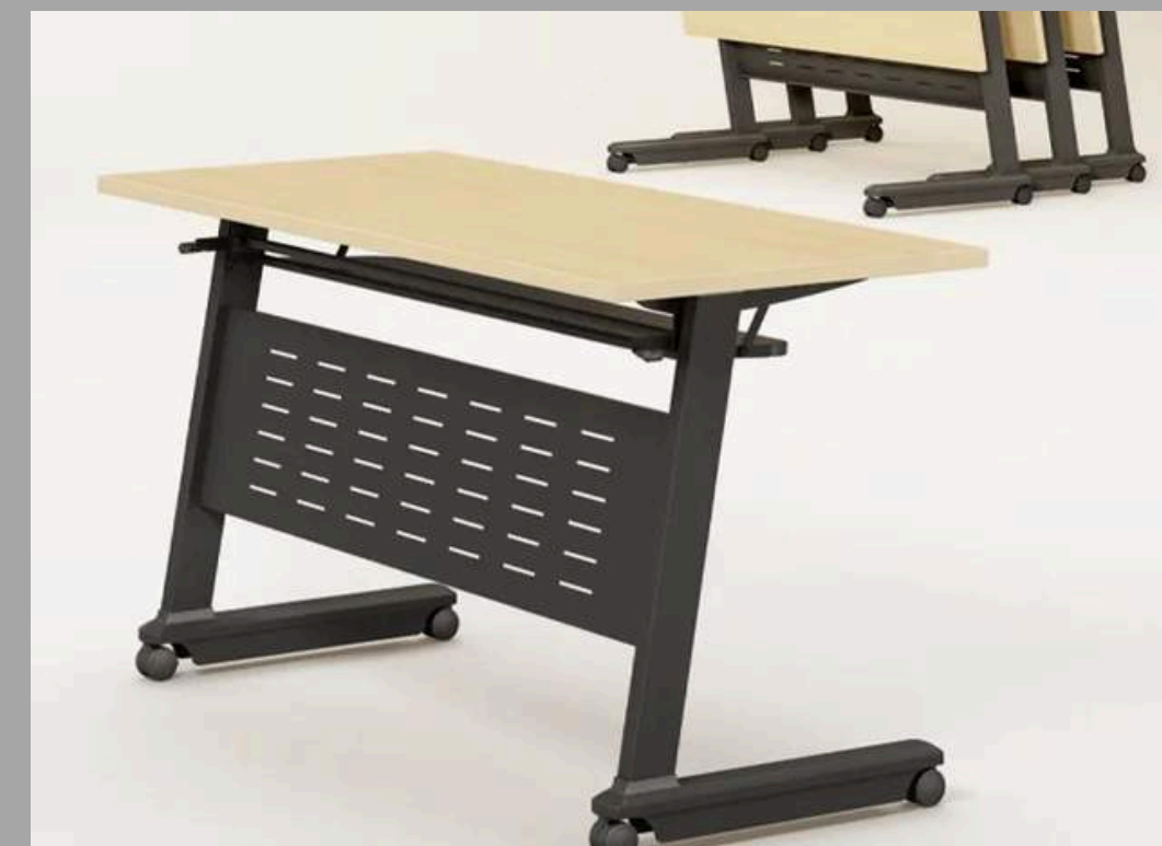
PZ-001 MESA APILABLE 125*45*15 CM RD$ 9,405.00