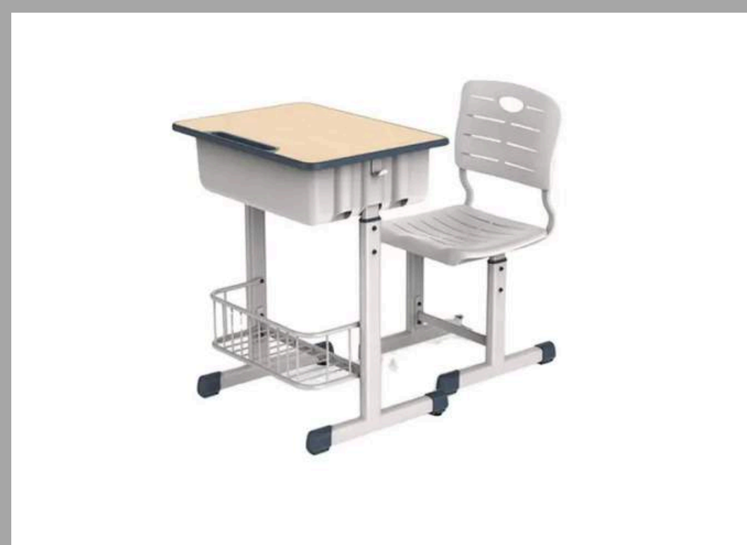
K-1-2 SET DE ESCRITORIO HOSTOS (1ERO DE SECUNDARIA EN ADELANTE) 60*45*70-79 CM RD$ 8,500.00