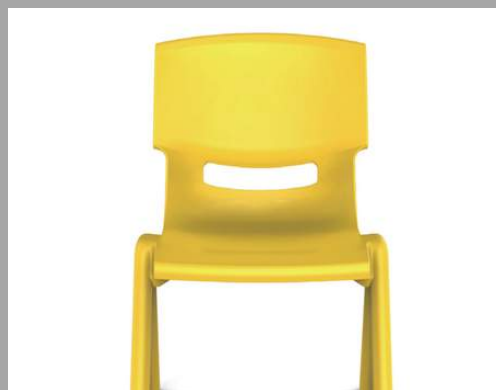
YCX-002 / YCX-004 / YCX-005 SILLAS PLASTICAS 3ASIENTO 28 CM / ASIENTO 34 CM / ASIENTO 45 CM RD$ 885 / RD$ 1,200 / RD$ 2,850