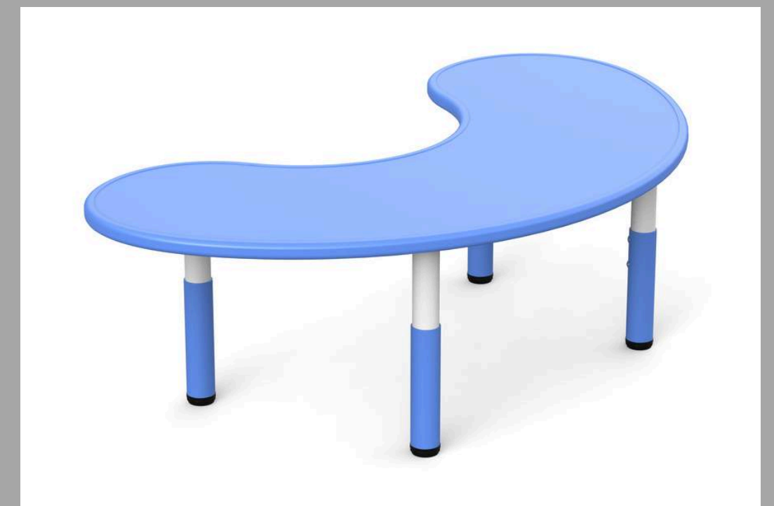
YCY-005 MESA RIÑON 165*90*H40-60cm RD$ 10,545.00