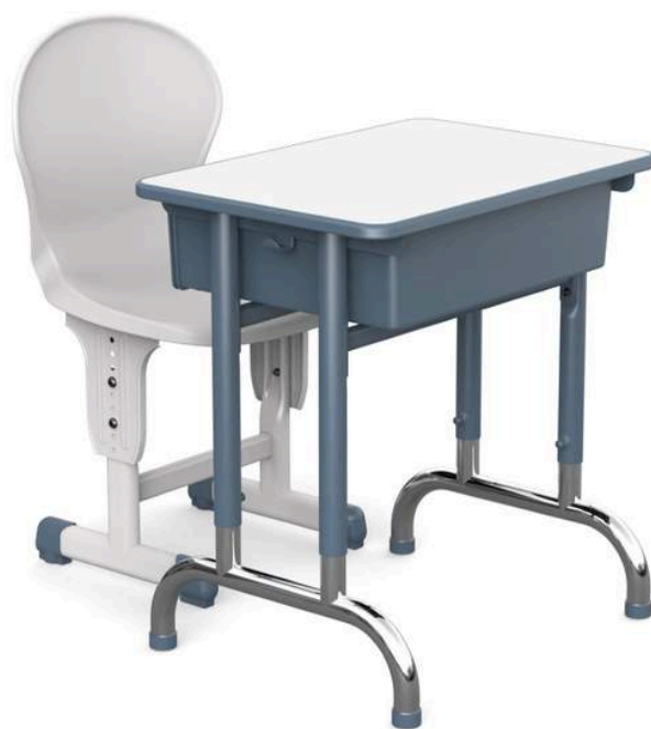
YCY-094A SET DE ESCRITORIO RIGEL (1ERO DE SECUNDARIA EN ADELANTE) 60*45*70-79CM RD$ 9,500.00