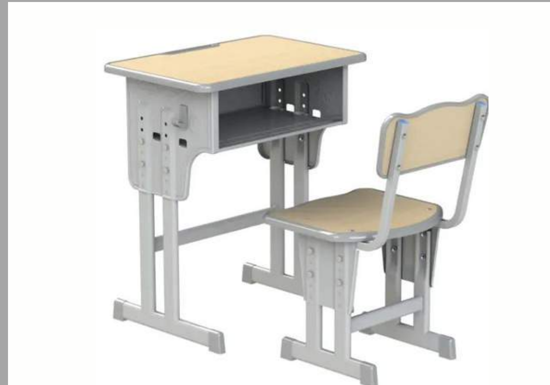
TT1821-SET DE ESCRITORIO CLARK (2DO PRIMARIA-2DO SECUNDARIA) 60*40*61*76 CM RD$ 4,845.00