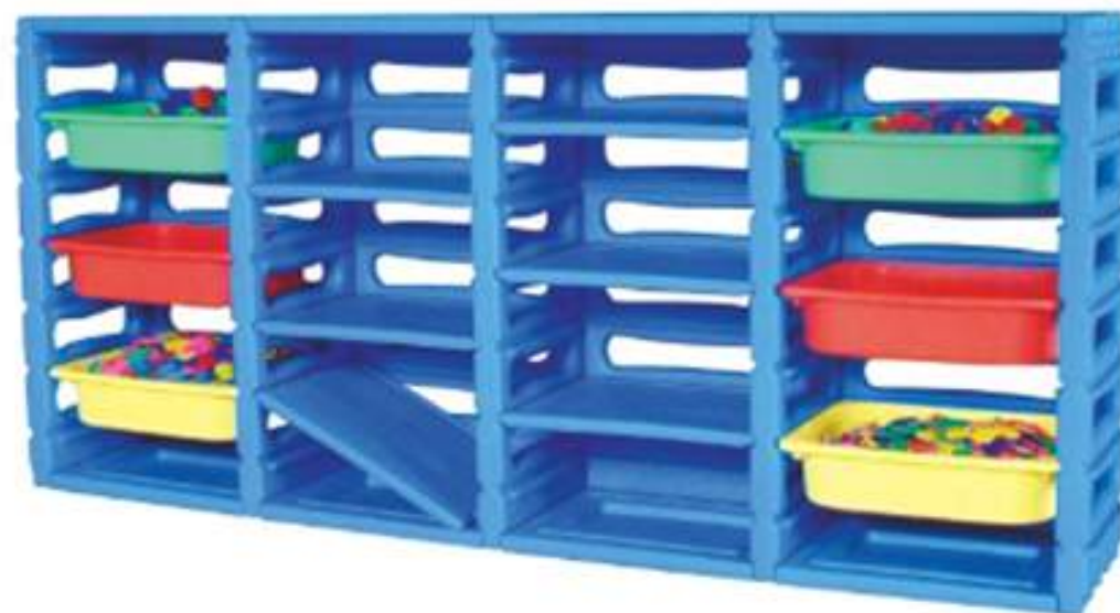
KL276-A ESTANTE PLASTICOS 4 DIVISIONES (INCLUYE GAVETAS) RD$27,075.00 (IMPUESTOS INCLUIDOS)