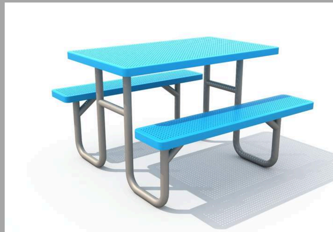
FY-17603-2 BANCO MERENDERO PARA NIÑOS 90*82.5*53.5 CM RD$ 27,075.00 (IMPUESTOS INCLUIDOS)