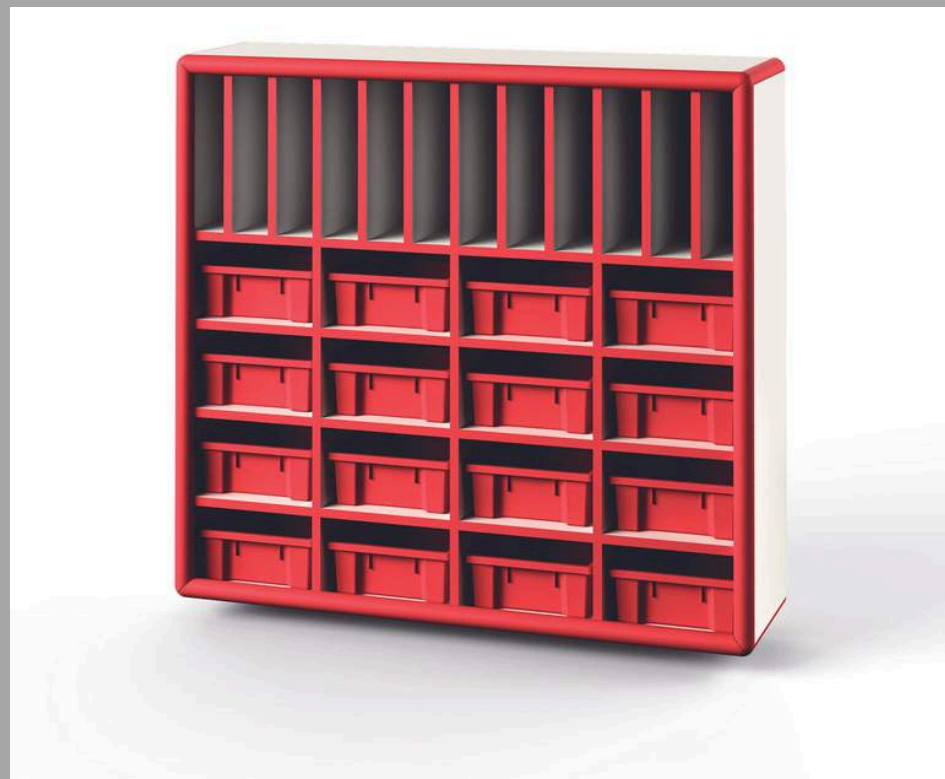
YCW-G0301 ESTANTE CON 5 GAVETAS 120*30*110 CM (azul y rojo) RD$ 25,650.00