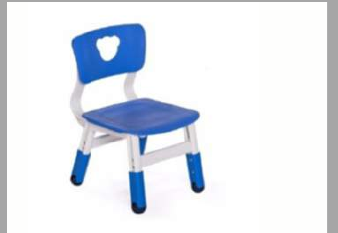
CN-036-A SILLAS AJUSTABLES PARA NIÑOS HASTA 5 AÑOS 30*30*H51/53/55cm H26/28/30cm RD$ 1,800.00