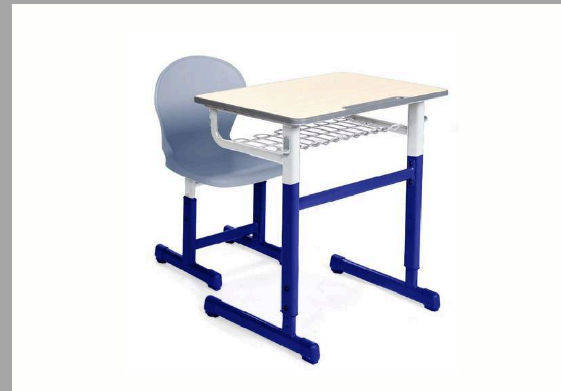
K-17 SET DE ESCRITORIO NIZA (4TO DE PRIMARIA HASTA SECUNDARIA) 60*45*67-79 CM RD$ 8,395.00