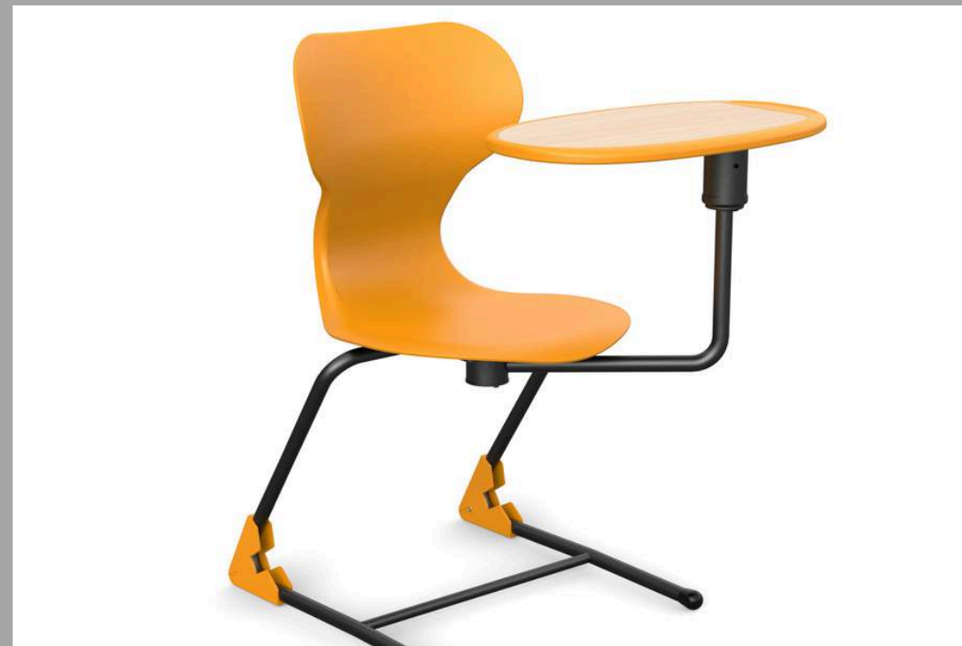
YCX-09026 PUPITRE LUGO (SECUNDARIA-UNIVERSITARIO) 70*65*83 CM Altura Asiento: 46 CM RD$ 3,420.00 (12 UNIDADES DISPONIBLES)