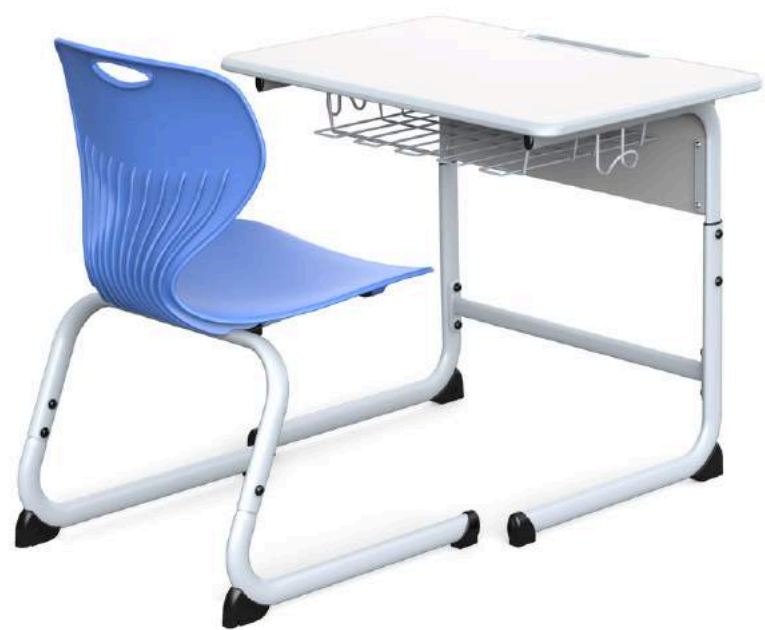
YCY-138 SET DE ESCRITORIO HUNTER PARA 1ERO DE SECUNDARIA EN ADELANTE. 70*50*64-79 / 81*48*44 CM RD$ 11,700.00