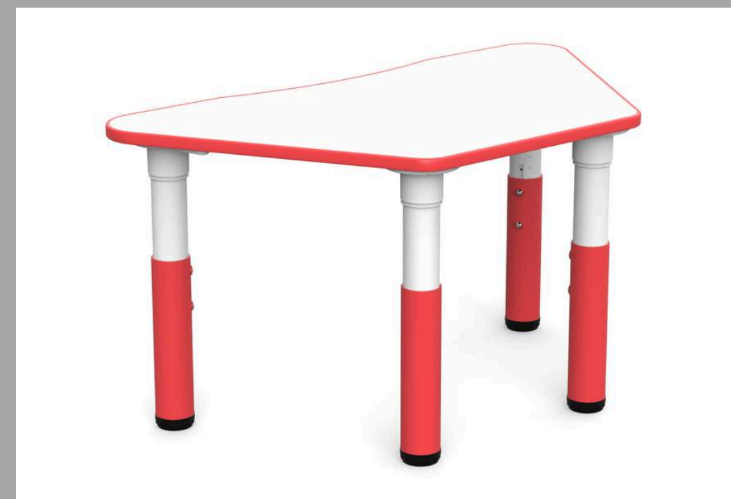
YCY-091 MESA TRAPECIO 95x53*40-60 CM RD$ 5,985.00