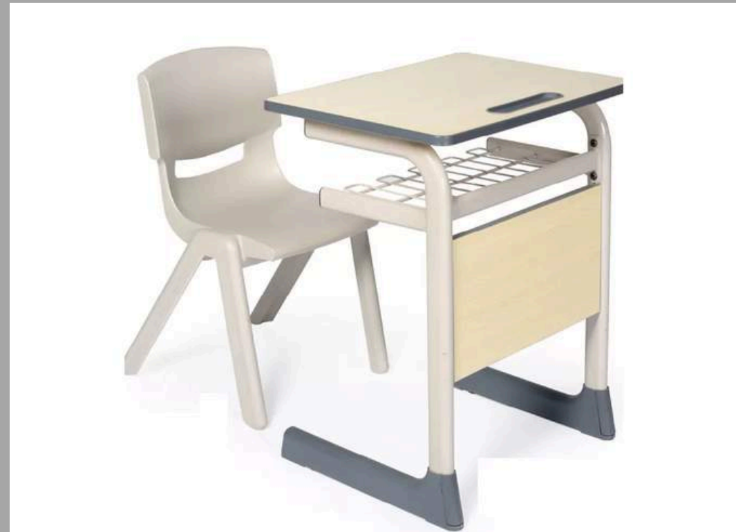
YCY-033 SET DE ESCRITORIO (2DO PRIMARIA A 4TO PRIMARIA) 60*45*73 CM RD$ 7,000.00