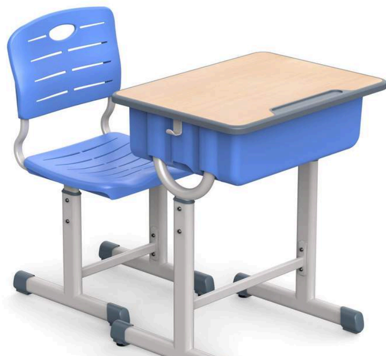
YCY-048 SET DE ESCRITORIO HOSTOS (1ERO DE SECUNDARIA EN ADELANTE) 60*45*70-79CM RD$ 8,500.00