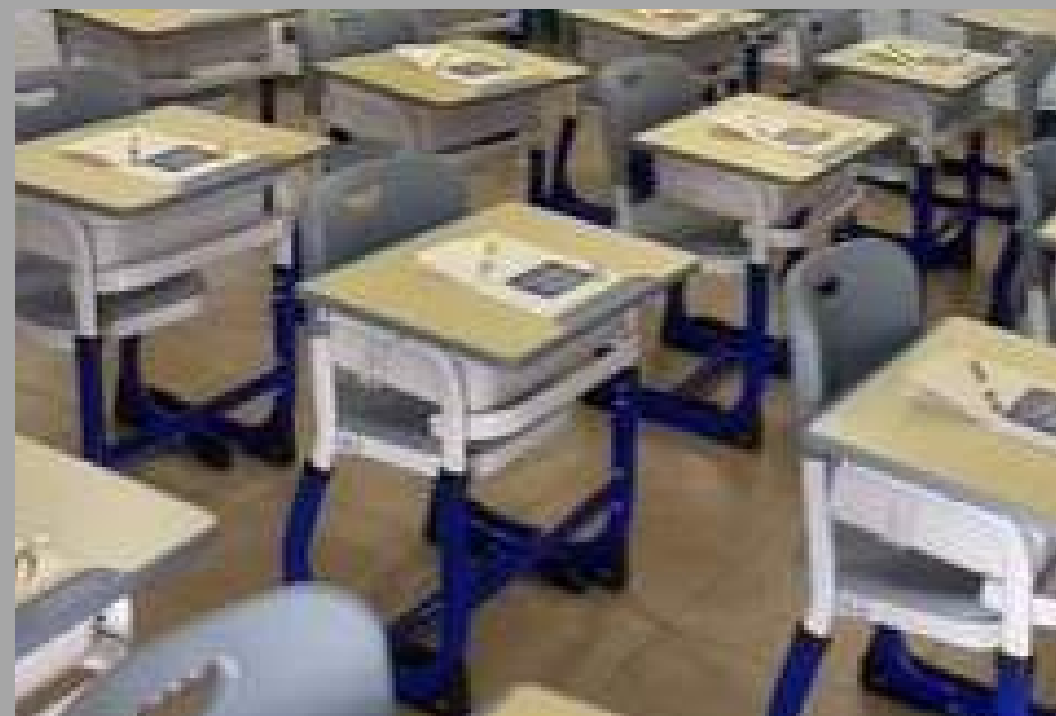
K-5 SET DE ESCRITORIO FABIO (2DO PRIMARIA A 4TO PRIMARIA) 60*45*66-76 CM RD$ 7,000.00