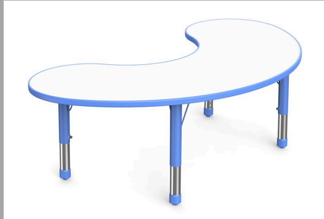
YCY-070 MESA RIÑON 154*84*H40-60cm RD$ 12,825.00