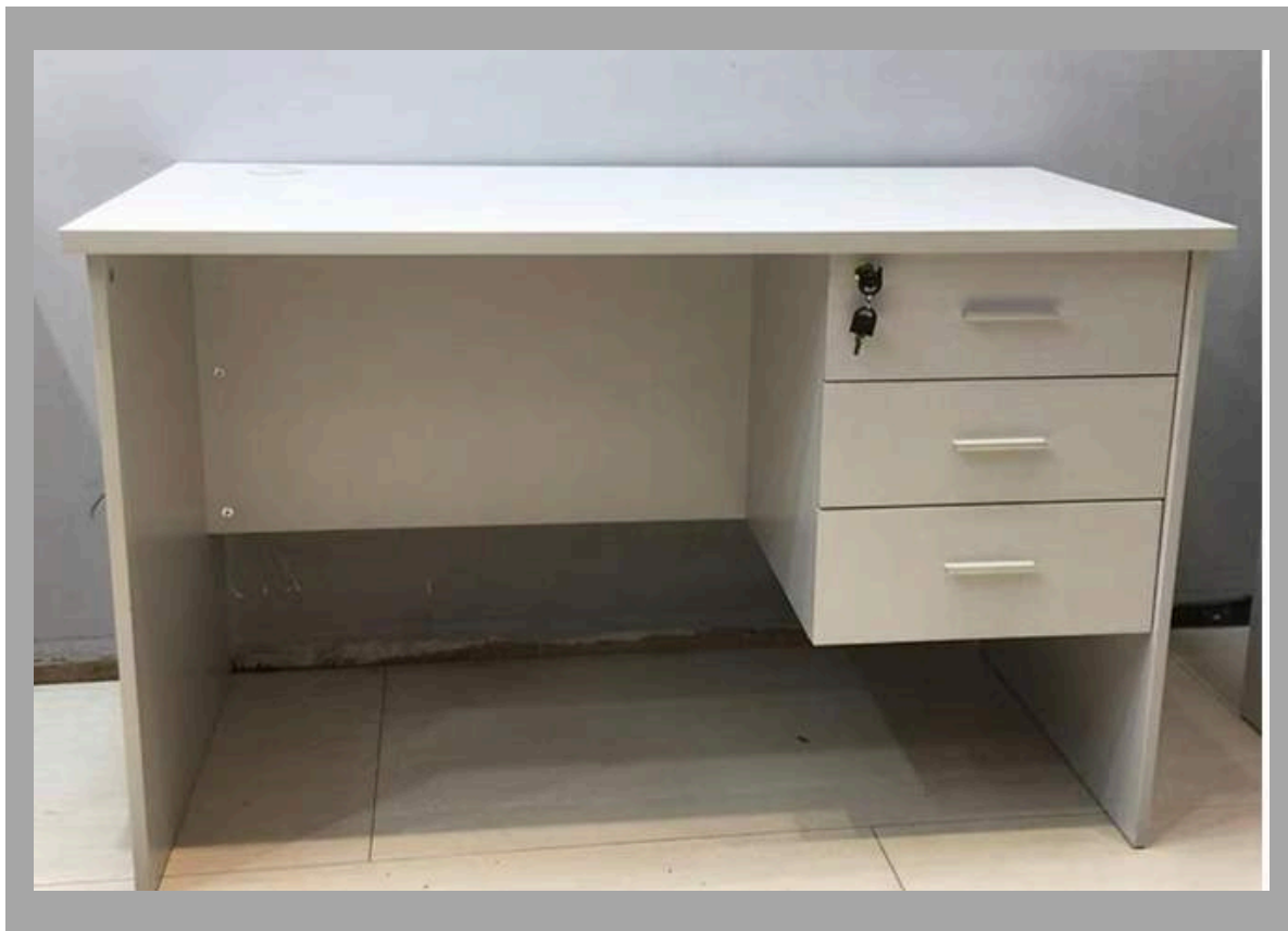
ILC-024 ESCRITORIO P/PROFES 120*40*75 CM RD$ 9,500.00 (IMPUESTOS INCLUIDOS)