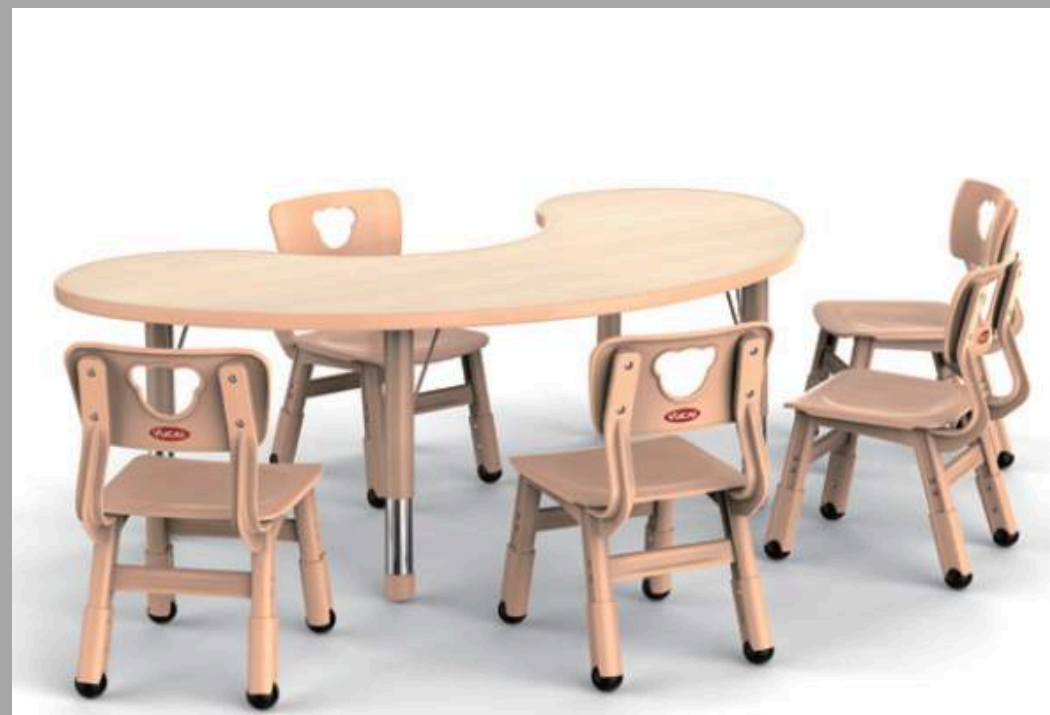
AM-0323 SET MEDIA LUNA CON 6 SILLAS 154*84*H40-60cm // 30*30*H51/53/55cm RD$ 26,220.00