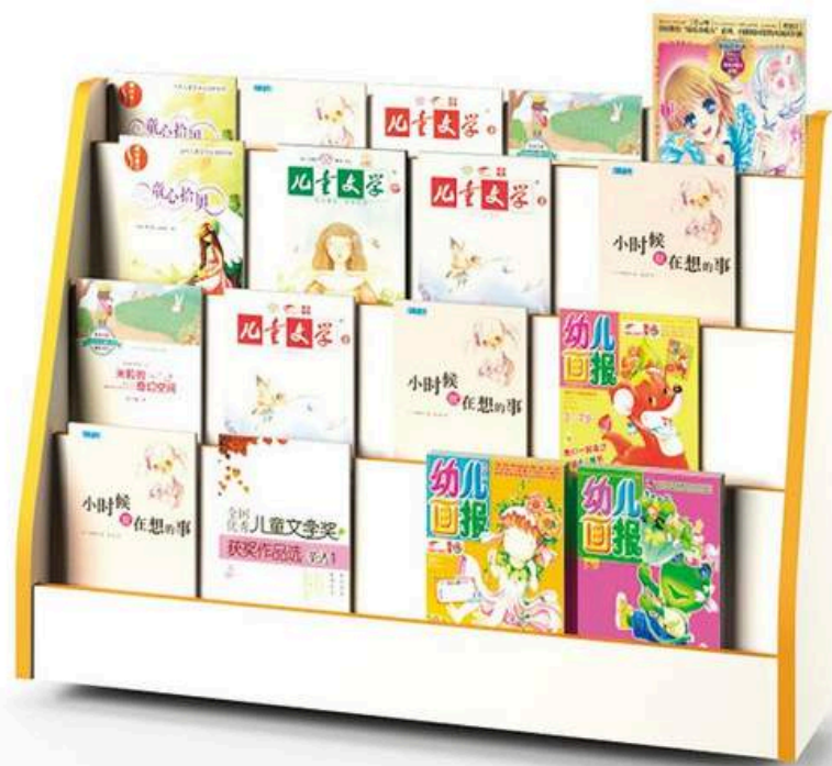
YCW-G0311 REVISTERO 120*30*65 CM (azul,verde) RD$ 12,825.00 (IMPUESTOS INCLUIDOS)