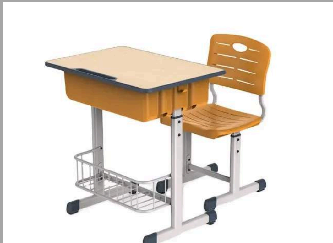
K-1-2 SET DE ESCRITORIO HOSTOS (1ERO DE SECUNDARIA EN ADELANTE) 60*45*70-79 CM RD$ 8,500.00