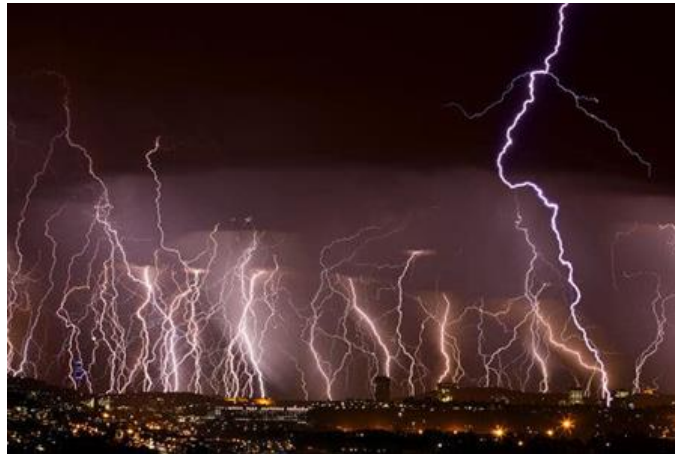
Mchoro namba 2. Mfano wa radi ya mawingu kwenda ardhini.