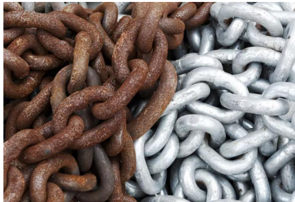
Mchoro wa 3. Mfano wa mabadiliko ya kikemikali kwa jinsi minyororo ya chuma inapata kutu kadiri ya muda unavyosonga. Minyororo iliyo upande wa kushoto imeshika kutu. Minyororo ya kulia haina kutu kwa sababu ina mipako maalum ambayo

Wakati nyama ya tufaha inapogeuka kahawia, inapata mabadiliko ya kikemikali. Tazama mfano wa mabadiliko haya ya kikemikali kwenye Mchoro wa 2. Uwekaji kahawia wa tufaha hauwezi kubatilishwa. Mfano mwingine wa mabadiliko ya kikemikali ni kutu, ambayo hutokea wakati metali fulani, kama chuma, huachwa nje na kuathiriwa na hewa na maji kwa muda. Tazama mfano wa minyororo yenye kutu kwenye Mchoro wa 3. Kama vile tufaha inavyotia rangi kahawia, kutu haiwezi kutenguliwa.