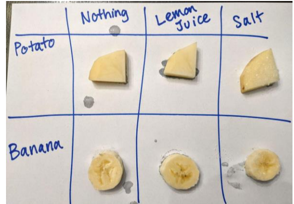
Mchoro wa 4. Mfano wa mazao yaliyokatwa na vihifadhi tofauti vilivyooonekana. Jedwali husaidia kupanga mazao na vihifadhi.

Mwanafunzi wa 2: Mwanafunzi mmoja atawajibika kuongeza vihifadhi kwenye mazao. Mwanafunzi huyu hatafanya chochote kwa kipande cha kwanza cha chakula katika kila safu. Kisha mwanafunzi huyu atakamua matone machache ya maji ya limao kwenye kipande cha pili katika kila safu ili uso mzima wa kipande hicho uwe na maji ya limao juu yake. Hatimaye, mwanafunzi huyu atanyunyiza chumvi kwenye kipande cha tatu katika kila safu ili uso mzima uwe na safu nyembamba ya chumvi juu yake. Tazama picha kwenye Mchoro wa 4 kwa mpangilio wa jumla.