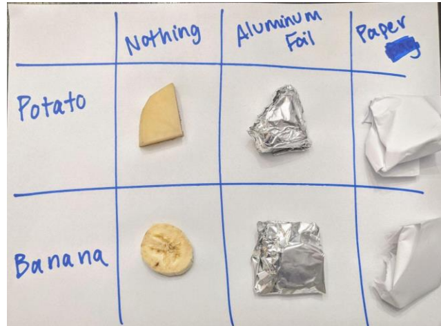
Mchoro wa 5. Mfano wa bidhaa zilizokatwa na vifungashio tofauti. Jedwali husaidia kupanga bidhaa na ufungaji.

Mwanafunzi wa 3: Mwanafunzi mmoja atawajibika kufunga mazao. Mwanafunzi huyu hatafanya chochote kwa kipande cha kwanza cha chakula katika kila safu. Mwanafunzi huyu kisha atafunga kipande cha pili cha mazao vizuri kwa karatasi ya aluminiamu. Hatimaye, mwanafunzi huyu atafunga kipande cha tatu cha mazao kwa karatasi. Tazama picha kwenye Mchoro 5 kwa mpangilio wa jumla.