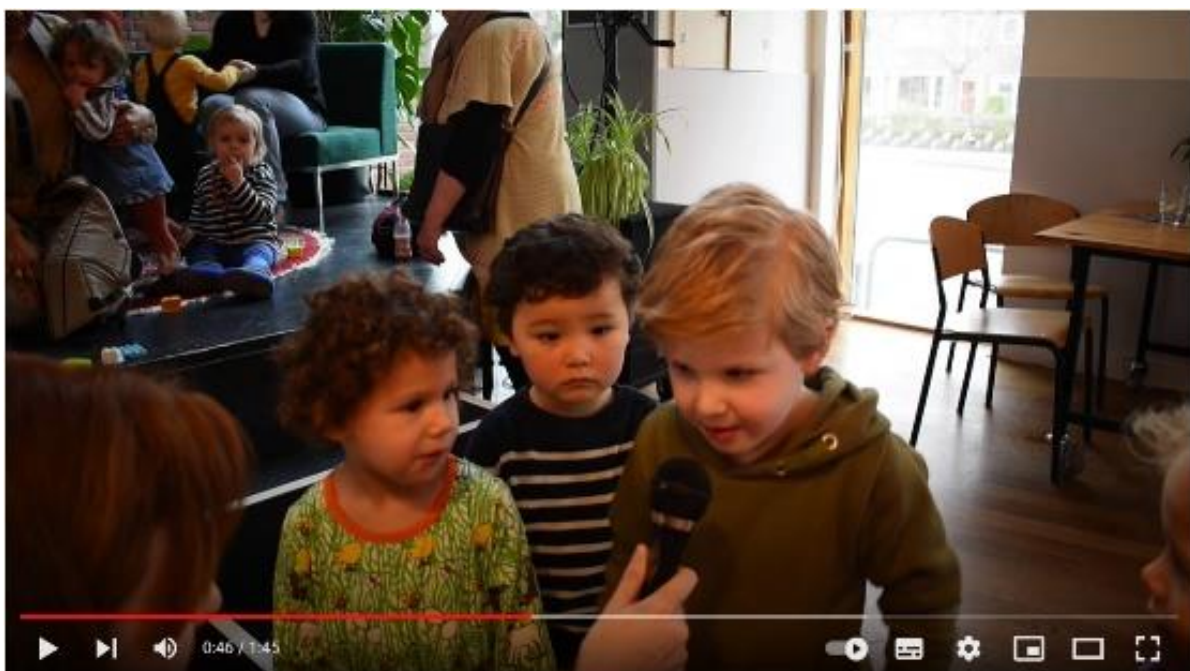
Podium Sprits - STIP IT terugblik

Deze voorstelling stond eigenlijk in seizoen 21-22 maar werd toen vanwege corona bij een van de spelers doorgeschoven. In het voorjaar van 22 liep de kaartverkoop voor deze voorstelling ontzettend moeizaam, in het voorjaar van 23 was de voorstelling uitverkocht! We vroegen ons publiek wat zij van de voorstelling vonden: https://www.youtube.com/watch?v=P8X6P95awN4