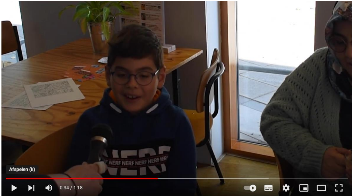
Podium Sprits - 'Onder de grond' publieksreacties