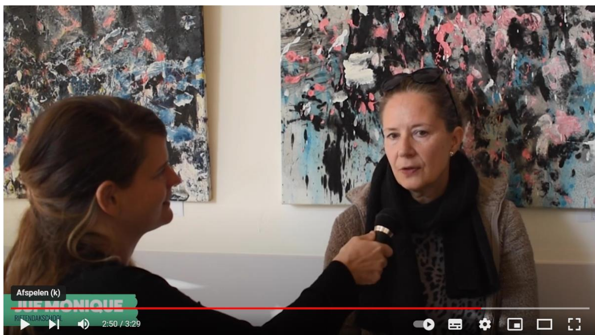
Podium Sprits - Kinderboekenweek met voorstelling 'Muk'

We maakten dit videoverslag, waarin het gezelschap, de kinderen en een van de leerkrachten geïnterviewd wordt: https://youtu.be/i5-4nVtiNpl