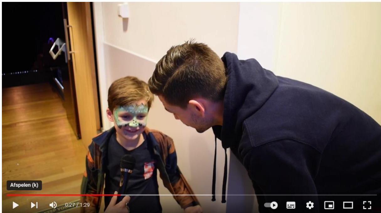
Podium Sprints - 'BullyBully' publieksreacties

We vroegen het publiek wat zij er van vonden: https://youtu.be/vF6BCc0Ytmg