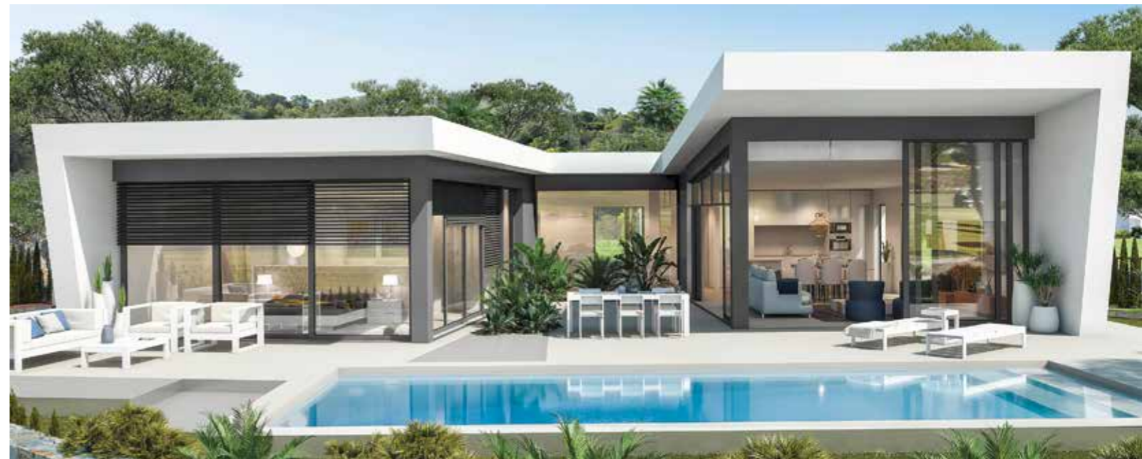
Esta infografía es un boceto preliminar creado por ordenador con fines meramente ilustrativos y no vinculantes. El diseño final puede estar sujeto a modificaciones.

La oferta residencial en venta en Las Colinas Golf & Country Club incluye villas y apartamentos.