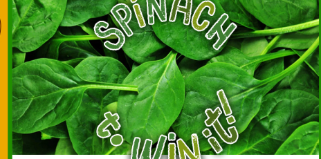
GEORGIA ORGANICS OCTOBER FARM TO SCHOOL MONTH