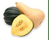
Calabazas y otras de sus variedades