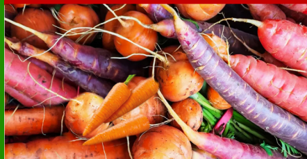
Vegetales de raíz Zanahoria, Remolacha, Rábanos

Semana Nacional del CACFP: del 12 al 18 de Marzo