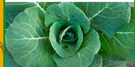
Vegetales Verdes Col, Mostaza, Nabos