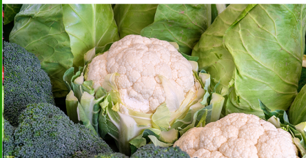
Verduras Repollo, Brócoli, Coliflor