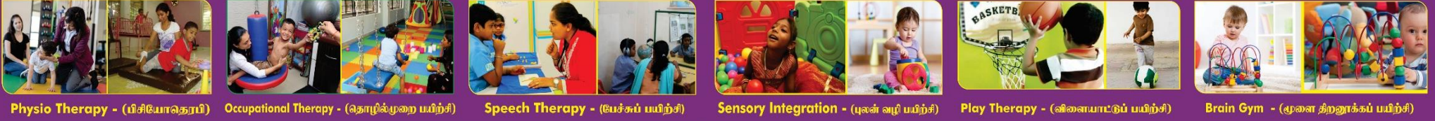
Physio Therapy - (பிஸியோதெரப்பி) Occupational Therapy - (தொழில்முறை பயிற்சி) Speech Therapy - (பேச்சுப் பயிற்சி) Sensory Integration - (புலன் வழி பயிற்சி) Play Therapy - (விளையாட்டுப் பயிற்சி) Brain Gym - (மூளை திறனுக்கப் பயிற்சி)