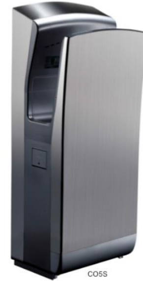
Secador de Manos Acero Inox. Óptico Satinado