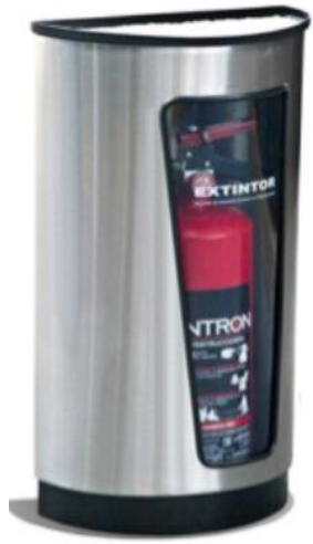
4080 / 4081