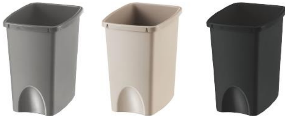
PAPELERA VAIVEN 10 LITROS