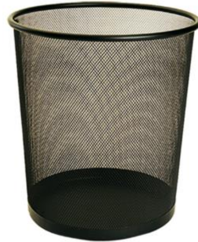
CESTO REDONDO DE MALLA SABLON