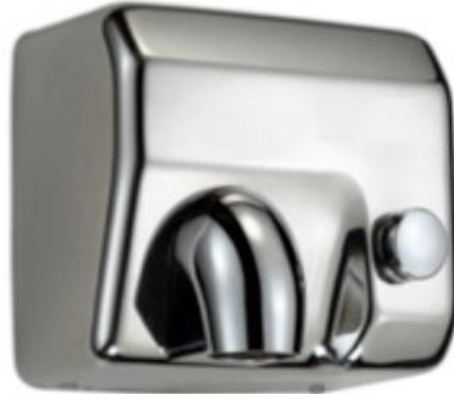
Secador de Manos Acero Inox. Pulsador