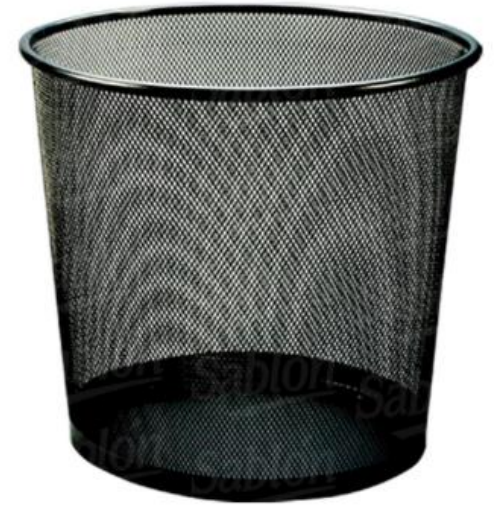
CESTO OVALADO DE MALLA SABLON