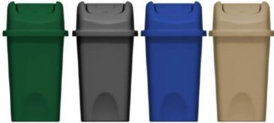
PAPELERA VAIVEN CON TAPA CURVA 10 LITROS