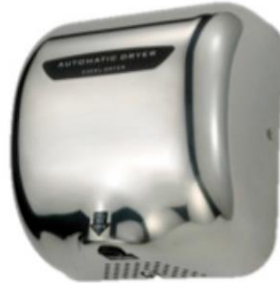
Secador de Manos Acero Inox. Óptico Pulido