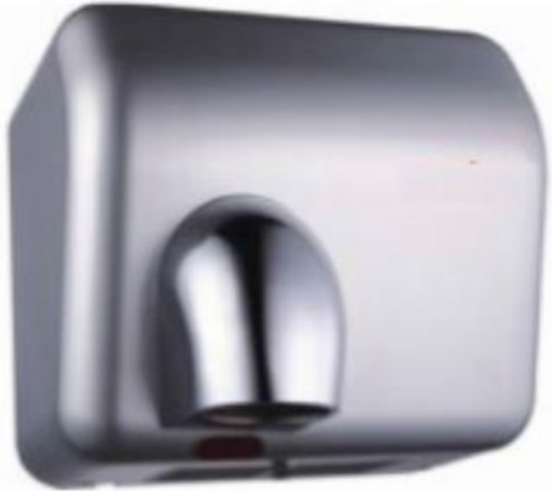
Secador de Manos Óptico Gris