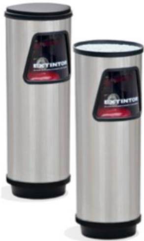
4010 / 4012