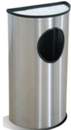
3040 / 3041