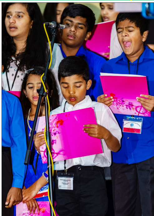
"No, I am not yawning; I am trying for my best effort".