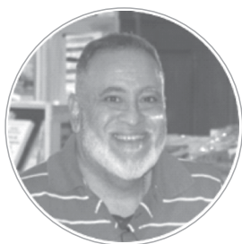
Jorge Vladimir Alacevich Escritor argentino

El pasado 4 de enero se celebró el «Día Mundial del Braille» con el fin de crear mayor conciencia sobre su importancia como medio de comunicación para la plena realización de los derechos humanos para las personas ciegas y con deficiencia visual.