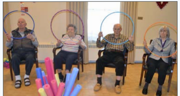
Residents of IFH-RY during physical fitness and games.

Three days per week, on Monday, Wednesday and Thursday, seniors from the Ivan Franko Home's neighbourhood in Mississauga have an opportunity to join our residents during exercise classes offered by Bayshore Therapy and Rehab senior wellness agency. Our neighbours have a positive impact on the residents – the number of exercise class participants continuously increases, so that their health improves!