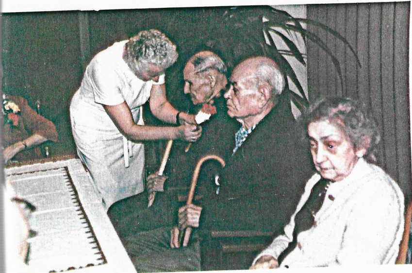
ФРАГМЕНТИ З ВІДЗНАЧЕННЯ УРОДИН МЕШКАНЦІВ ПАНСІОНУ ІМ. ІВАНА ФРАНКА ПРИ РОЯЛ ЙОРК РОВД