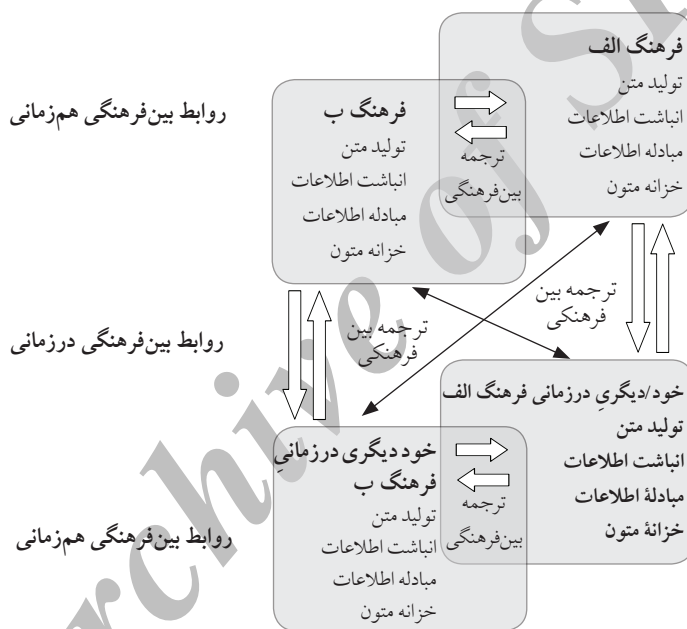
نمودار ۳. روابط بین فرهنگی در زمانی و هم‌زمانی

(خود و نه دیگری) به گفتمان مسلط فرهنگی شکل می‌دهد، فرهنگ بیشتر امری آرمانی متعلق به گذشته (در ایران برای مثال، صفویه یا هخامنشیان) تعریف شده و مطالعات فرهنگ بیشتر مطالعات تاریخ فرهنگ بوده است. در اینجا نیز گفتمان فرهنگی مسلط از طریق نوعی ترجمه بین فرهنگی (بین آن خود/دیگری تاریخی و خود/اکنونی) و از طریق فرایندهای جذب و طرد، آن خود/دیگری تاریخی را به قلمروی آرمانی تبدیل می‌کند. از آنجا که دیگری هم‌زمانی نیز خود را در عین حال، از سویه تاریخی و در زمانی اش متمایز می‌کند و از طریق آن نیز به خود معنا می‌بخشد. با وارد کردن بعد زمان می‌توان نمودار روابط بین فرهنگی را به شکل زیر به سرانجام رساند.