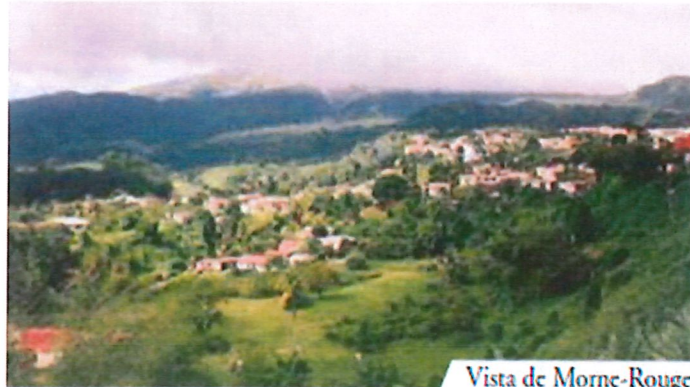
Vista de Morne-Rouge

E l 8 de mayo de 1902, fiesta de la Ascensión, el volcán de la montaña Pelée comenzó a erupcionar arrojando lava y cenizas. La población de Morne-Rouge, muy devota al Sagrado Corazón de Jesús, se volcó inmediatamente a la iglesia parroquial para implorar a Nuestra Señora de la Déliverance la salvación del pueblo ante la catástrofe inminente.