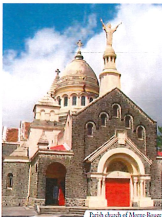
Parish church of Morne-Rouge

1662 Marriage is based on the consent of the contracting parties, that is, on their will to give themselves, each to the other, mutually and definitively, in order to live a covenant of faithful and fruitful love.