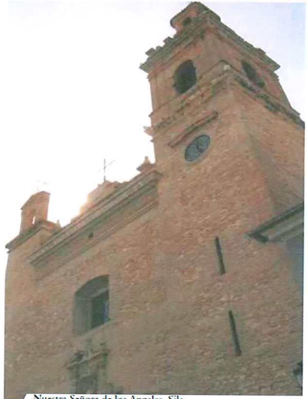
Nuestra Señora de los Angeles. Silla