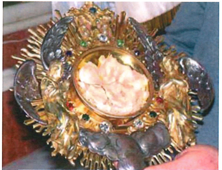
Hosts of the Miracle