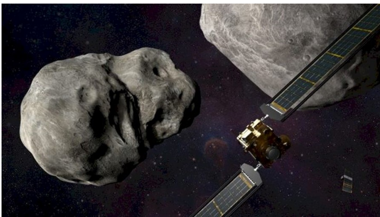
L'impact entre le satellite DART et l'astéroïde sera observé depuis l'espace et depuis la Terre.

Pour écouter une entrevue avec Julie Bellerose, sur Ohdio : https://ici.radio-canada.ca/ohdio/premiere/emissions/les-annees-lumiere/segments/entrevue/381944/julie-bellerose-pilote-satellite-dart-asteroide-impact