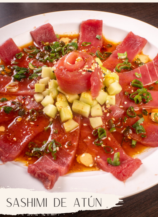
SASHIMI DE ATÚN