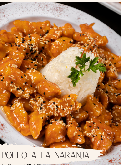
POLLO A LA NARANJA