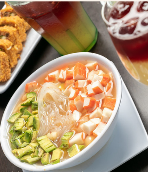
SOPA DE MARISCOS