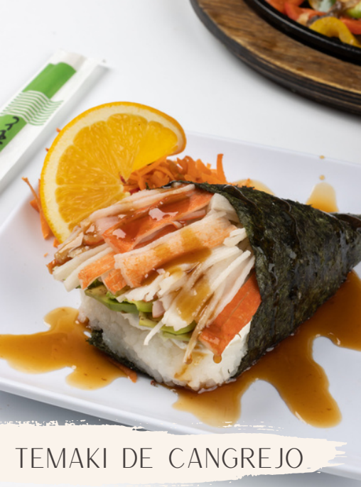
TEMAKI DE CANGREJO