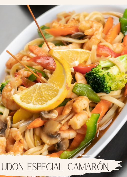
UDON ESPECIAL CAMARÓN