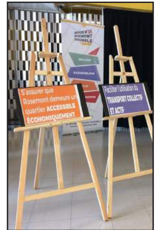
LA JOURNÉE UNIS POUR LE MIEUX-ÊTRE DES AINÉ(E)S FORUM SOCIAL DE ROSEMONT