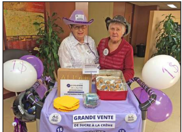
LE CYCLOTHON DE L'ALPAR JOANNE-SOUCY