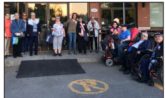
LA SORTIE AU VIEUX-DULUTH