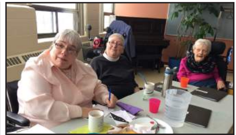
L'ASSEMBLÉE GÉNÉRALE ANNUELLE