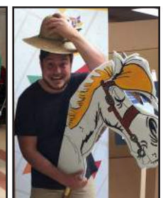
ET TOUTES CES ACTIVITÉS RÉGULIÈRES QUI NOUS RASSEMBLENT