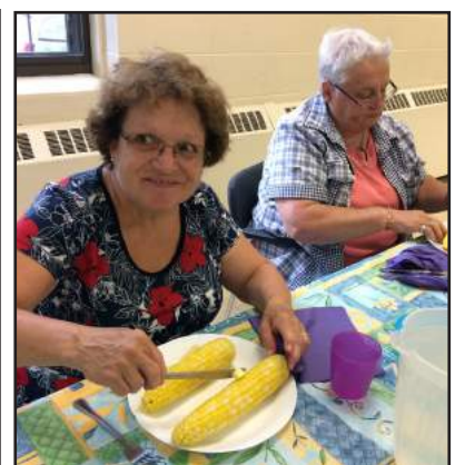
L'ÉPLUCHETTE DE BLÉ D'INDE