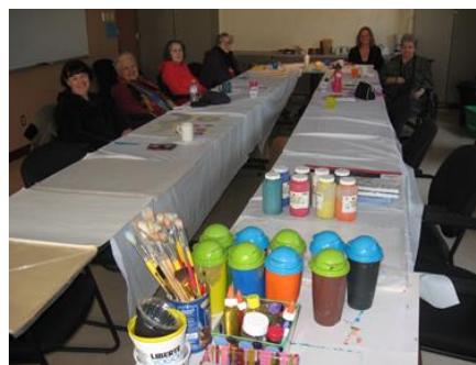
Atelier artistique destiné à nos membres et à leur proche aidant.