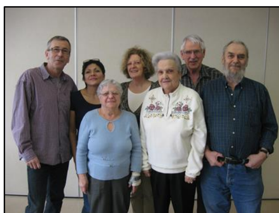
Les membres de votre conseil d'administration.