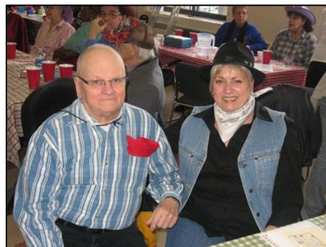
La fête country pour le grand bonheur de tous.