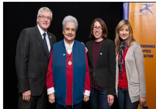
Un prix reconnaissance pour nos dix ans remis par Altergo.