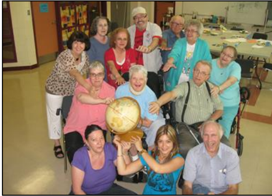
Photo prise pour symboliser le thème On a dix ans et on voit grand!