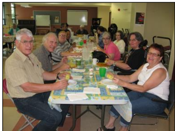
Notre épluchette de blé d'inde biologique!