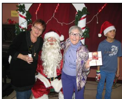
Le Père Noël de l'Alpar.