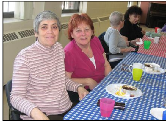
Notre fameux repas Cabane à sucre fait maison!