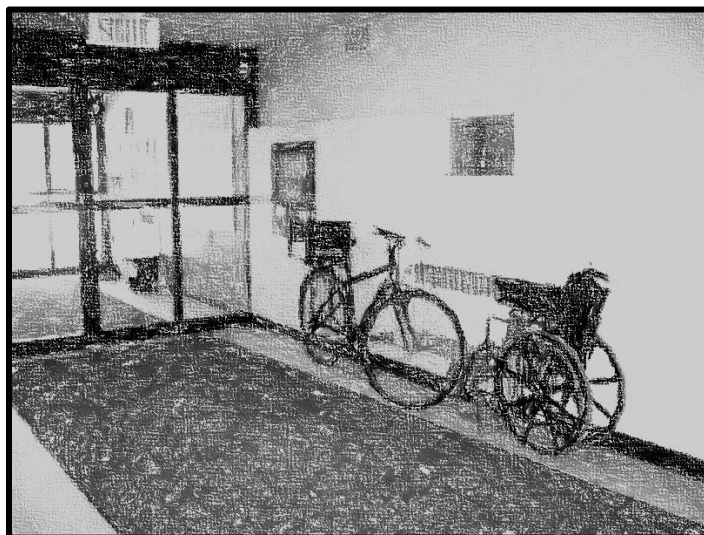
Scène de la vie quotidienne au Centre Lapalme

PRESENTÉ À L'ASSEMBLÉE GÉNÉRALE ANNUELLE LE 20 MARS 2013