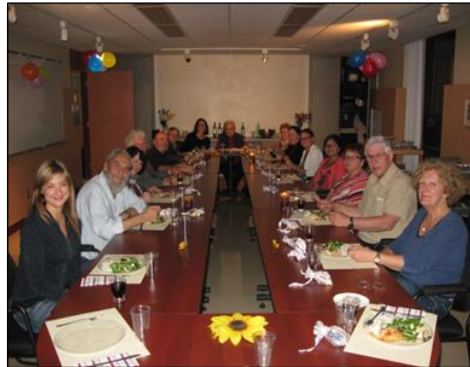
Un souper pour nos bénévoles dans le cadre des festivités du 10 ième anniversaire.