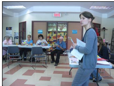
Conférence offerte par Option consommateur : les pièges de la retraite.