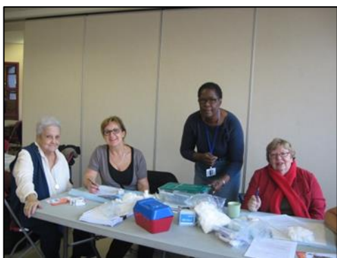
La clinique de vaccination offerte par le CSSS Lucille-Teasdale.