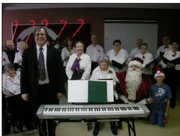
Notre fête de Noël en compagnie de l'ensemble Cœur Vaillant .