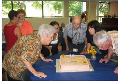
Des images souvenirs du 10 ème anniversaire.