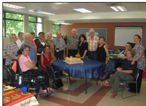
Notre équipe de bénévoles.

Des images souvenirs du 10 ième anniversaire.