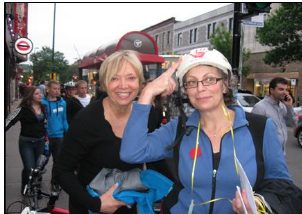
Quelques images du Cyclothon de l'Alpar – Johanne-Soucy, édition 2012.