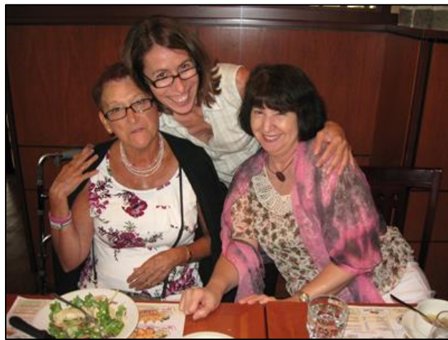
Une belle sortie au restaurant comme on les aime !