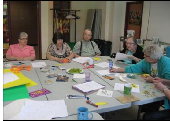
Le belle équipe d'artistes réunie pour créer des décorations en vue du 10 ième anniversaire.