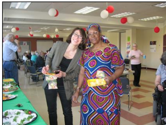
L'assemblée générale annuelle 2012 de l'Alpar.