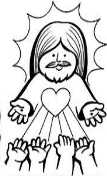
descendió a los infiernos, al tercer día resucitó de entre los muertos.