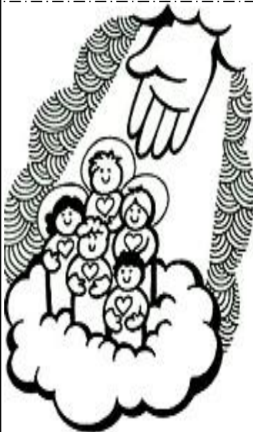
la comunión de los Santos,