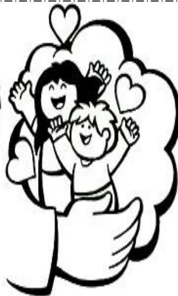
la resurrección de la carne y la vida eterna.