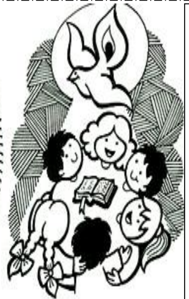
la santa Iglesia católica,