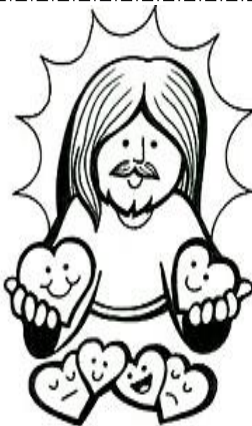
Desde allí ha de venir a juzgar a vivos y muertos.