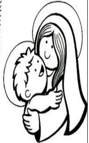
nació de Santa María Virgen,