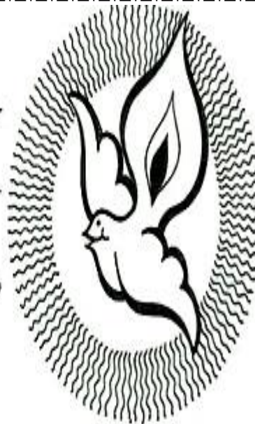
Creo en el Espíritu Santo,