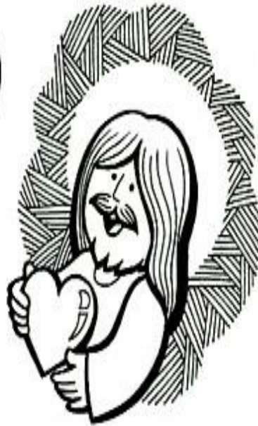
Creo en Jesucristo, su único Hijo, Nuestro Señor,