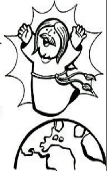
subió a los cielos