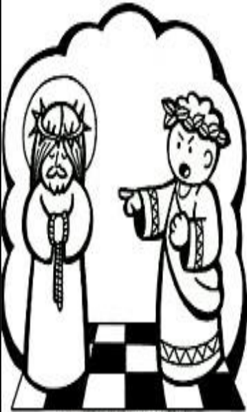
padeció bajo el poder de Poncio Pilato.