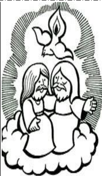
y está sentado a la derecha de Dios, Padre todopoderoso.