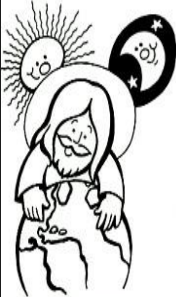
Creo en Dios, Padre todopoderoso Creador del cielo y de la tierra.