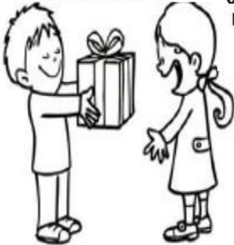
OBEDECIENDO LA PALABRA DE DIOS