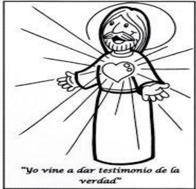
Tarjetas para regalar en la liturgia