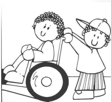
Servir al Necesitado