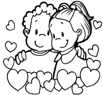
Amor al Prójimo