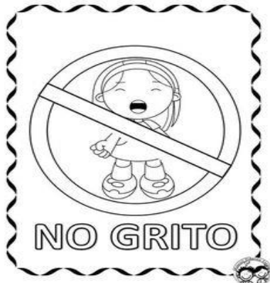
Controlar las Emociones Negativas