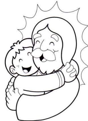
Amor a Dios