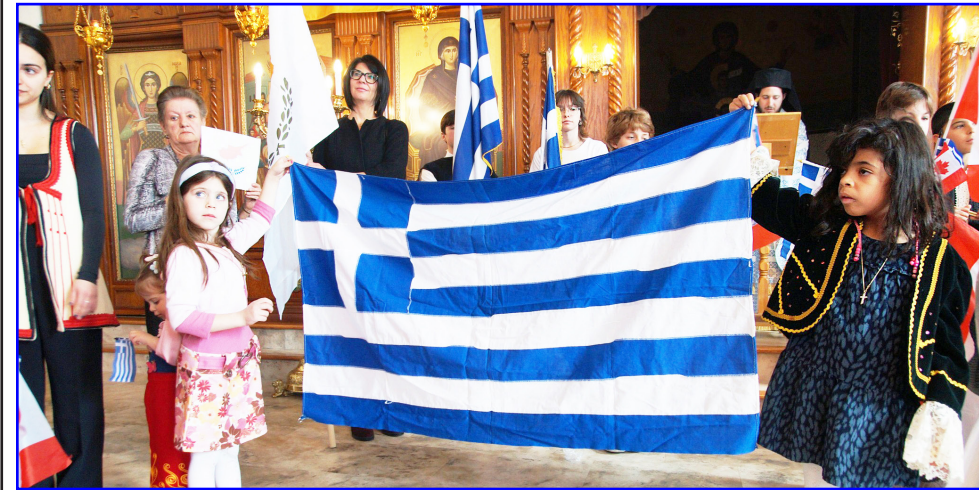
Εορτασμός της 25ης Μαρτίου στον Ι.Ν. Κοίμησης της Θεοτόκου, Kingston με την γαλανόλευκη να δεσπόζει στο κέντρο του Ναού.