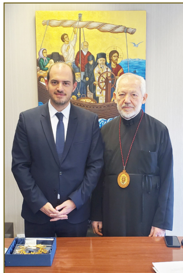
Ο Υφυπ. Εξωτερικών, αρμόδιος για τον Απόδημο Ελληνισμό κ. Κώστας στο γραφείο του Αρχιεπ. Σωτηρίου. The Deputy Minister of Foreign Affairs and Minister of Hellenism Abroad, Mr. Kostiras, in the office of Archbishop Sotirios.

Παρασκευή, 23 Φεβρουαρίου. Ο εντιμ. Γεν. Πρόξενος της Ελλάδας στο Τορόντο κ. Παναγιώτης Αντωνάτος παρέθεσε δείπνο στην οικία του και παρέκάθησαν ο Αρχιεπ. Σωτήριος, η πρέσβης της Ελλάδας στον Καναδά κα Κατερίνα Δημάκη με τον σύζυγό της, η πρόεδρος της ΕΚΤ κα Μπέτυ Σκουτάκη, ο πρόεδρος του Ιδρύματος Ελληνικής Κληρονομιάς (ΗΗΦ) κ. Εντυ Σερέτης, ο πρόεδρος της Ελληνικής Πρωτοβουλίας Καναδά (The Hellenic Initiative Canada) κ. Σώτος και φυσικά οι αμφιτρύονες της βραδιάς ο εντιμ. Γεν. Πρόξενος της Ελλάδας κ. Παναγιώτης Αντωνάτος με την ερίτιμη σύζυγό του και συνεζήτησαν το θέμα οργάνωσης της επίσκεψης του πρωθυπουργού της Ελλάδας κ. Κυριάκου Μητσοτάκη.