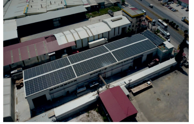
Serven GES / 295,2kWp