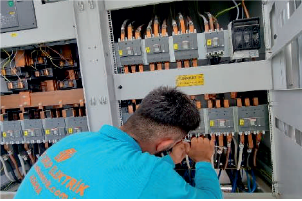
GES Pano Bakım ve Kontrolleri