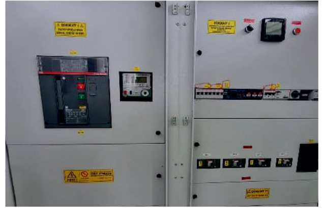
GES Pano Ölçüm ve Testleri