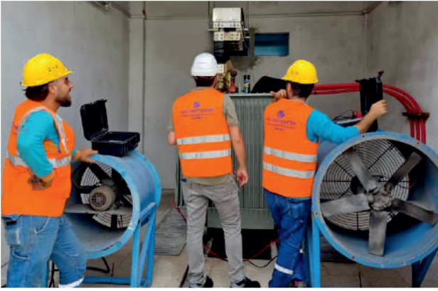
Trafo Sargı Direnci ve Megger İzolasyon Tesi