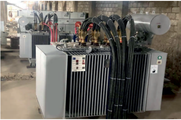
Sultan Family 6MVA Trafo Tesisi