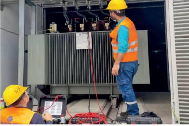
Trafo Çevrim Oranı Ölçümleri