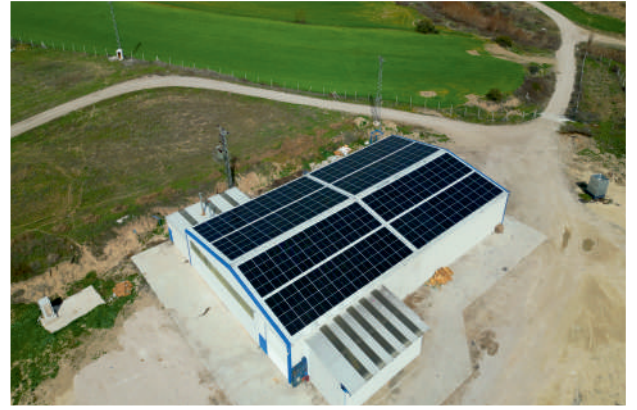
Tayftar Tarım GES / 174,4kWp