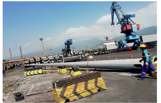
İsdemir 17 Direkli Ç. Aydınlatma