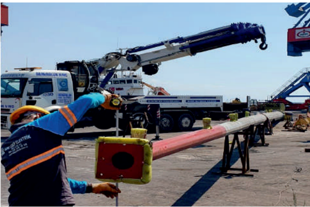
İsdemir 17 Direkli Ç. Aydınlatma