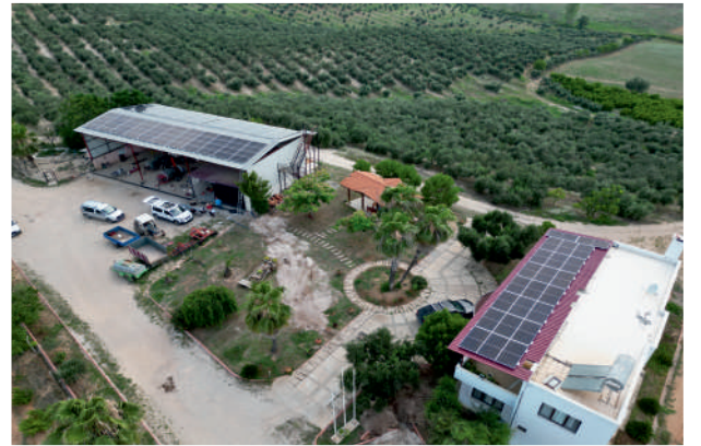
Ales Tarım GES / 50,5kWp