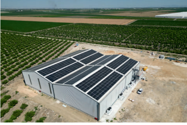
Ölke GES / 401,12kWp