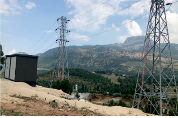
ADK GES 3/0 ENH - 1.7 km