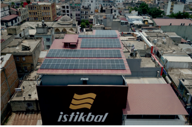
Yüksel 1 GES / 66,88 kWp