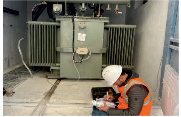
Trafo Yağ Analizi