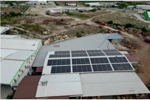
Dal Kereste GES / 148,46kWp