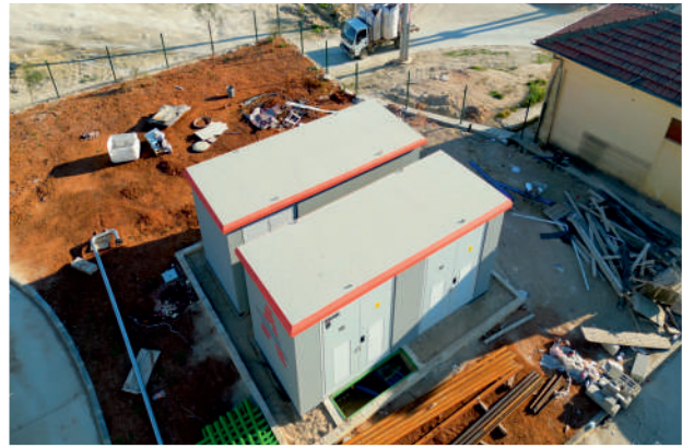
Green Enerji 1250kVA Trafo Tesisi