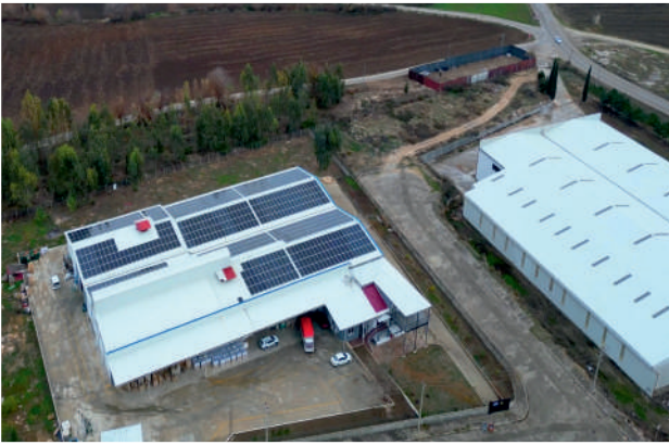
Multisistem GES / 308kWp