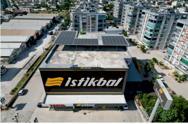
Yüksel 3 GES / 52,32kWp