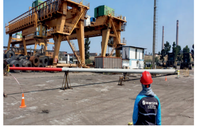
İsdemir 17 Direkli Ç. Aydınlatma