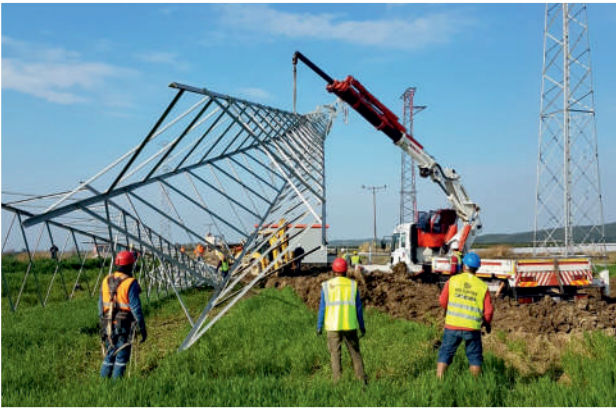
Teoman GES 3/0 ENH - 3 km