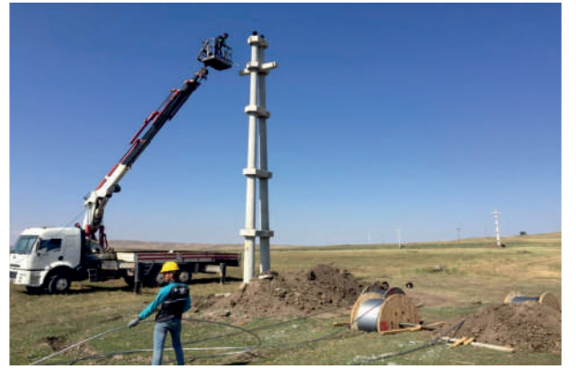
Ala GES 3/0 ENH - 5.6 km