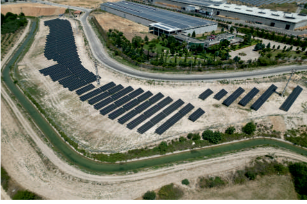
Kadirli OSB GES / 992kWp