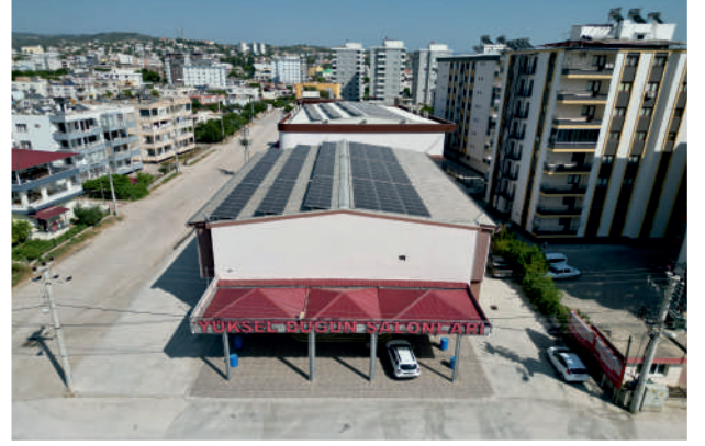
Yüksel 2 GES / 180,39 kWp