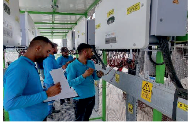
İnverter Test ve Ölçümleri