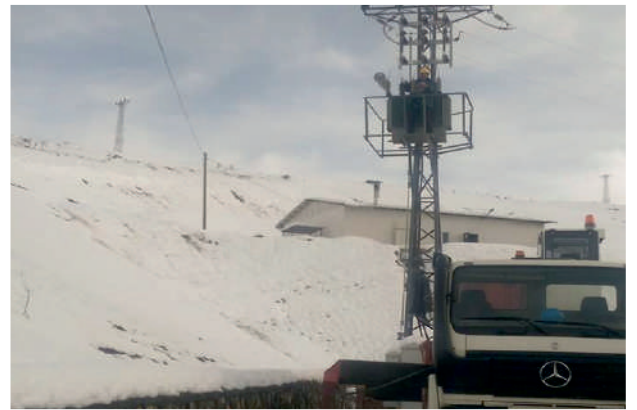
Direk Üstü Trafo Montajı