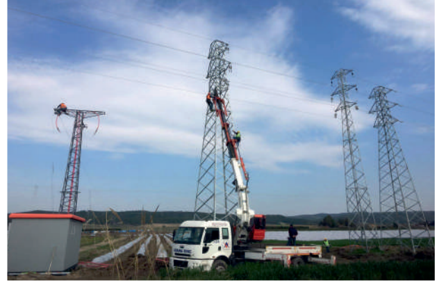
Ayvalık GES 3/0 ENH - 4 km