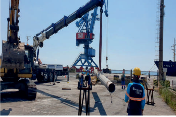
İsdemir 17 Direkli Ç. Aydınlatma