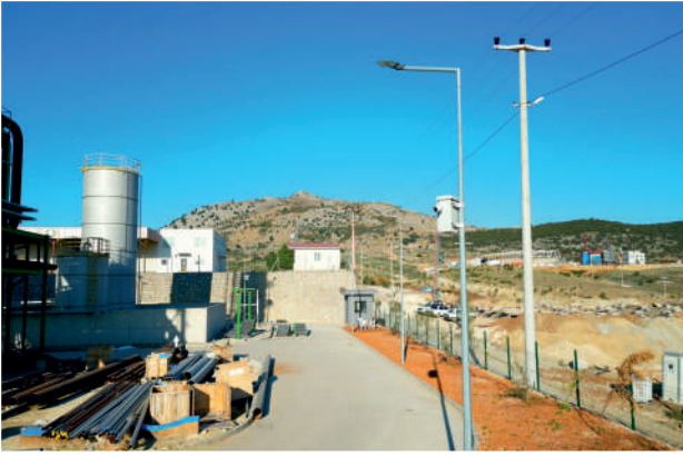
Green Enerji Kamera Sistemleri