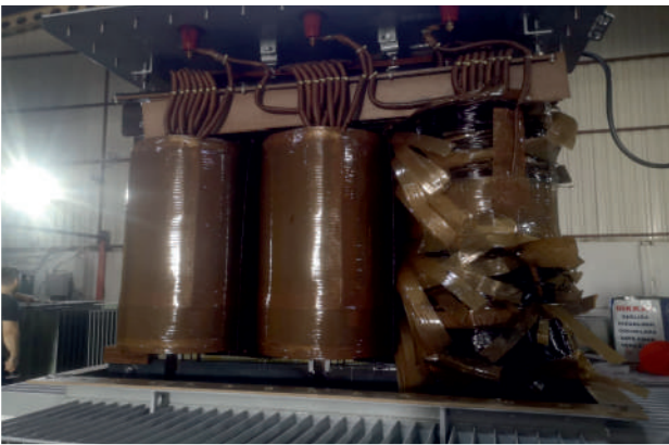
Yerinde Trafo Kontrolleri ve Yanık Trafo Tamiri