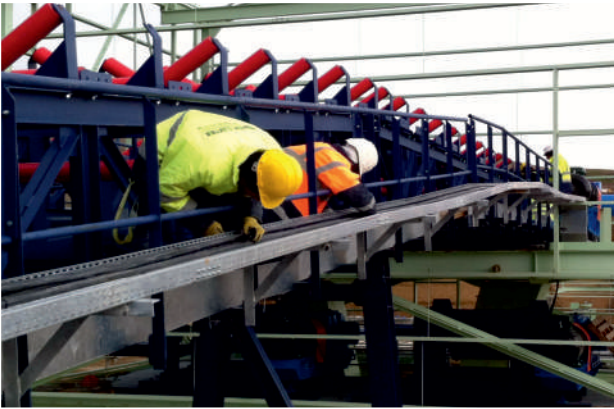
Kablo Çekim İşlemi