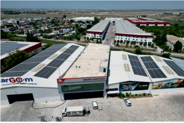
Kuşcuoğlu GES / 304kWp