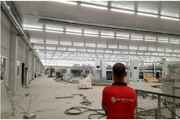
JNR Dış Aydınlatma Sistemleri