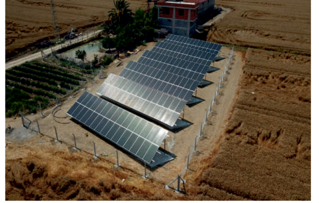
Akdemir GES / 73,8kWp