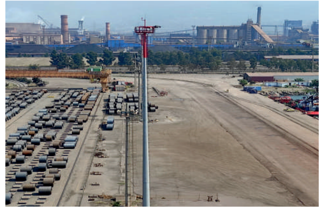
İsdemir 17 Direkli Ç. Aydınlatma