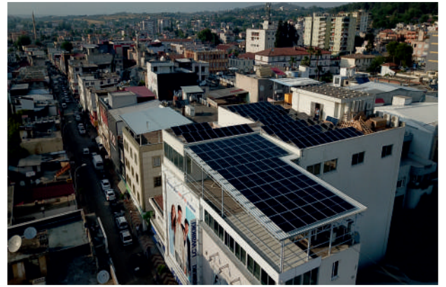
LCW GES / 76,44kWp