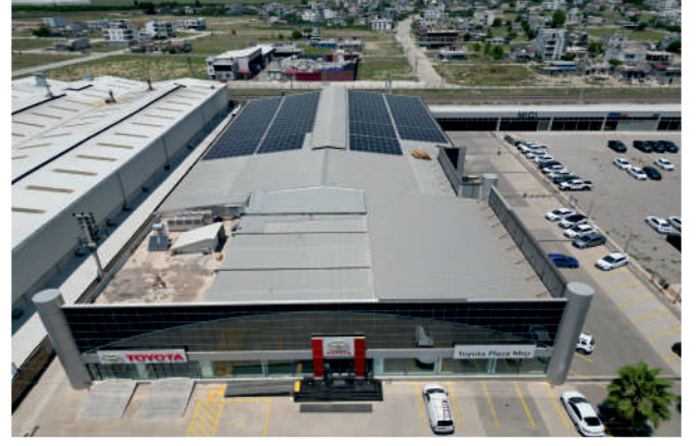
Toyota Plaza Mıçı GES / 288kWp