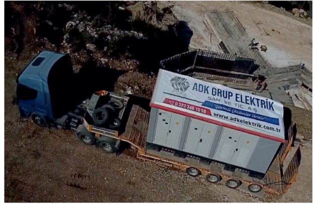
Dimaks 3.83MVA Trafo Tesisleri