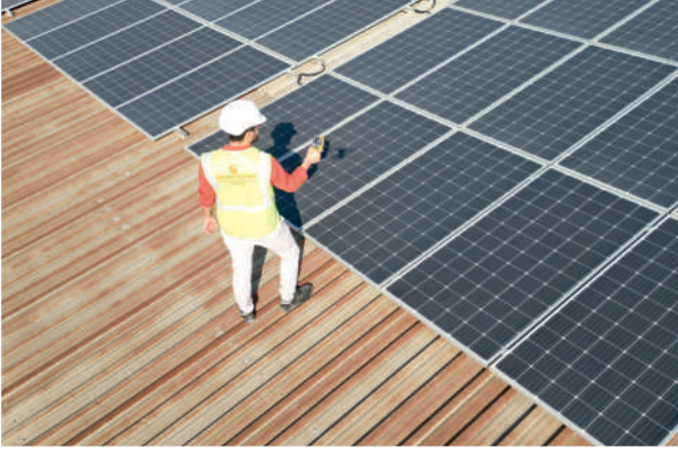
GES Termal Kamera Kontrolleri