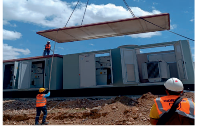
Fermas 7.5MVA Trafo Tesisleri