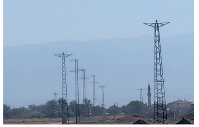
Özler Swallow ENH - 8 km