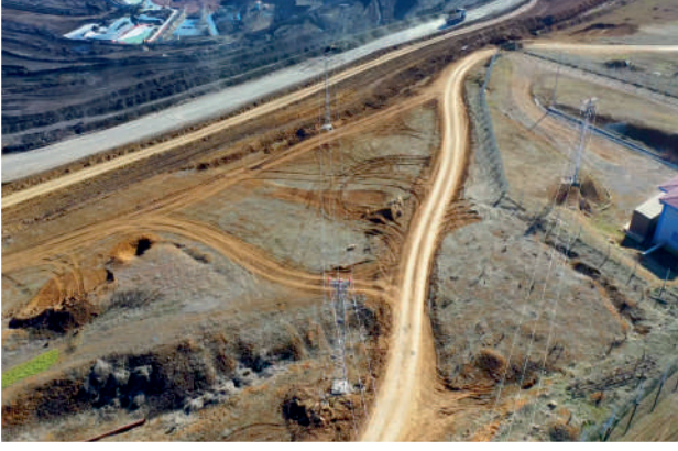
Fernas Swallow ENH - 7 km