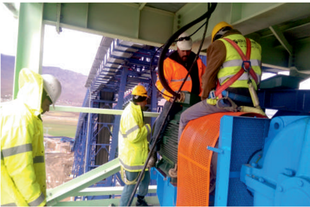
Bant Conveyor Motor Bağlantısı