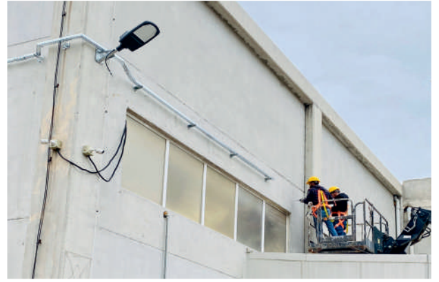
JNR Dış Aydınlatma Sistemleri