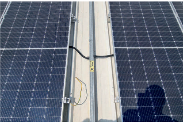
Proje Uygunluk ve Kontrolleri