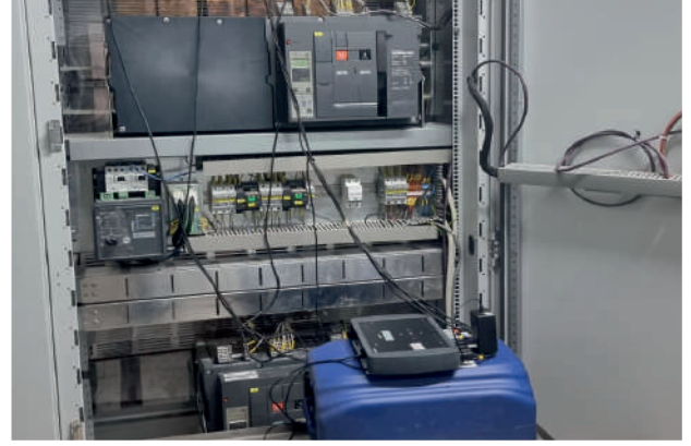
Harmonik Ölçümleri ve Testleri