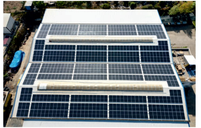
Nika GES / 240,24kWp