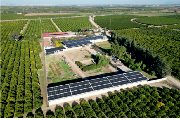
Ramazanoğlu GES / 597,87kWp