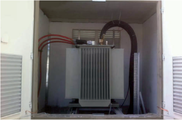
Emta 7MVA Trafo Tesisleri