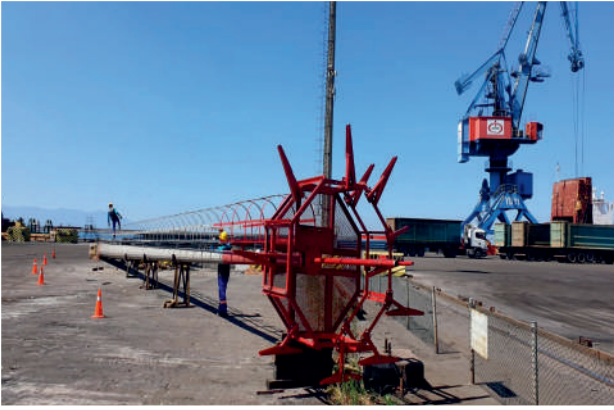
İsdemir 17 Direkli Ç. Aydınlatma