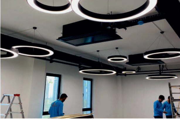
Green İç Aydınlatma Sistemleri