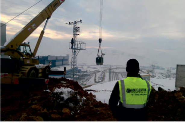
Direk Üstü Trafo Montajı