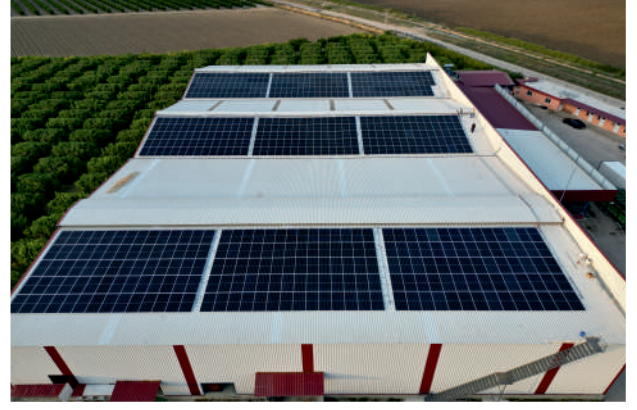
Orbaç GES / 288,02kWp