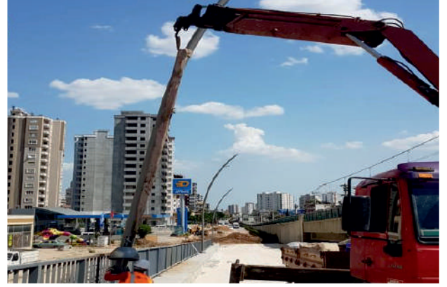
İkizler Köprüsü Aydınlatma Sistemleri