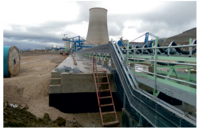
Motor Bağlantı Kablosu Reglajı