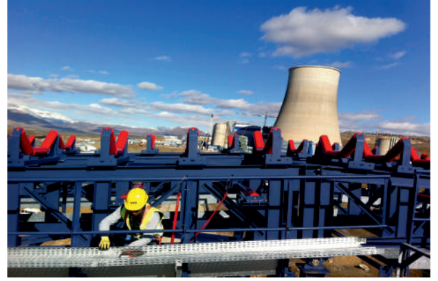
Tava Montaj İşlemi