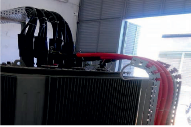
JNR 18MVA Trafo Tesisleri