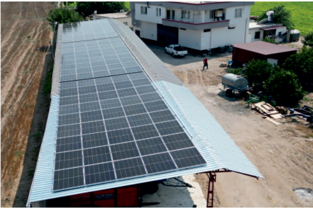
Terzi GES / 73,57kWp