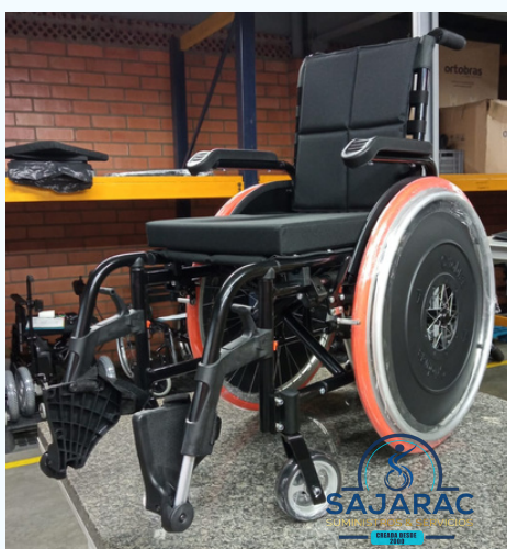
SILLA DE RUEDAS PARA BOCCIA