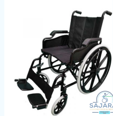
ESTANDAR TIPO ESCRITORIO-REMOVIBLE