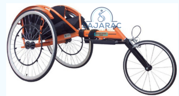
SILLA DE RUEDAS PARA ATLETISMO