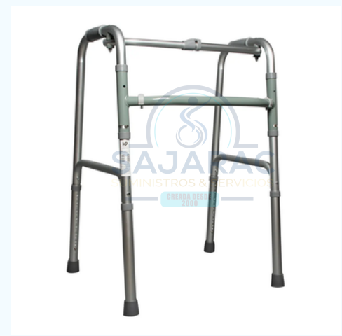
CAMINADOR PASO A PASO - ESTANDAR