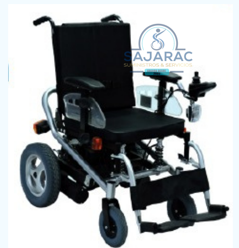
SILLA DE RUEDAS ELECTRICAS