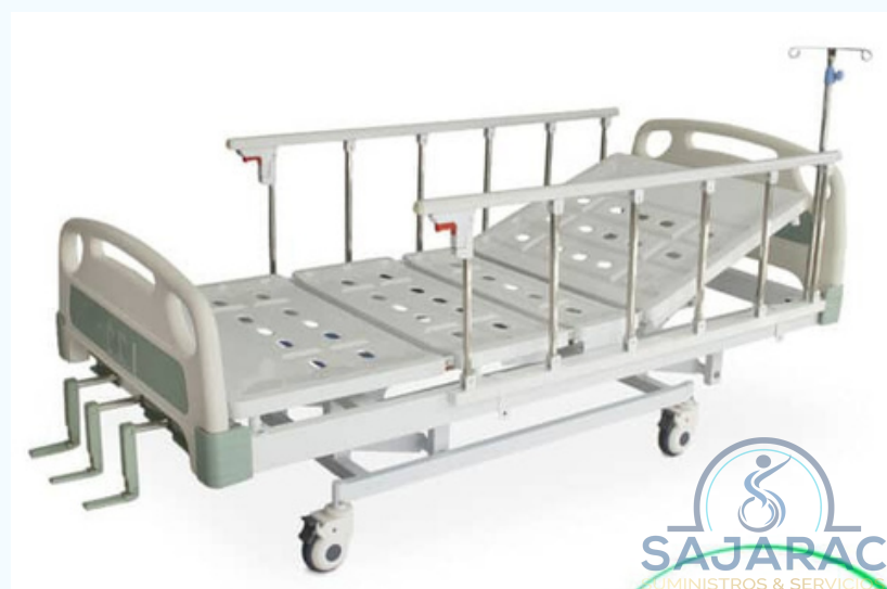
CAMA HOSPITALARIA MANUAL