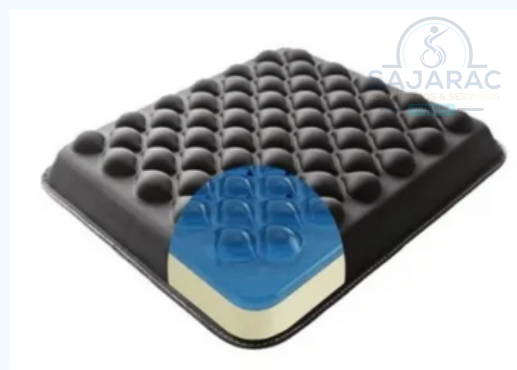
COJIN EN GEL ANTIESCARRAS