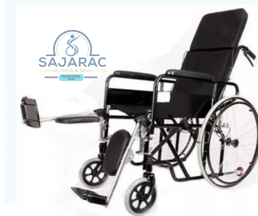
SILLA DE RUEDAS NEUROLOGICA