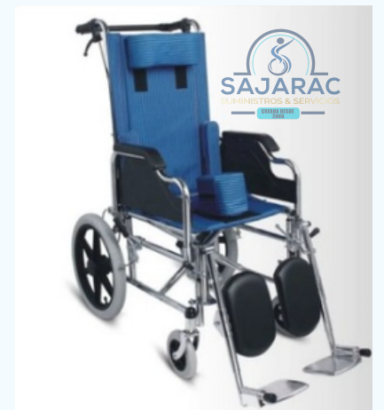
SILLA DE RUEDAS NEUROLOGICA PEDIATRICA