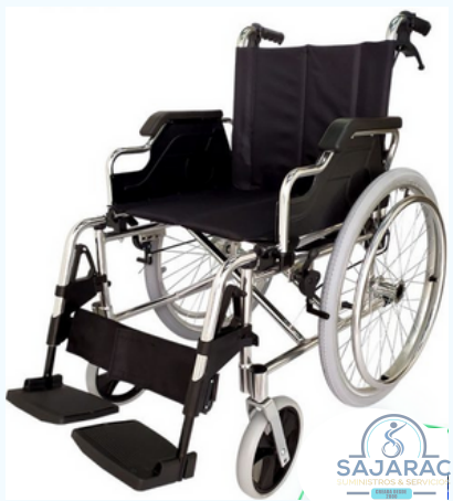
SILLA EN ALUMINIO- DESMONTE RAPIDO