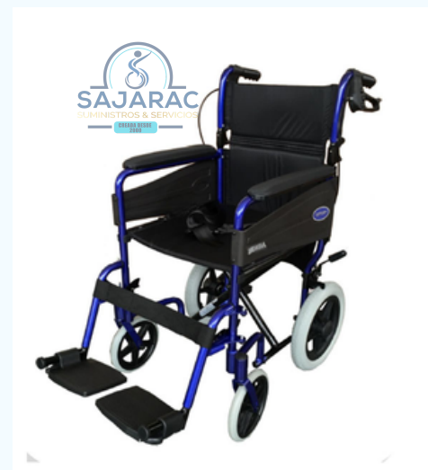
SILLA DE RUEDAS TIPO ACOMPAÑANTE