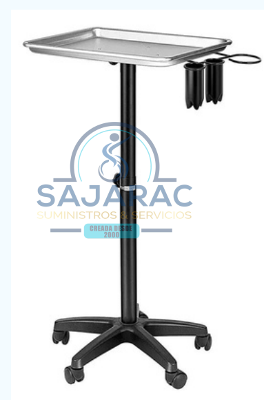
BANDEJA INSTRUMENTOS MEDICOS