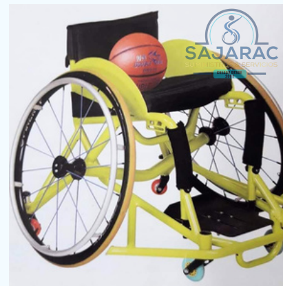
SILLA DE RUEDAS PARA BALONCESTO