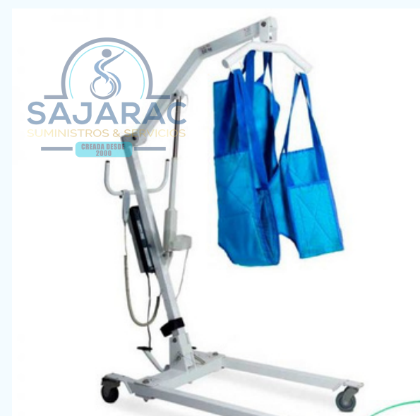
GRUA PARA PACIENTES ELECTRICA Y MECANICA