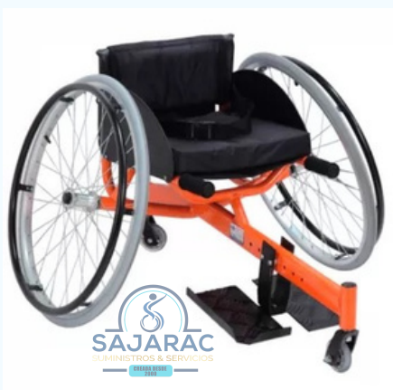
SILLA DE RUEDAS PARA PRACTICA DE TENIS