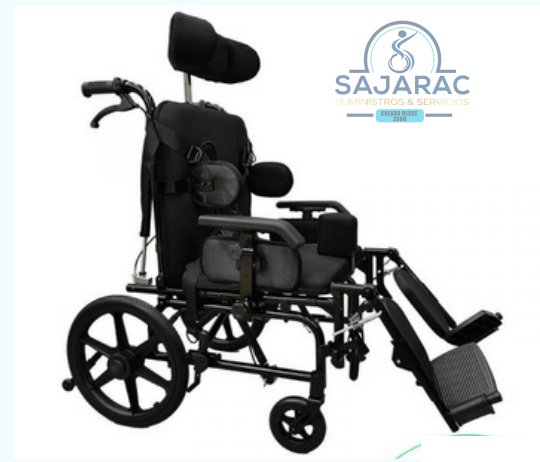
NEUROLOGICA BASCULANTE DULTO- PEDIATRICA