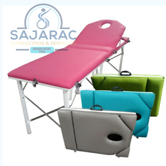
CAMILLA PLEGABLE PORTATIL