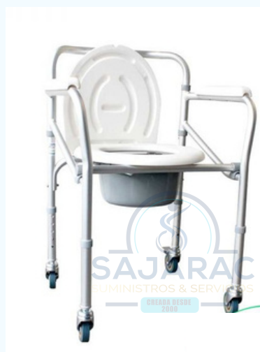
SILLA SANITARIA CON Y SIN RODACHINES