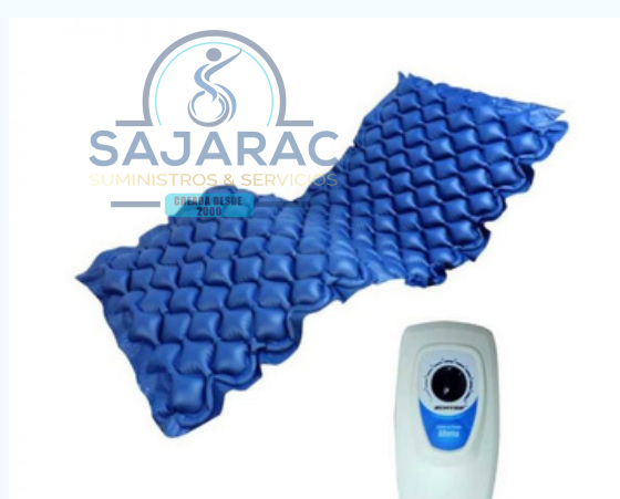
COLCHONETA INFLABLE ANTIESCARAS