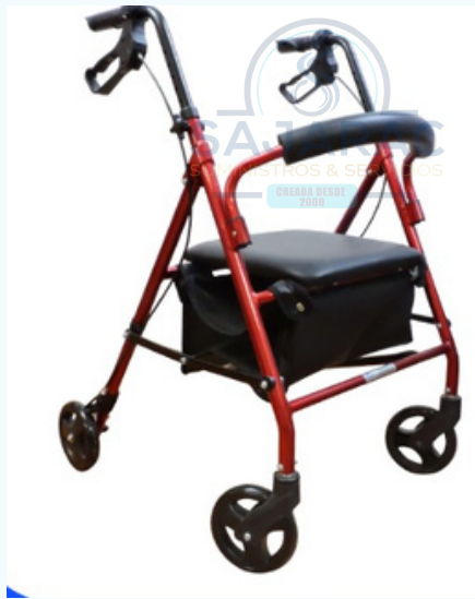
CAMINADOR ROLLADOR CON SILLA