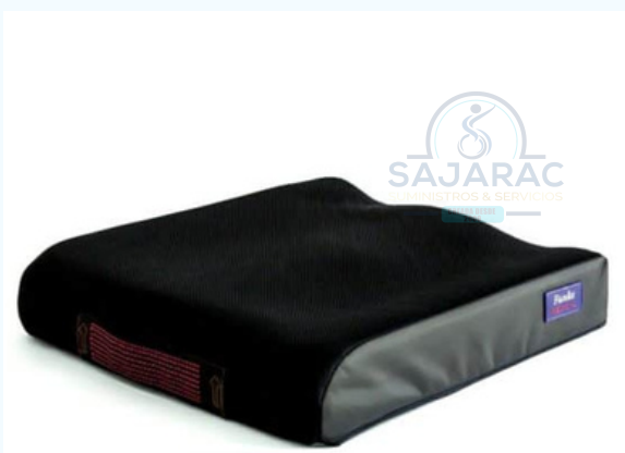
COJIN EN ESPUMA ANTIESCARRAS