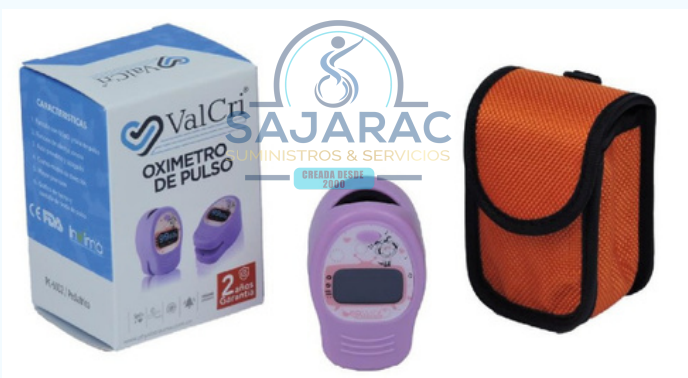
OXIMETRO DE PULSO