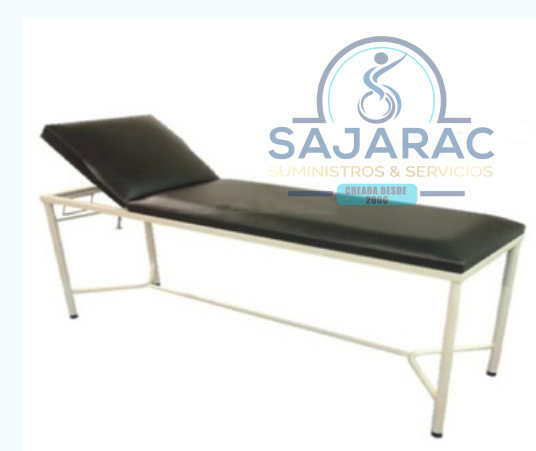
DIVAN PARA EXAMENES