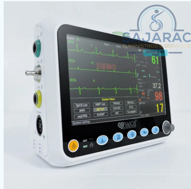
MONITOR DE SIGNOS VITALES