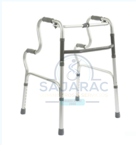
CAMINADOR DOBLE APOYO