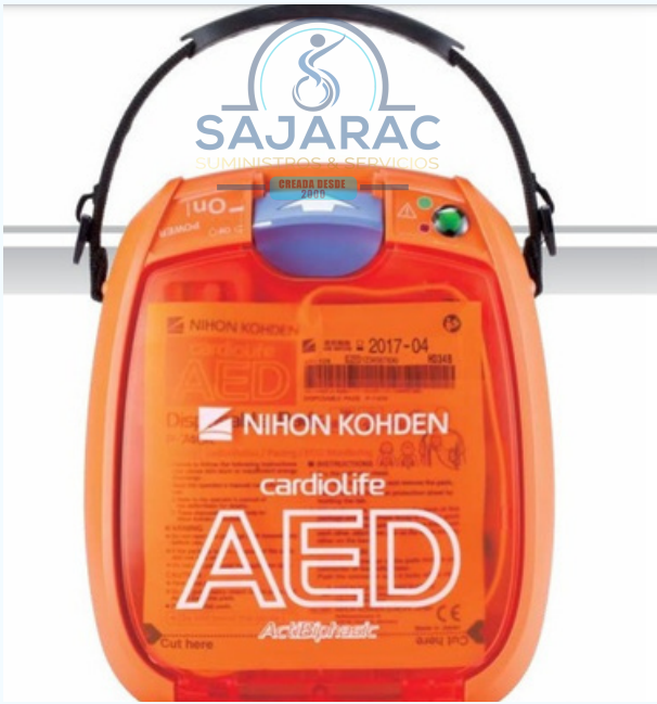
DESRILADOR EXTERNO AUTOMATIZADO