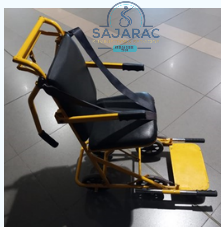
SILLA DE RUEDAS TIPO AVION