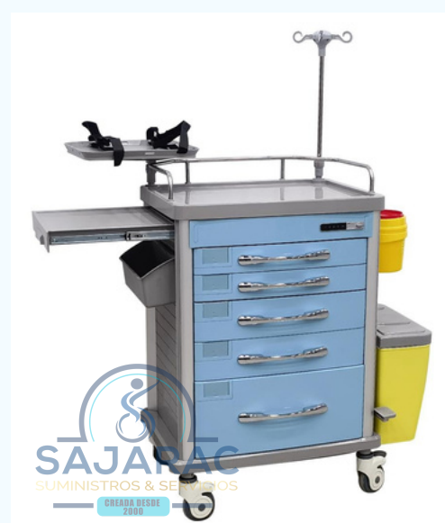
CARRO DE PARO