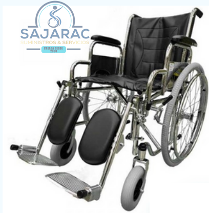
ESTANDAR PIECERO ELEVABLE