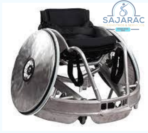
SILLA DE RUEDAS PARA RUGBY