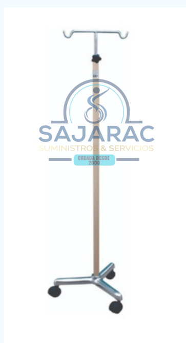
ATRIL PARA SUERO