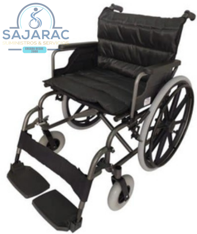
SILLA DE RUEDAS SOBRE PESO