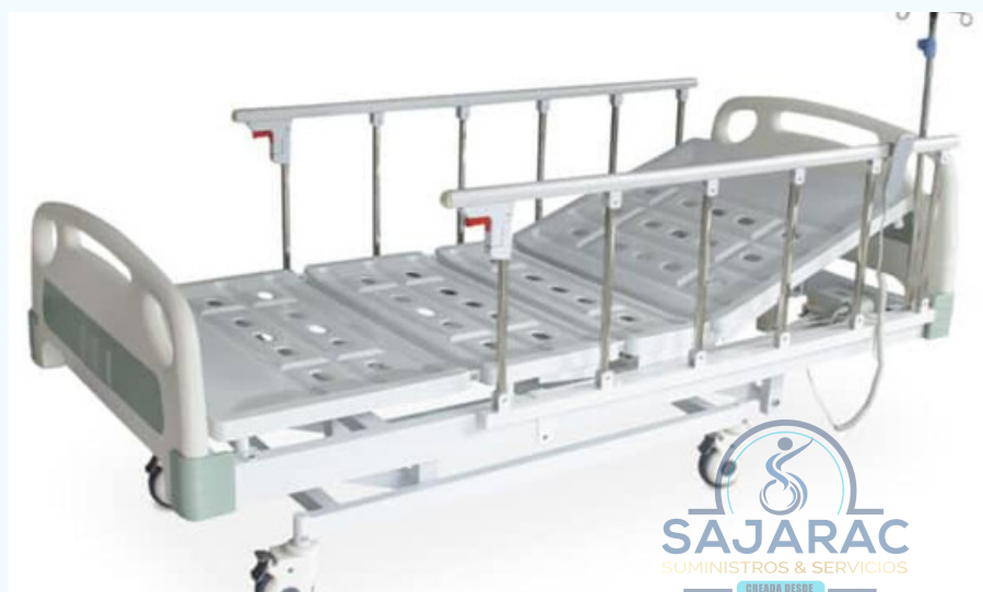
CAMA HOSPITALARIA ELECTRICA