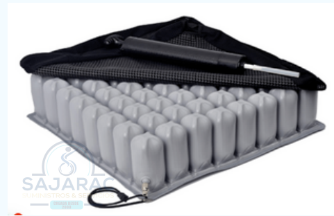
COJIN FLOTACION PERFIL ALTO Y BAJO