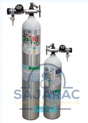
BALA DE OXIGENO