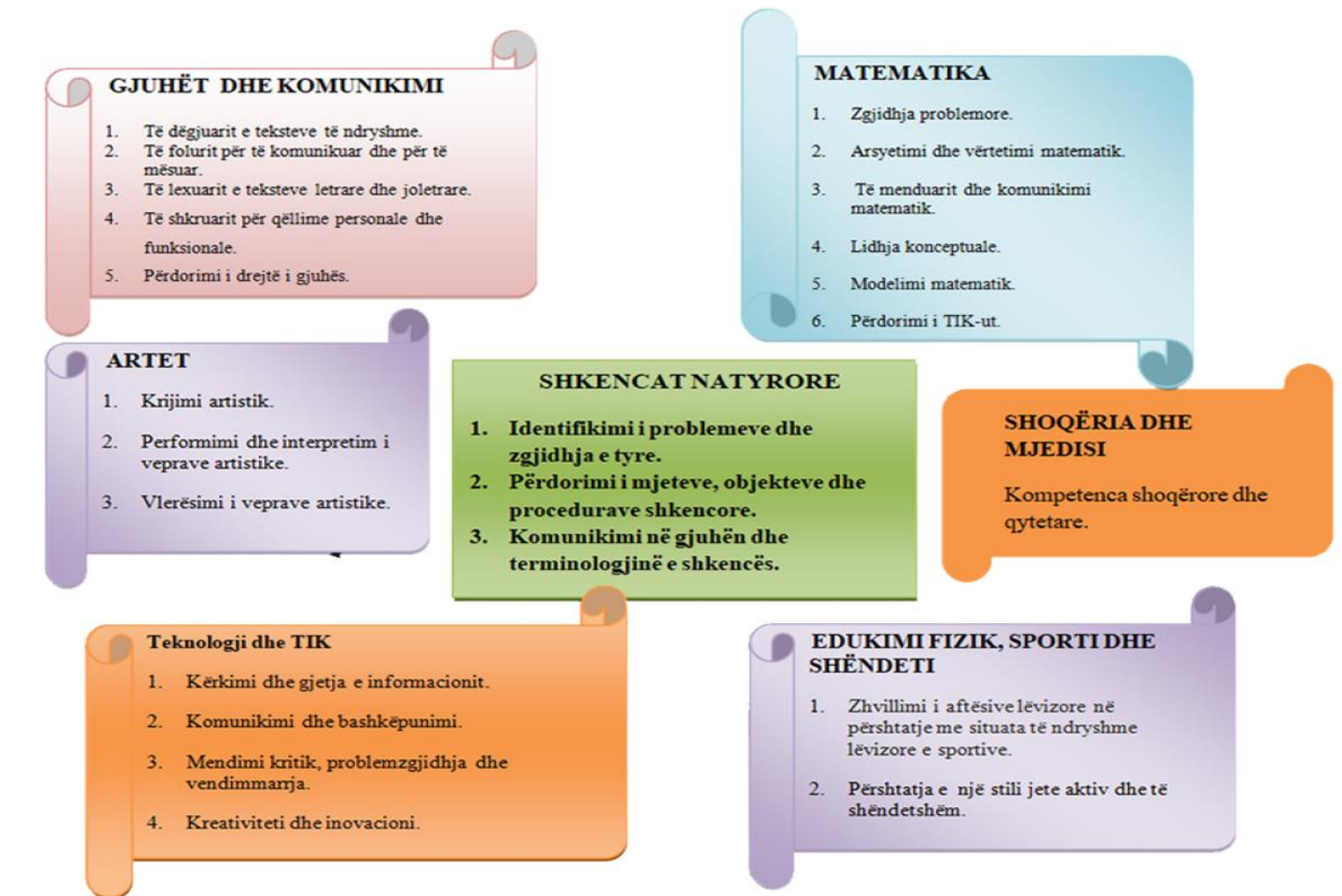
Diagrama 2 : Lidhja e kompetencave të fushës së shkencave natyrore me kompetencat e fushave të tjera