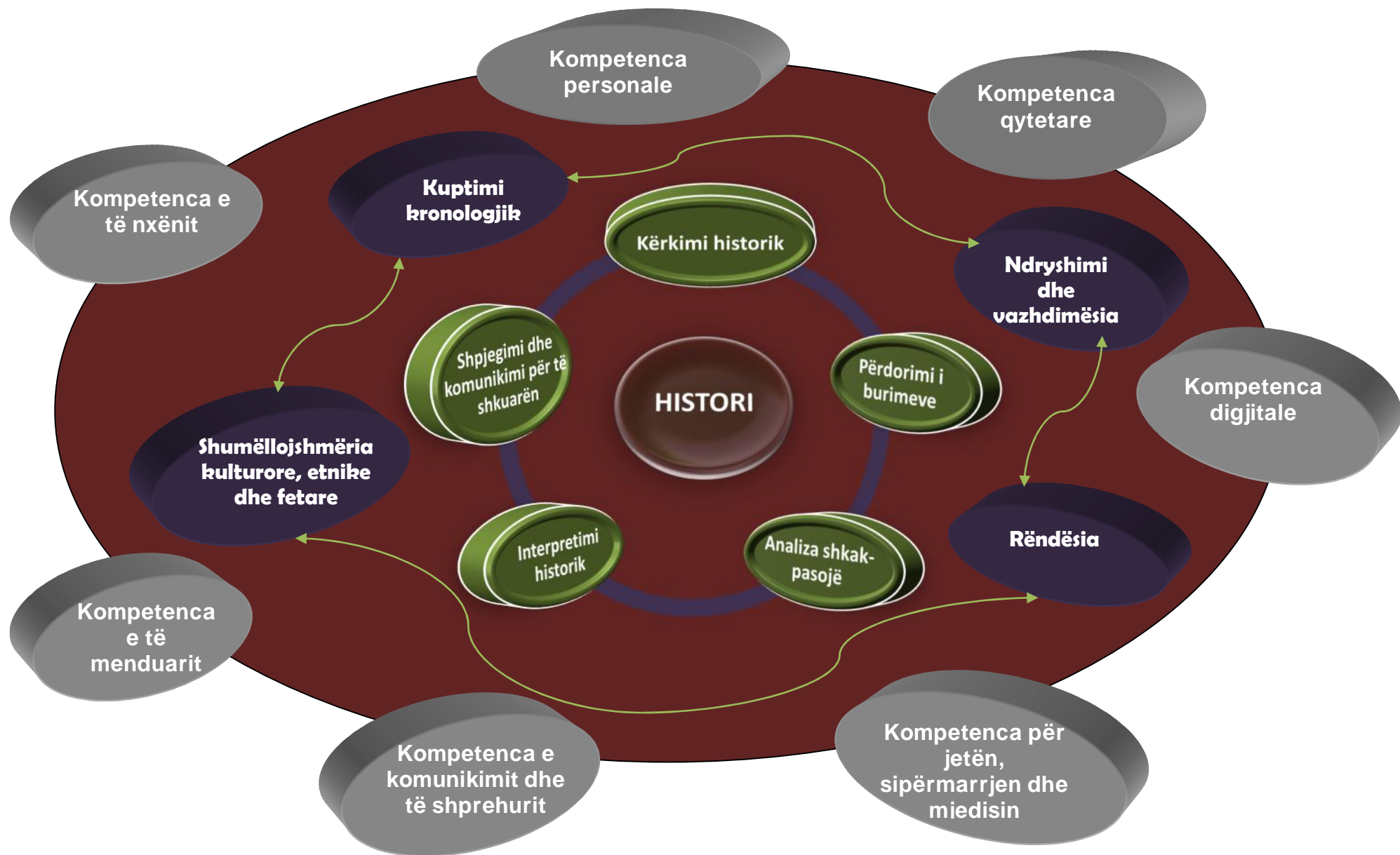
Diagrami 3. Kompetencat dhe konceptet e lëndës së historisë