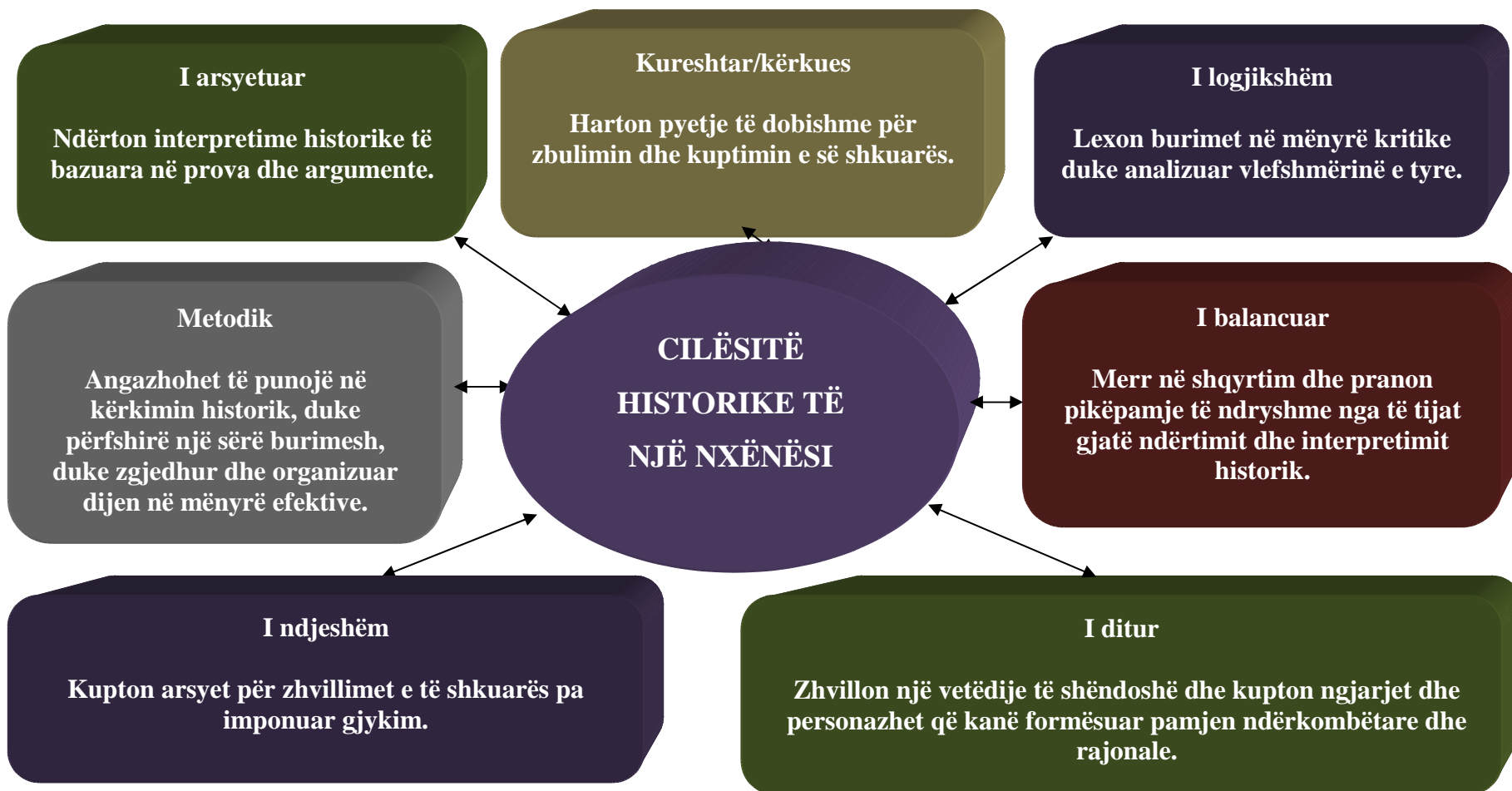
Diagrami 4. Cilësitë historike të nxënësit