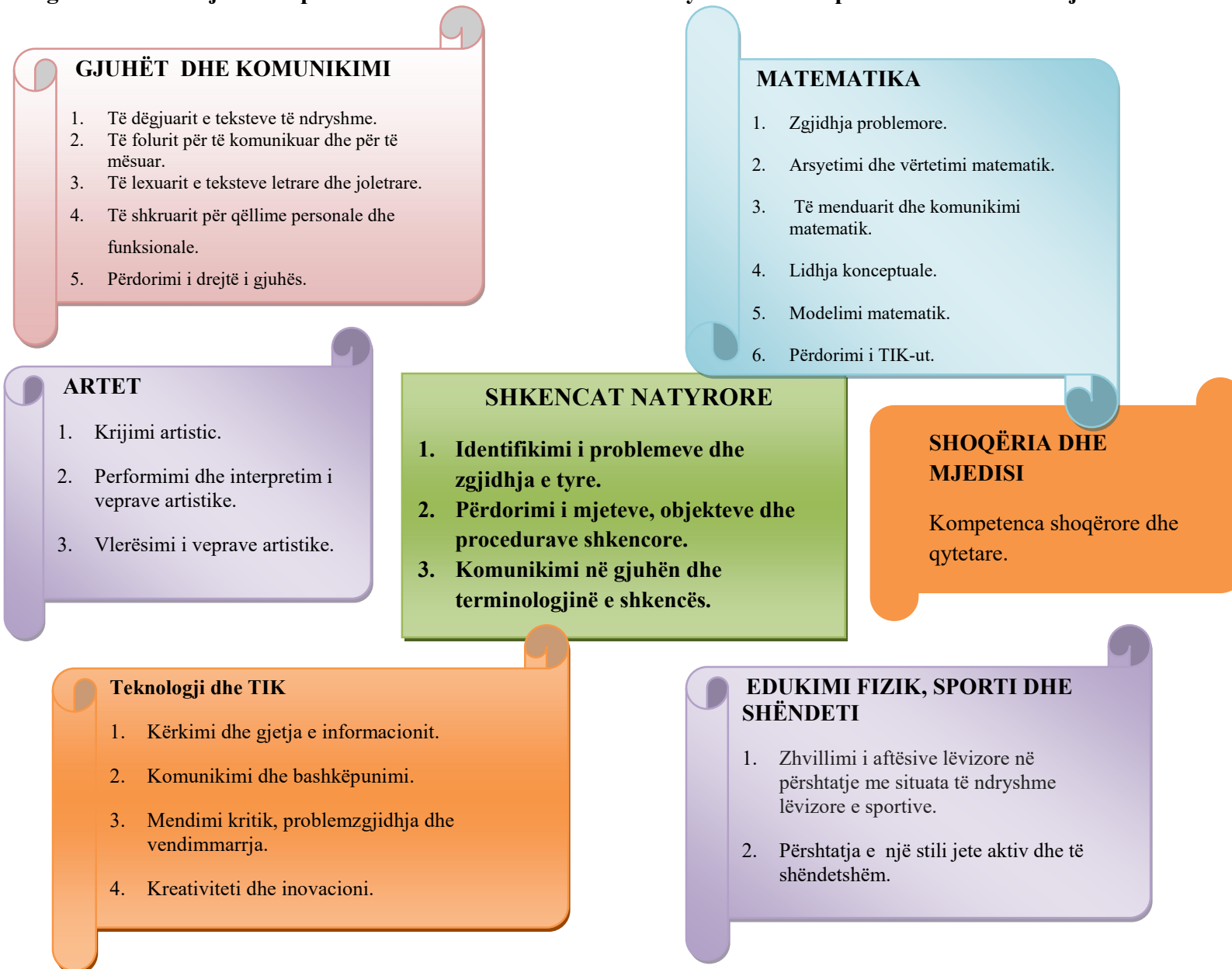
Diagrama 2 : Lidhja e kompetencave të fushës së shkencave natyrore me kompetencat e fushave të tjera.