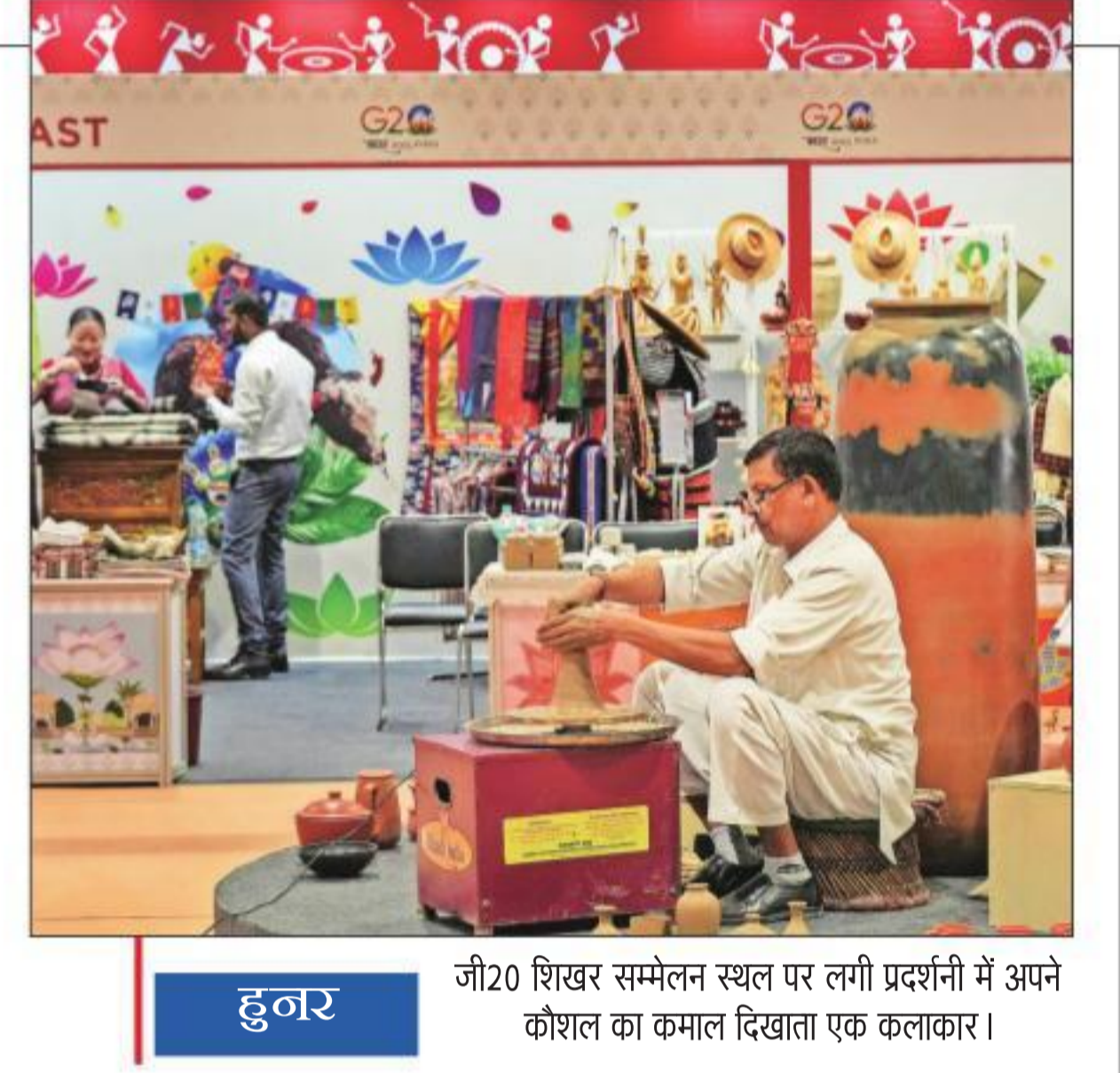
हुनर जी20 शिखर सम्मेलन स्थल पर लगी प्रदर्शनी में अपने कौशल का कमाल दिखाता एक कलाकार।