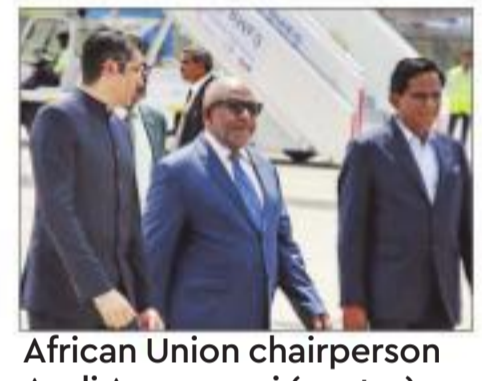
African Union chairperson Azali Assoumani (centre) with other members.

AFRICAN UNION (AU) President Azali Assoumani landed in New Delhi on Friday afternoon for participation in the G-20 Summit, where a decision is likely to be taken on making the grouping of 55 African nations a full member of the 20-nation economic block. The African Union