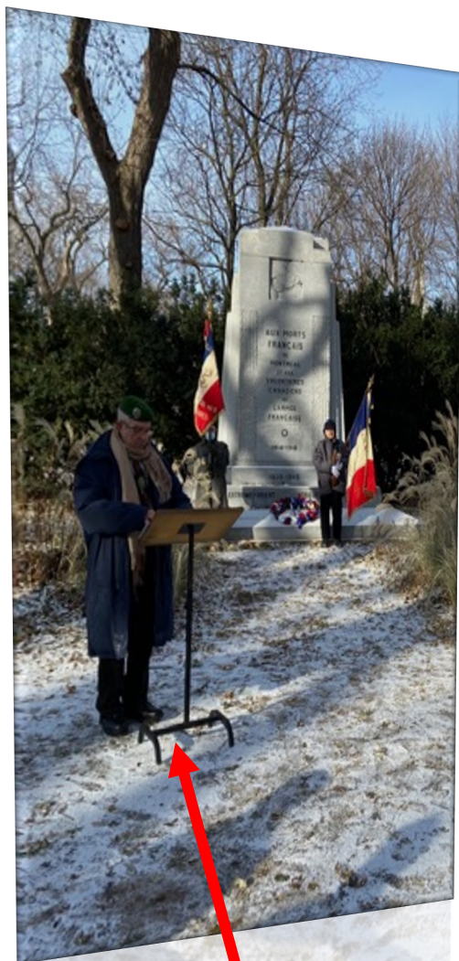
Célébration du 5 décembre 2021