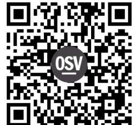
Donate / Donar