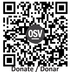
Donate / Donar