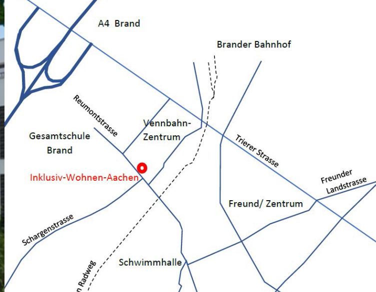
LAGE DES HAUSES