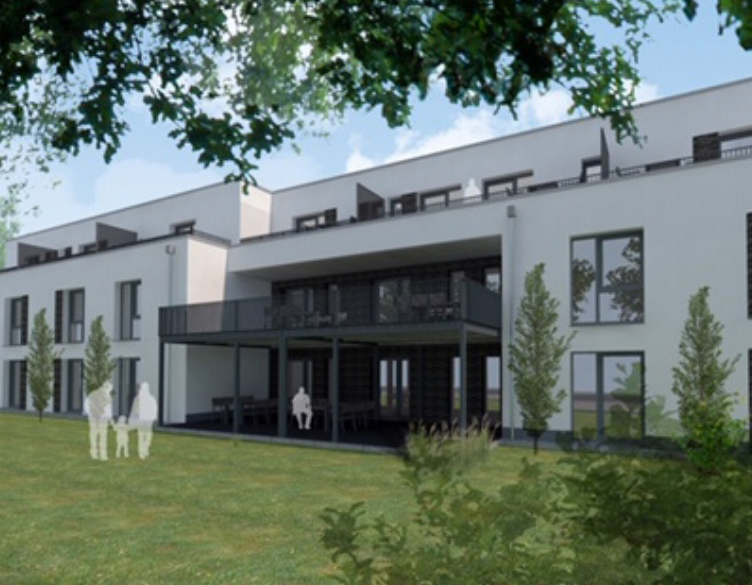
ANSICHT VON DER ROMBACHSTRASSE