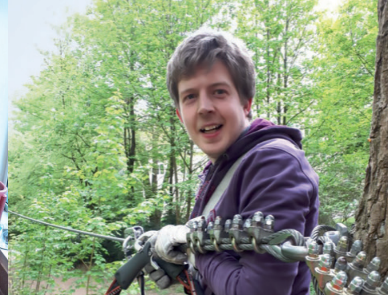
WIR FREUEN UNS AUF DAS WOHNEN IM INKLUSIVEN HAUS

Der Verein Inklusiv Wohnen Aachen e.V. realisiert ein innovatives Wohnprojekt.