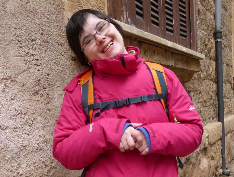
ALLE HABEN DAS RECHT IN DER MITTE DER GESELLSCHAFT ZU LEBEN.