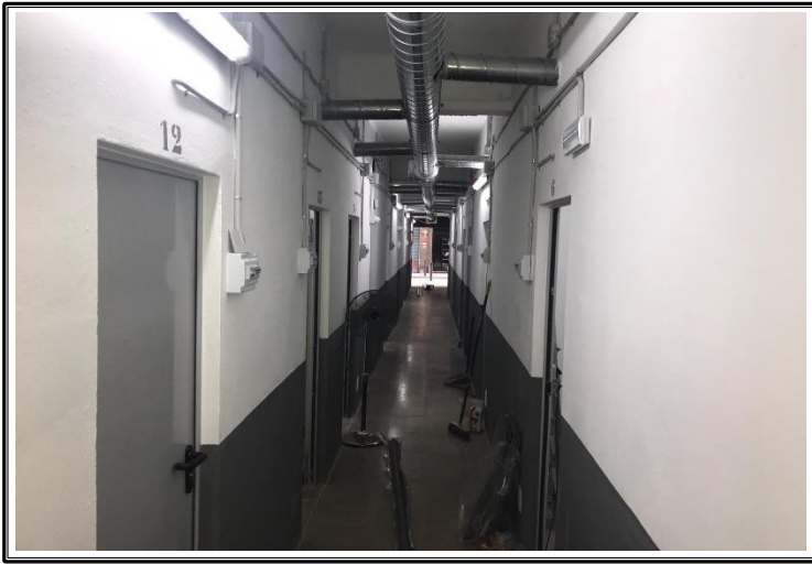
Pasillo para acceder a las sub-entidades con imagen de sistema de ventilación forzada.