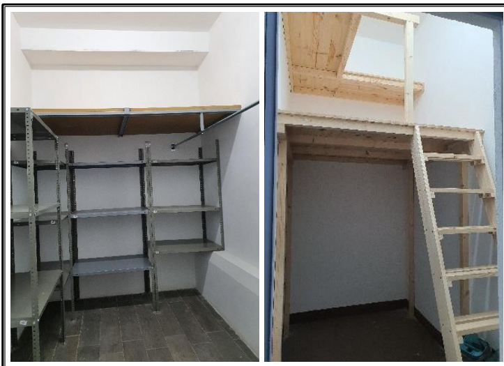
Estanterías y altillos