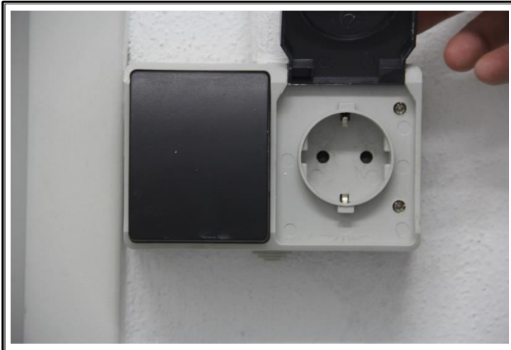
Enchufe e interruptor (interior sub-entidad)