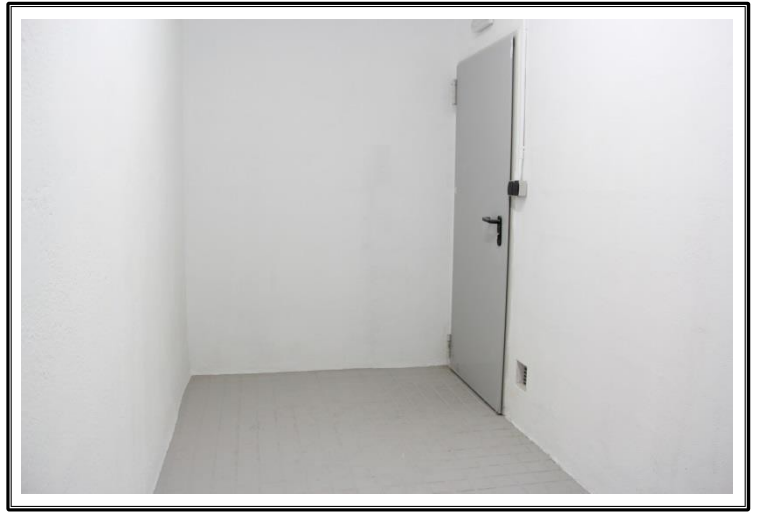
Interior de la entidad