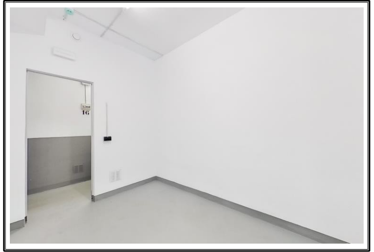
Interior de la entidad.