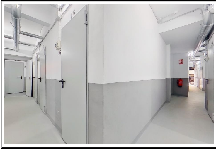
Pasillos para acceder a las subentidades con imagen De ventilación forzada.