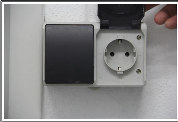
Enchufe e interruptor (interior sub-entidad)