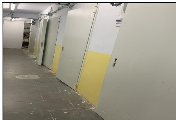
Pasillo con contador y ventilacion, todo en RF