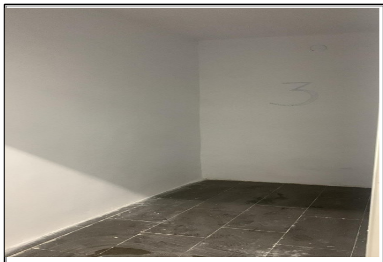
Interior de la entidad