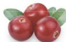
Семена клюквы Cranberry Seed