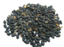
Черный тмин Black Cumin Seed

RAIN CORE ЗАХИСТ. ОЧИЩЕННЯ. ДЕТОКСИКАЦІЯ