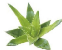
Алое - вера Aloe Vera