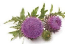
Семена чертополоха Milk Thistle Seed