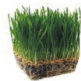
Ростки пшеницы Wheat Grass