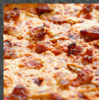
La bacon oignons