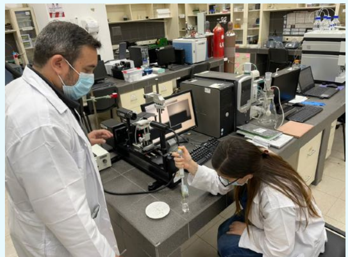
Centros de Investigación