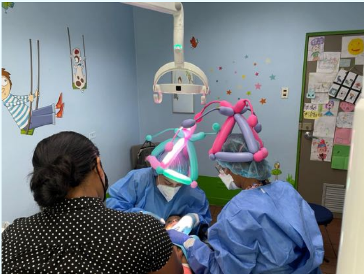
Externado Clínica Marcial Fallas Diaz