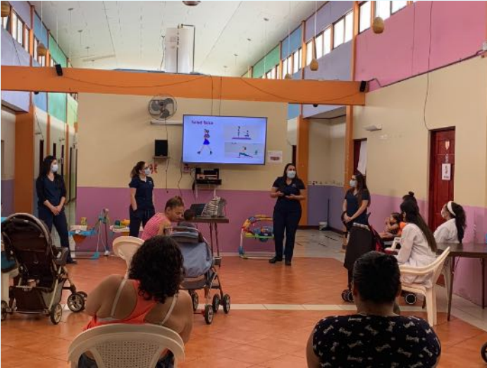
Actividades de educación con madres de casa cuna en Centro de Atención Institucional Vilma Curling – Centro Penitenciario Buen Pastor