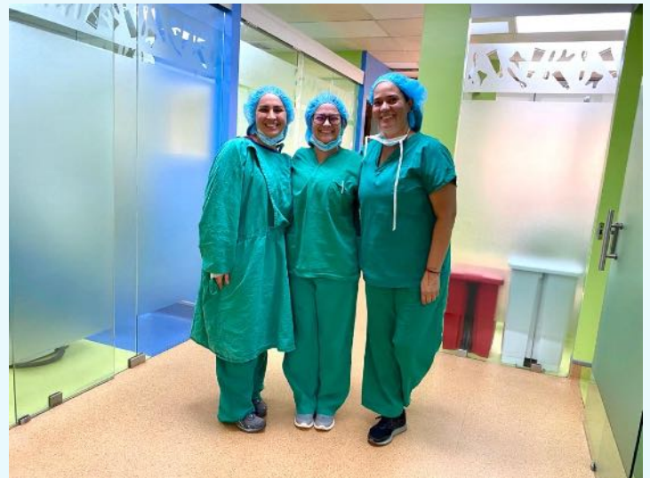
Rotación Hospital Nacional de Niños