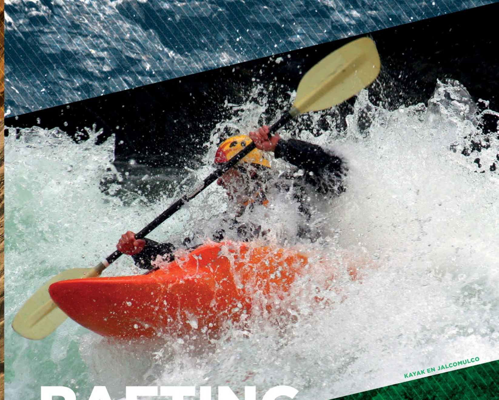
KAYAK EN JALCOMULCO