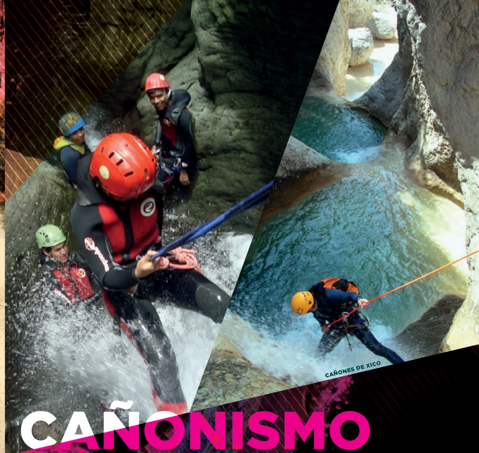
CAÑONES DE XICO