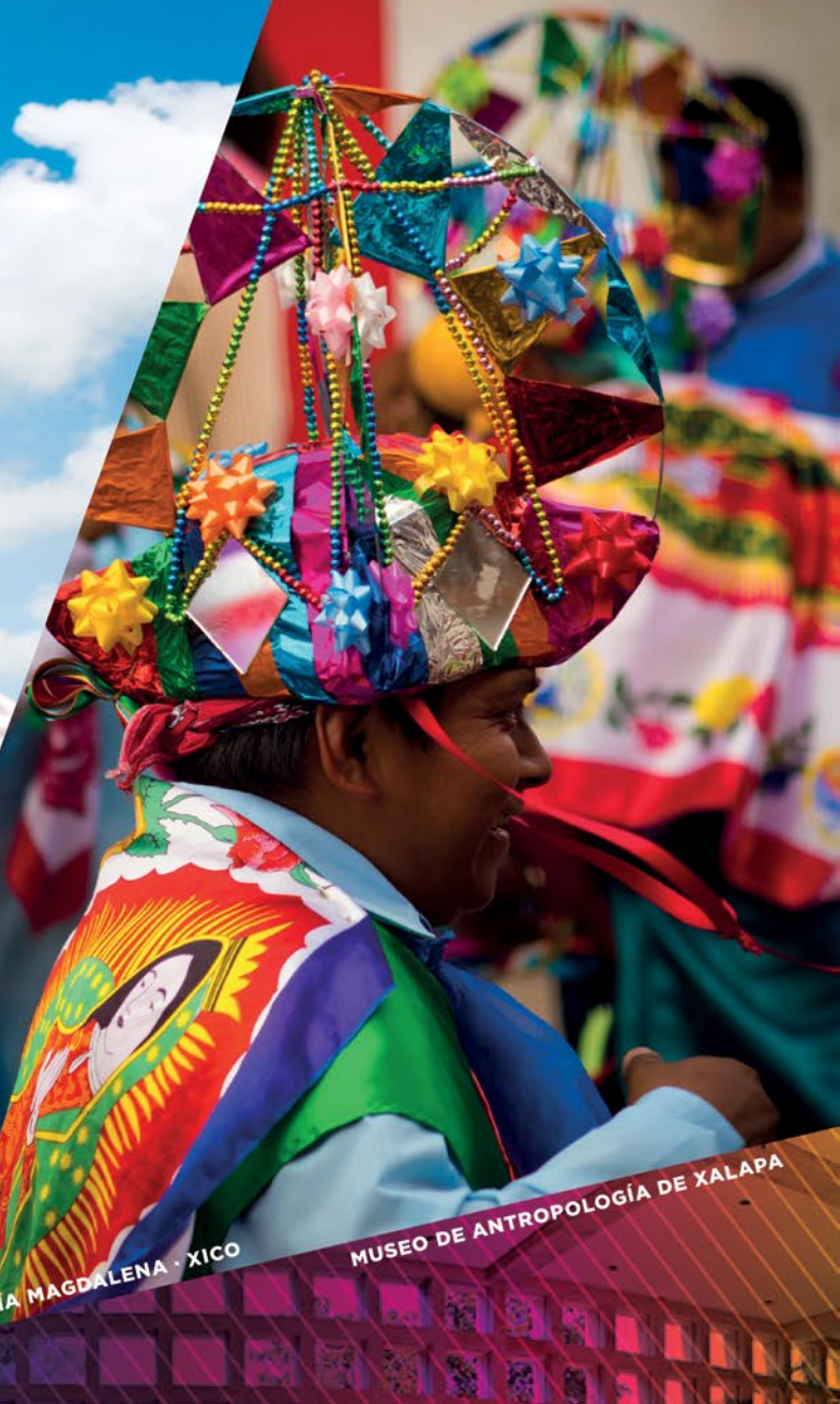
FIESTAS DE MARÍA MAGDALENA · XICO MUSEO DE ANTROPOLOGÍA DE XALAPA

Conocida coloquialmente como “La Ciudad de las Flores” y más recientemente como “La Atenas Veracruzana”, es una ciudad histórica y cultural por excelencia, y aún hoy se distingue por sus atardeceres dorados y noches frescas, que cubren de neblina sus estrechas calles y empedrados callejones. Recorrer cada lugar de esta ciudad te invita a imaginar nuevas historias, a conocer cada rincón y cada avenida, visitar los teatros, caminar por los parques, maravillarte con las espectaculares vistas del Pico de Orizaba, y disfrutar del ambiente bohemio y cultural de la capital bebiendo una aromática taza de café. Xalapa representa la tradición colonial, la tranquilidad y el corazón cultural de Veracruz además de la puerta a los bellos pueblos mágicos enclavados en el Bosque de Niebla Coatepec y Xico.