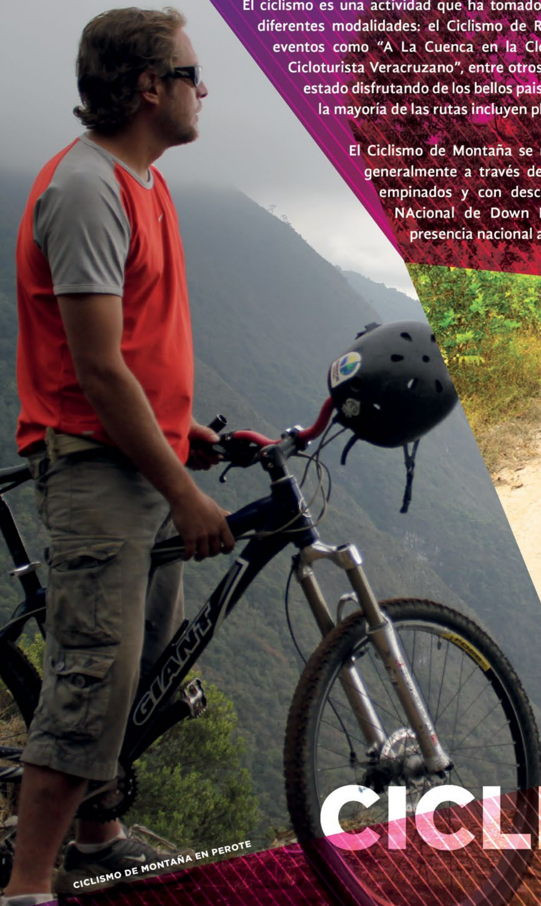
CICLISMO DE MONTAÑA EN PEROTE

El Ciclismo de Montaña se realiza en los circuitos naturales, generalmente a través de bosques por caminos angostos, empinados y con descensos rápidos; eventos como el Nacional de Down Hill y Perote Bike le han dado presencia nacional a Veracruz en estas disciplinas.