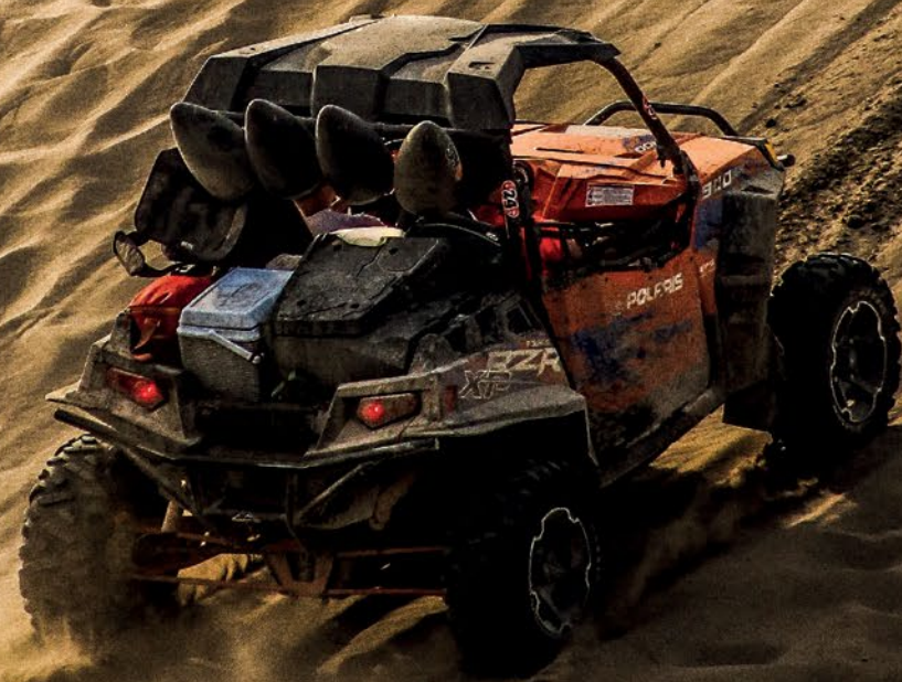
OFF-ROAD EN LAS DUNAS DE CHACHALACAS