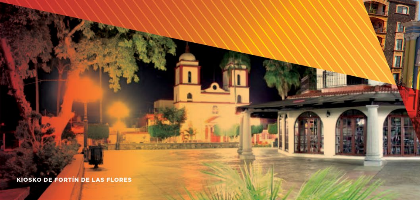
KIOSKO DE FORTÍN DE LAS FLORES