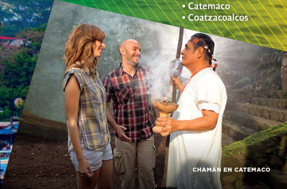
CHAMÁN EN CATEMACO