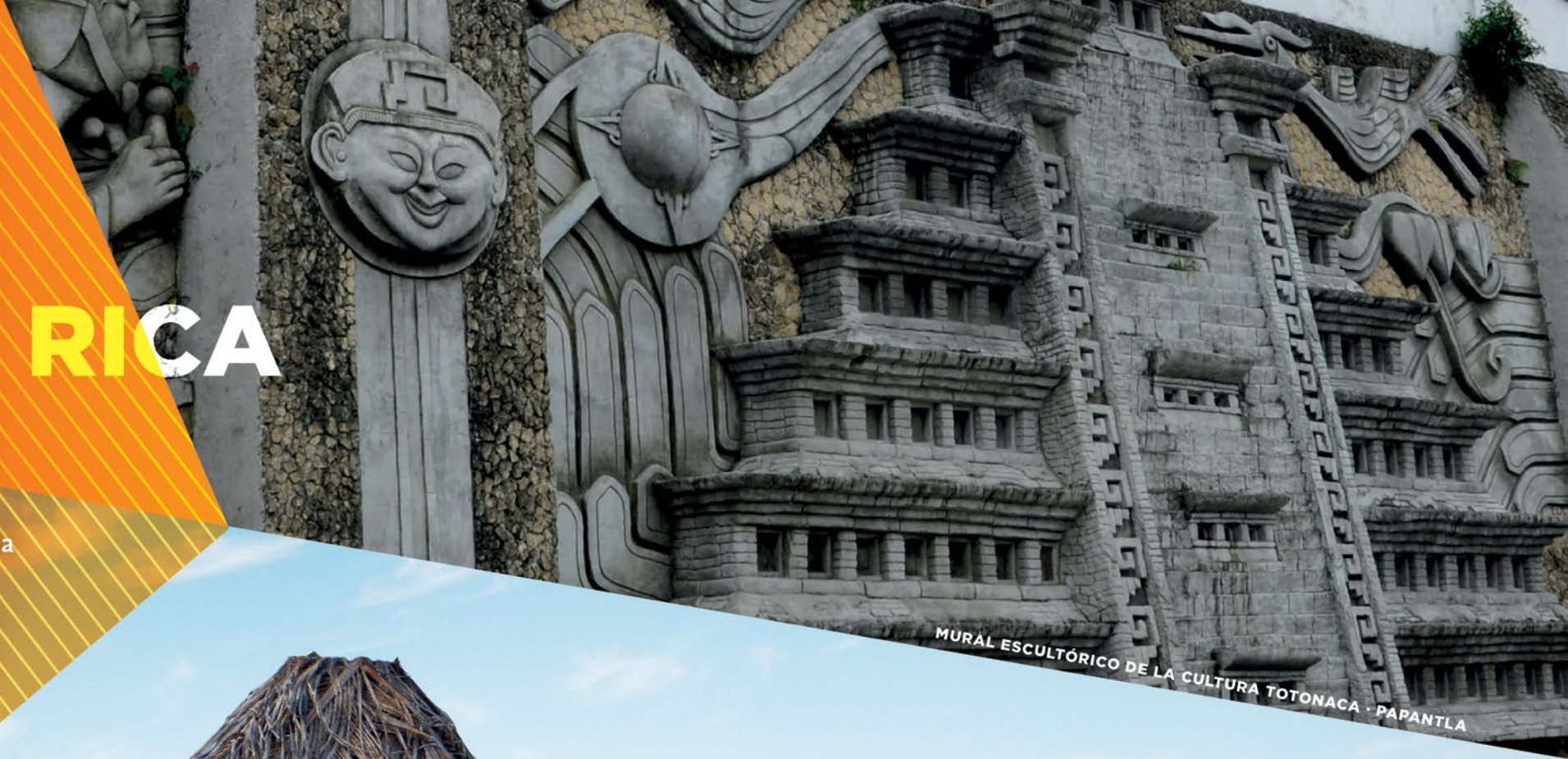
MURAL ESCULTÓRICO DE LA CULTURA TONACA · PAPANTLA

Tuxpan es un estupendo destino turístico, pues conjunta la tranquilidad de una pequeña ciudad provinciana con su riqueza arrecifal paraíso para el buceo y la modernidad de su desarrollo portuario e industrial. Su variedad gastronómica satisface los gustos más exigentes; además de una moderna infraestructura hotelera a la cual se accesa por una autopista que pone sus playas a tan solo 3 horas del Distrito Federal. Papantla pueblo mágico sitio de tradiciones gastronómicas irresistibles, con celebraciones tradicionales muy variadas y enigmáticos sitios arqueológicos como el Tajín y Cuyuxquihui. Poza Rica es la ciudad que enlaza a estos municipios como capital comercial y económica de esta vasta región.