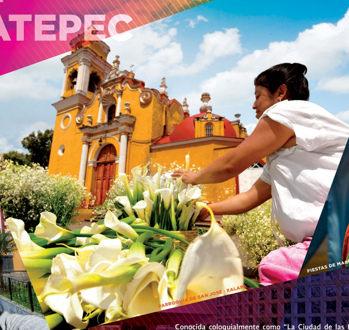
PARROQUIA DE SAN JOSÉ · XALAPA