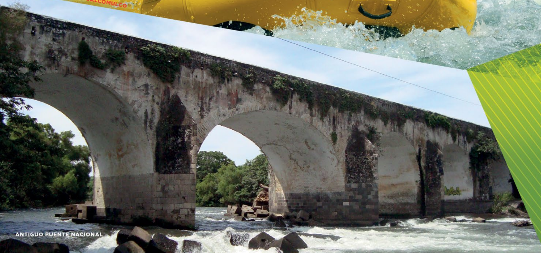
ANTIGUO PUENTE NACIONAL

Diversos operadores de naturaleza y aventura, hacen de la estancia toda una experiencia plena de adrenalina o asombro al disfrutar de la naturaleza realizando caminatas con observación de flora y fauna.