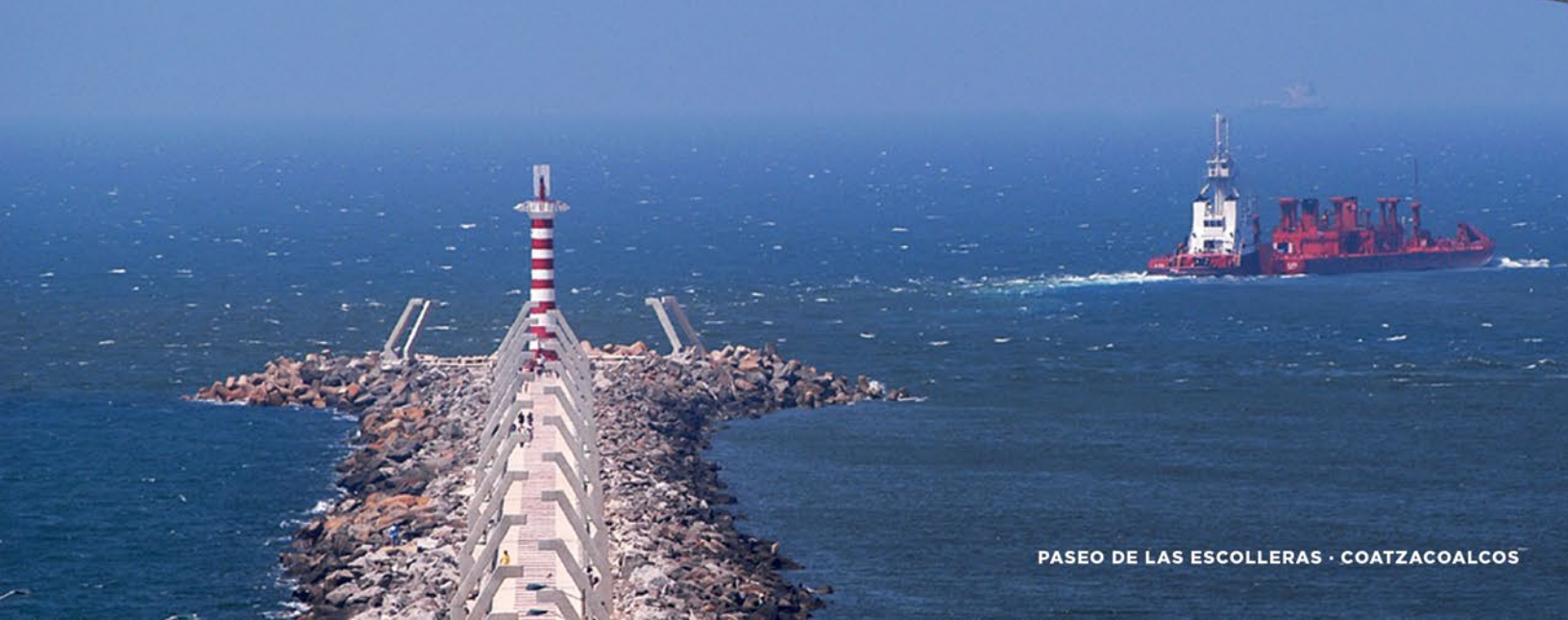
PASEO DE LAS ESCOLLERAS · COATZACOALCOS