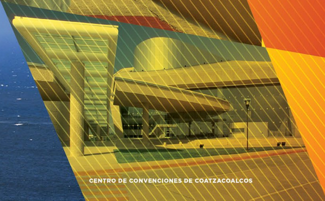
CENTRO DE CONVENCIONES DE COATZACOALCOS