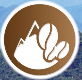
ESCALANDO EL PICO DE ORIZABA