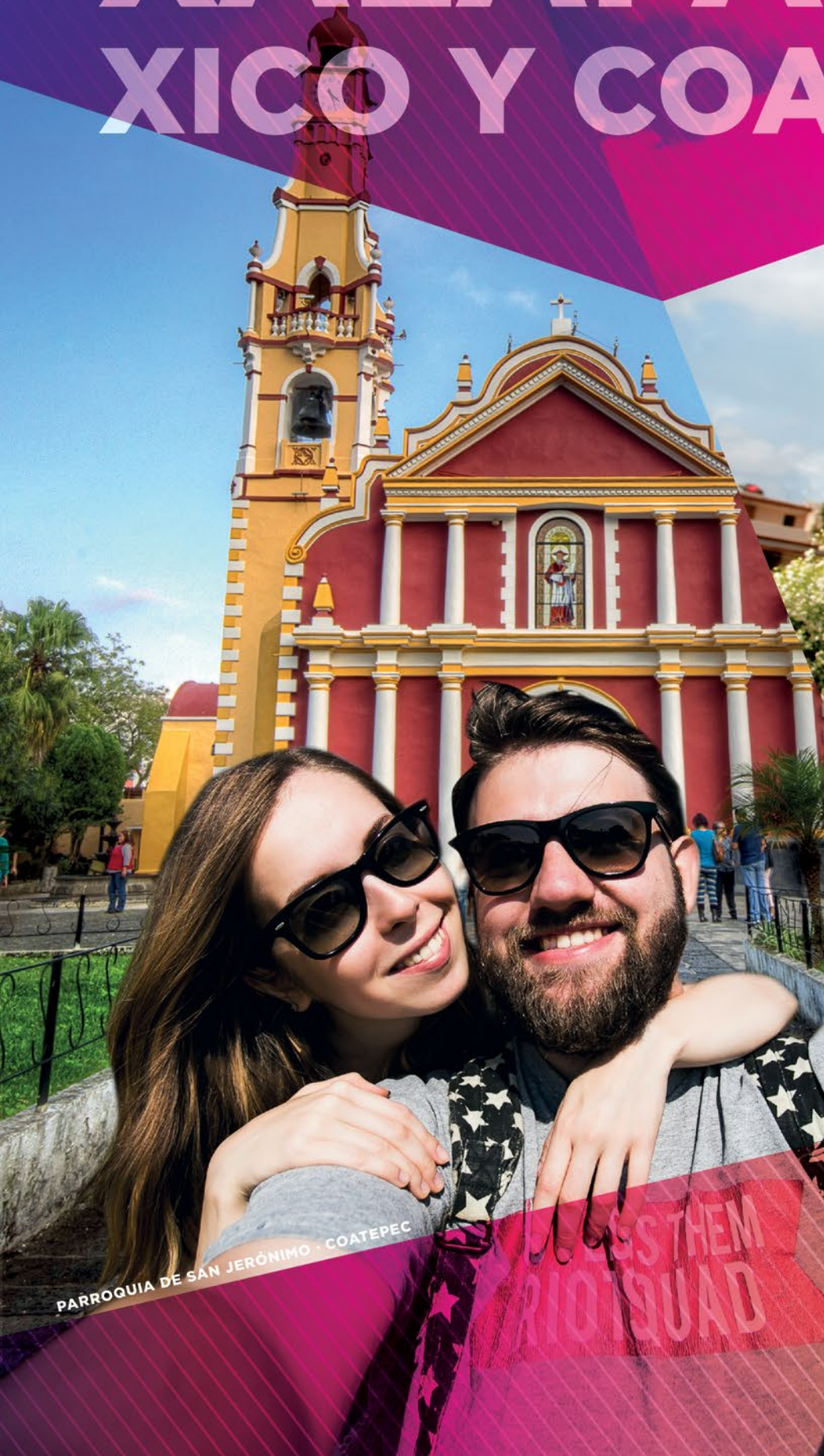
PARROQUIA DE SAN JERÓNIMO · COATEPEC