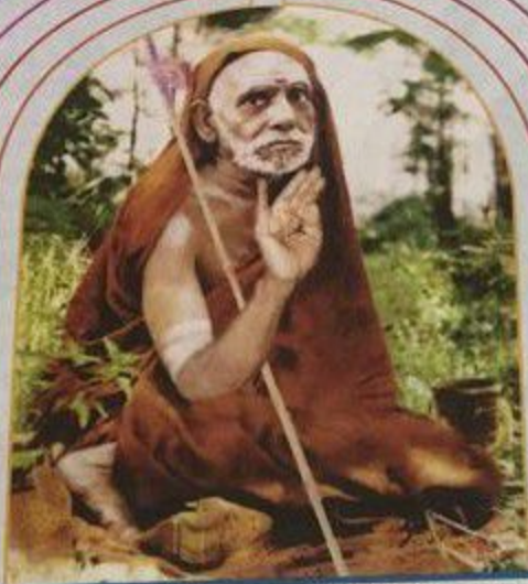
8.1.2024న శ్రీశ్రీశ్రీ కంచినామకోటి పరమాచార్యులు శ్రీశ్రీశ్రీ చంద్రశేఖరేంద్ర పరస్వతి మహాస్వాములవారి జయంతి సందర్భంగా.

అనుకోవచ్చు) అనే ఓ పద్యాలని అశ్రయిస్తారు. ఉదాహరణకి మర్కట కిశోర న్యాయం-మార్కట కిశోర న్యాయం...ఇలా. ఒక పిల్లి తన పిల్లని తీసుకు పోవాలంటే అది, తన పిల్ల మెడమెముక ఉన్న మంద మైన శరీరాన్ని తన పడువైన పళ్ళతో పట్టుకుని అంత బరువైన తన పిల్లని పడిపోకుండా రక్షించుకుంటూ గోడలెక్కడం, నేలమీద పరుగెత్తడం, కొద్ది దూరం పాటు గెంతడం... ఇలా చేస్తూ వెళ్ళిపోతుంది. ఇక్కడ భారమంతా తల్లిపిల్లదేగాని పిల్లపిల్లదికాదు. దీన్ని మార్కటకిశోరన్యాయమంటారు. చిన్నప్పుడు శిష్యుడు తప్పుచేస్తే ఆ తప్పు శిష్యునిదికాదు. ఆచార్య మాగవృత్తి శిష్యుడోష-ఆ గురువుకంత బుద్ధిలేదా? సరిగా పిల్లల్లిమాసుకోద్దూ? అనేస్తారందరూ. సైతం గ యలకి పిల్లవాడొచ్చాక, ఒక తీరు అవగాహనంటూ కలిగాక ఉండేది 'మర్కట కిశోరన్యాయం'. కోతి ఎక్కడికైనా తన సంతానాన్ని పట్టుకువెళ్ళాలంటే ఆ కోతిపిల్ల తన రెండు కాళ్ళతో తన రెండు చేతులతో తన తల్లి పాట్లని గట్టిగా పట్టుకుంటుంది. తల్లి ఎంత వేగంగా పరుగెత్తినా చెల్లిక్కినా దీగినా దూకినా పడిపోకుండా తనని తాను రక్షించుకోవలసిన బాధ్యత పిల్లదే ఇక్కడ. పై న్యాయానికి దీనికీబేదాన్ని గమనించాం కదా! ఇరుగో ఈ చెప్పుదాన్నే 'న్యాయ'మంటారు శాస్త్ర పరిభాషలో. భూమి సూర్యుని చుట్టూ తిరగడాన్ని