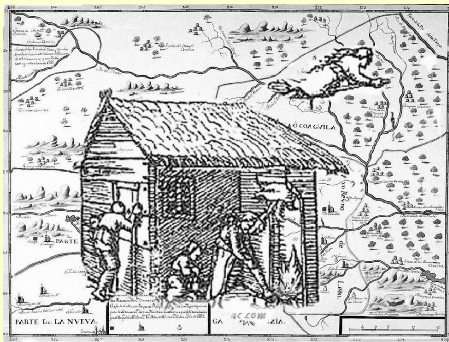
Brujas volando por Coahuila y Nuevo Reino de León