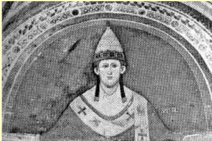
Papa Inocencio III

Valdenses, etc., quienes sostenían que la única salvación para la religión estaba cimentada en :La castidad, la pureza, la moderación y la humildad, las cuales no eran practicadas por el Clero.