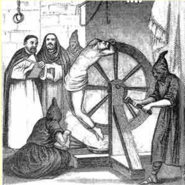
El tormento llamado “potro”.