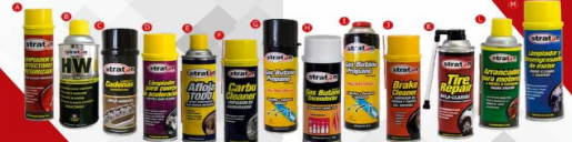
LÍNEA DE AEROSOLES

AEROSOLES PINTURAS ADITIVOS Y FLUIDOS ANTICONGELANTES DETALLADO AUTOMOTRIZ