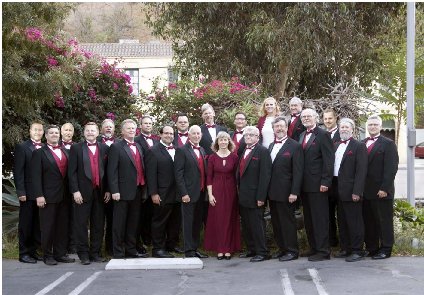
Losandželosas latviešu vīru koris „Uzdiedāsim, brāļi!”