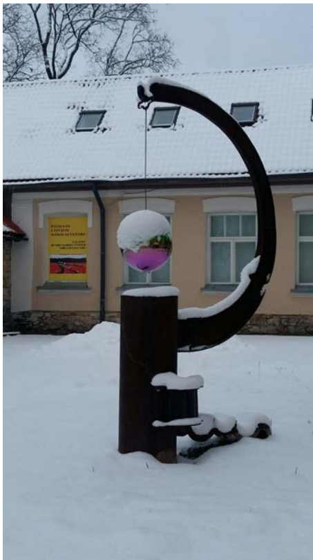
Tēlnieka Jāņa Mintika darinātā metalla skulptūra uz Cēsīm atvesta no Jaunmeksikas, ASV

PLMC jaunās kolekcijas kodolu veidoja vairāku tādu mākslinieku darbi, kas plašākai publikai Latvijā nav vēl pazīstami, kā, piemēram, Rolands Kaņeps. Aizritējušā gadsimta 60.-70. gados viņš pieslējās Ņujorkas avangar-