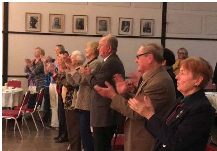
Pēc koncerta ilgi nerimās aplausi