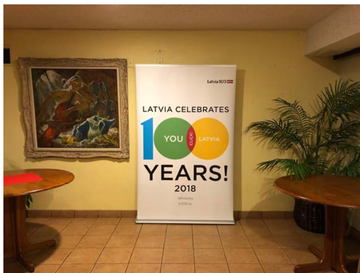
Latvijas vēstniecības ASV Losandželosas latviešu namam atsūtītais plakāts