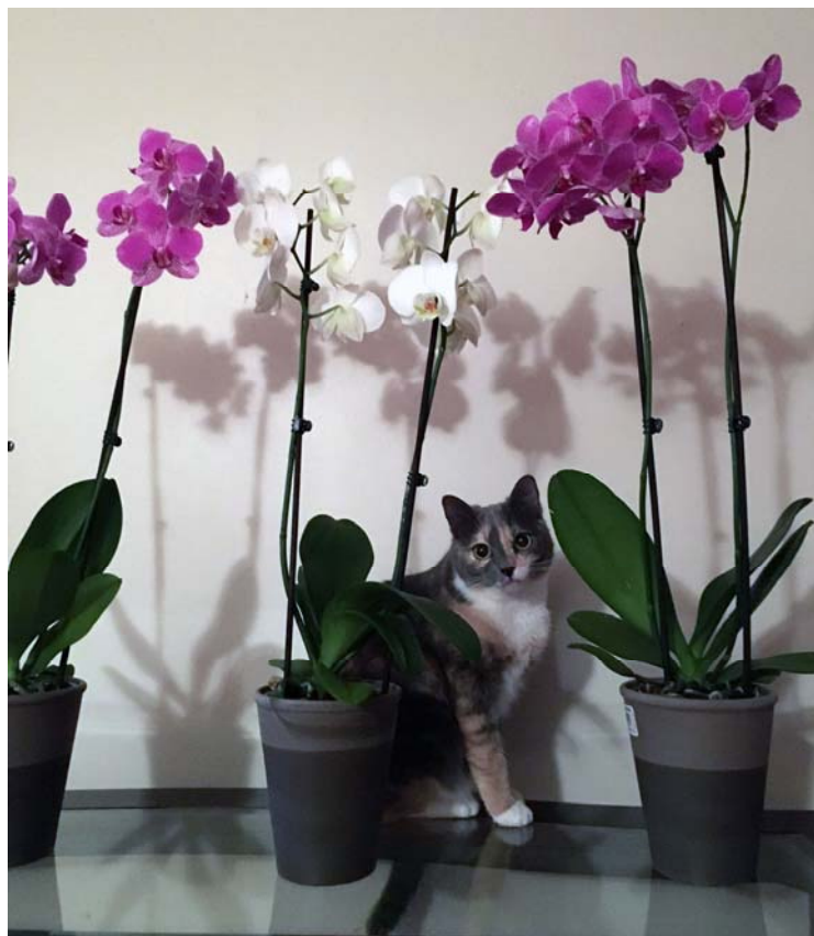
Teteru ģimenes mīlule Trīne