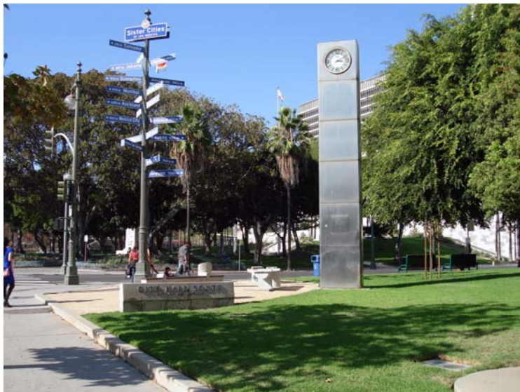
Losandželosas māsu pilsētu ceļrādis un Nagojas pilsētas amatpersonu dāvātais pulkstenis

No Brodveja un Arcadia krustojuma līdz pat Olvera Street ielai ietves malā augu dienu stāv rindā novietoti neskaitāmi bezpajumtnieku ratiņi, kušos sakrauta viņu mantība. Netālu ir Our Lady Queen of Angels Church , kur bezpajumtnieki dabū vakariņas un turpat tuvumā uz ielas pārnakšņo.