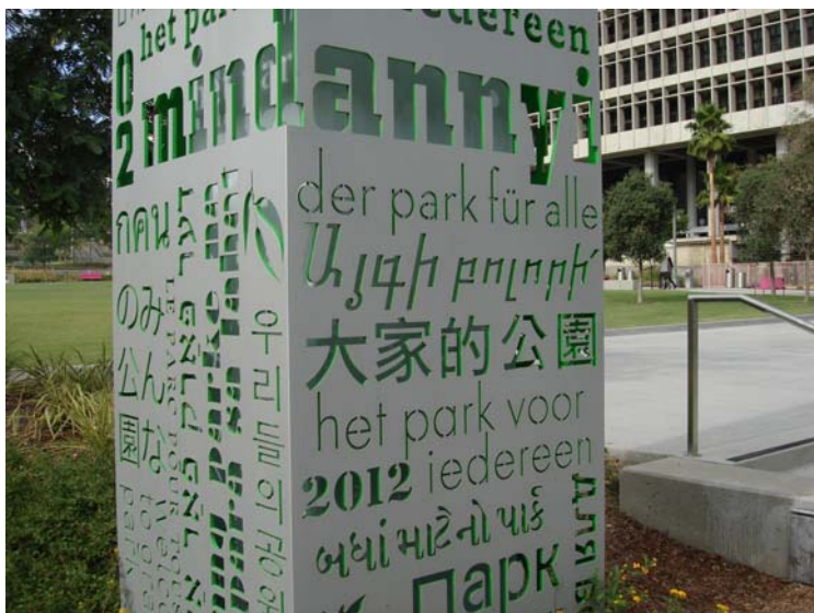
Pie ieejas jaunatvērtais Grand Park