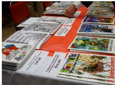
Grāmatas, eglīšu rotājumi, rotaļlietas – tirdziņā izvēle bija liela un vienam otram pircējam tāpēc diezgan grūta