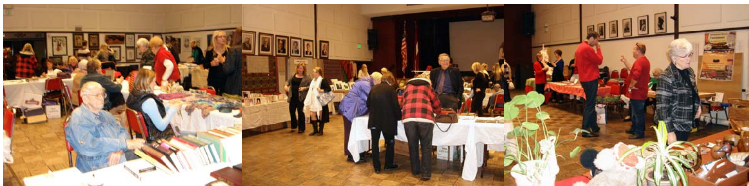
Latviešu nama lielajā zālē 8. decembrī valdīja liela rosība – kā jau tirgū!