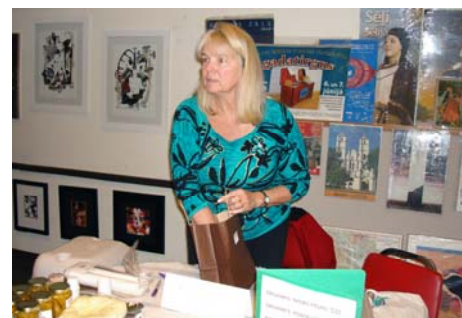
Intas Zemjānes sieri ir ļoti gardi!