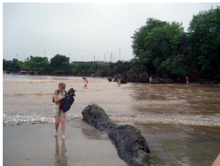
Pie Kurzemes upes ietekas Karību jūrā