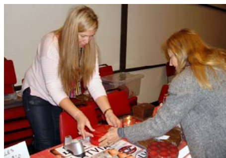
Sandras Gulbes piparkūkām un kūkiem pircēju netrūka