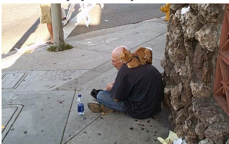
Bezpajumtnieks Losandželosas centrā ar savu mīluli un uzticamo draugu uz pleca; garāmgājēji parasti dzīvniekus žēlo un ziedo labprātāk