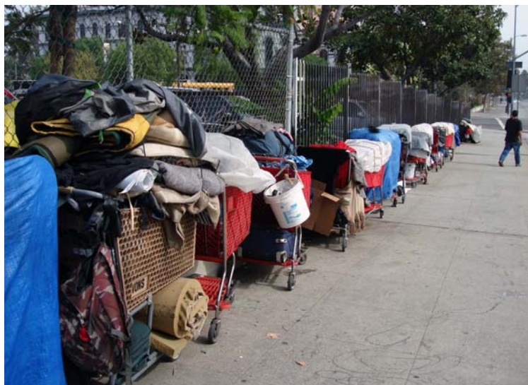
Uz ietves novietotie bezpajumtnieku ratiņi