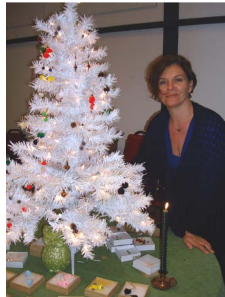
Rudītes Godfrejas rotas varētu būt arī skaists eglītes greznojums