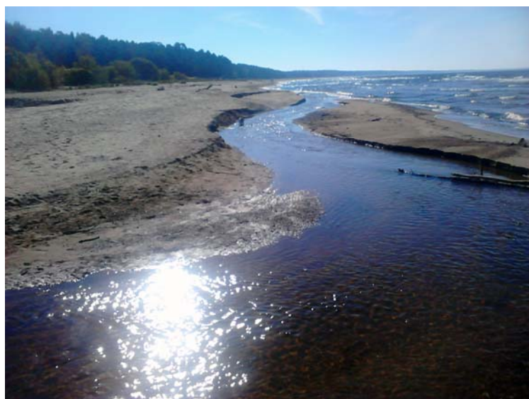
Ķīšupes ieteka jūrā pie Saulkrastiem